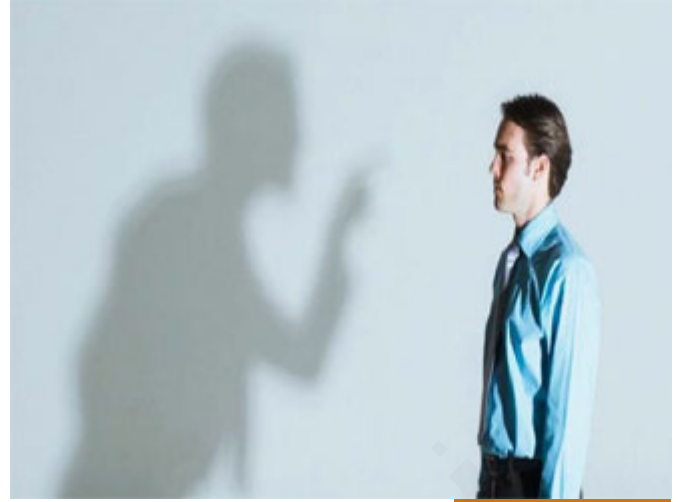
كل إنسان فينا يعرف نفسه

أحبابنا الكرام، عموم الناس، كل إنسان فينا يعرف نفسه، ويظهر هذا الأمر خاصة في الصغار أكثر من الكبار، بعض الناس يستجيبون للترك، وبعضهم يستجيبون للعطاء، يعني أولادك؛ عندك ولدان؛ ولد تقول: سبحان الله هذا الولد لا يأتي إلا بالإكرام، قل له: هناك مكافأة لك إن أتيت بـ 100 من 100 في الامتحان دراجة يأتي بها فوراً وبأخذ الدراجة، الولد الثاني لا تغريه هذه الأمور، أقول له لك مكافأة لا يستجيب، لكن إذا قلت له إن أتيت بـ 100 فإنني أعفيك من العقوبة، لا تعاقب يعمل، البعض يستجيب لأن تخلي عنه شيئاً من الهموم، والبعض بأن تصيف له شيئاً من العطاء، هذه طبيعة الناس، كل الناس عندهم الجانبان معاً، لكن بعض الناس يطغى عندهم هذا على ذلك، والبعض ذاك على هذا، والقرآن الكريم يراعي صنفي الناس، والسنة تراعي، مثلاً: رسول الله صلى الله عليه وسلم يقول: