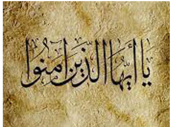
ينادينا الله تعالى لأمر جلال

كلما كان المنادي عظيماً كانت الاستجابة أعظم: