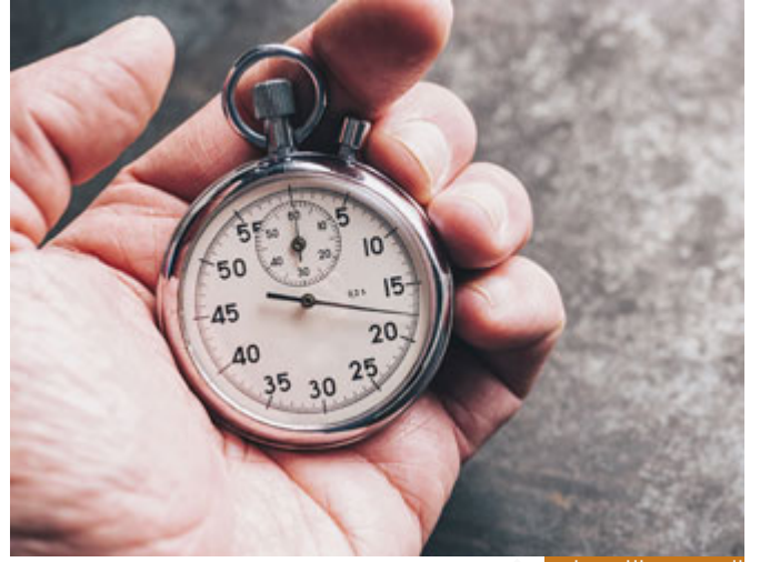
الزمن عند الله مخلوق

الزمن عند الله مخلوق، كُن سبكون، لا يوجد زمن عند ربنا، نحن عندنا الزمن بحكمنا ولا بحكمه، لذلك قال: تَضُرُّ مِّنَ اللَّهِ وَقَتُّ قَرِيبٌ وَبَشِّرِ الْمُؤْمِنِينَ بشرهم بالنصر، لكن الفوز قال: ذَلِكَ الْفَوْزُ الْعَظِيمُ تحقق، والنصر بشرى فادمة إن شاء الله تعالى، بطول زمنها أو يقصر هذا يعلم الله تعالى، وبقوة الله تعالى، وبحكمة الله تعالى، لأنه لا يعلم ما يكون فيه الخير للأمة إلا الله تعالى، ويوم القيامة عندما تكتشف الحقائق يقول الخلائق كلهم بصوت واحد: