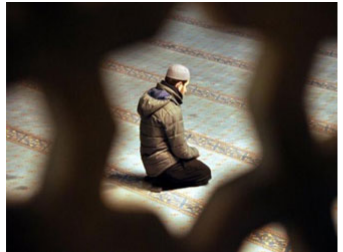
الذكر أوسع نشاط يفعله الإنسان