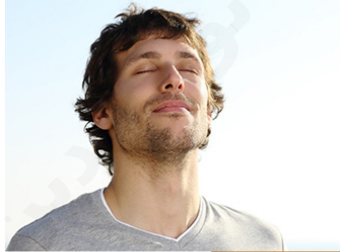
الخروج من شهر رمضان بنوعية

أرجع وأقول: معاذ الله، معاذ الله، معاذ الله، ثلاثاً إن أكون أخف من أهمية الإكثار من العبادات والنوافل والطاعات، ولا سيما في شهر الخير، ولكنني أريد مع الكمية نوعاً، فإذا كانت الكمية ستؤثر على النوع، أو ستجعلك مهتماً فقط بكم ختمه ختمت، لا، نعود للنوع، إذا كنت تستطيع أن تكثر من الكم مترافقاً مع النوع فعلى العين والرأس، هذا ما نريده.