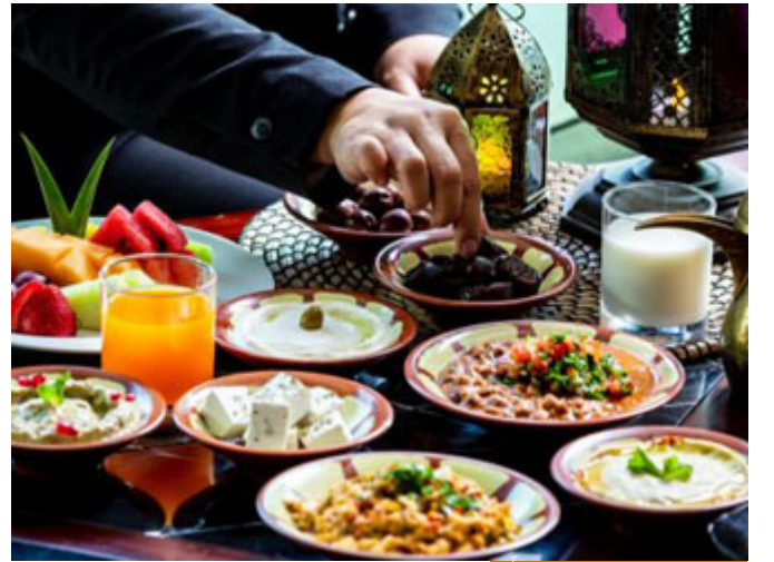
من ترك الصيام بغير عذر أثم

انظروا إلى هذه المدرسة التربوية، هي مدرسة التسليم لأمر الله، 1 رمضان صيام، المفطر بغير عذر أثم، 1 شوال فطر، الصائم أثم، إذا نحن نتعبد الله وفق المصلحة التي يقرها الله تعالى، فالله تعالى يقول لنا إن مصلحتكم من 1 رمضان إلى 29 أو 30 رمضان هي الصيام، فمن ترك الصيام بغير عذر أثم؛ لأنه ترك شيئاً يُلصحه، فلا بد أن يُعاقب على ذلك، كالطفل تماماً يعني قد يصف له الطبيب دواء، فمصلحته في الدواء، لكن الطفل يرى أن مصلحته في ترك أخذ الدواء؛ لأنه يراه مر الطعام، فيجره والداه على أخذ الدواء؛ لأنهما يعلمان أن في الدواء مصلحة، لكن هو يظن أن مصلحته في ترك أخذ الدواء، لِمَا يرى من مرارته في فمه، في أفضه البسيط الضيق الذي يتناسب مع عمره، والإنسان مصلحته في شرع الله تعالى، فعندما نقول إن العبادات شرعت لمصالح الخلق، فنقصد بالمصالح الحقيقية، لا المصالح المتوهمة، كل إنسان يتوهم مصلحته في شيء، فقد يتوهم إنسان مصلحته في الزنا، وآخر في الربا، وآخر في العيش، وآخر في الاحتكار، لكن كل ذلك ليس مصلحة، هذا مفسدة ولكنه ظنها مصلحة له.