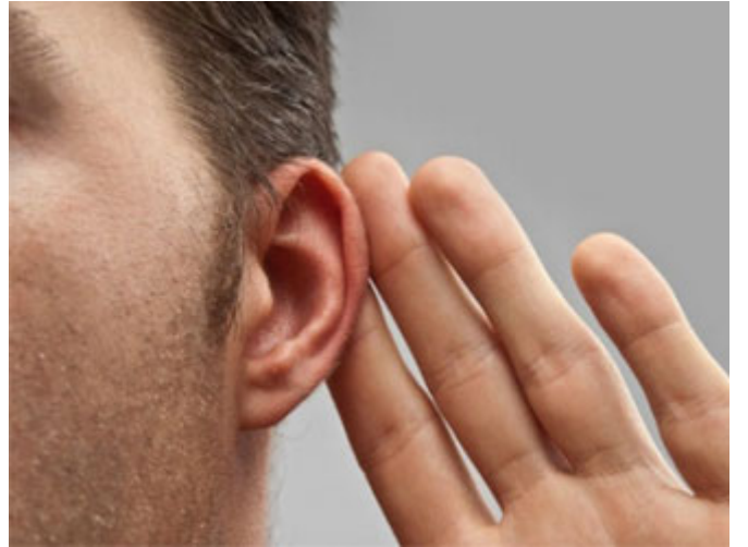
الوحي هو الإعلام بخفاء

(وَأَوْحَيْنَا إِلَيْهِ) إلى يوسف، والوحي: هو الإعلام بخفاء من غير أن يشعر الآخرون، قد توحى إلى إنسان بشيء فتعلمه بما تريد منه من غير أن يشعر الجالسون، فإذا كان الأب في مجلس وعنده بعض الصيوف قد يوحى إلى ابنه بأن يذهب ويحضر الضيافة دون أن يشعر الجالسين بهذا، فهذا اسمه وحي، الإعلام بخفاء يسمى وحيًا، والوحي إذا جاء إلى الأنبياء فهو الوحي المعروف شرعاً وهو ما يُعلمه الله تعالى لأبيائه ولرسله عن طريق ملكٍ من الملائكة الموكلين بذلك، لكن قد يكون الوحي بمعنى الإلهام، فأم موسى مثلاً ليست نبياً ولا رسولاً، ومن شروط النبوة والرسالة المذكورة حتى يقوم النبي والرسول بأعباء الرسالة وما يواجهها فيها، فهي ليست رسولاً وليست نبياً، ومع ذلك أوحى إليها الله تعالى: