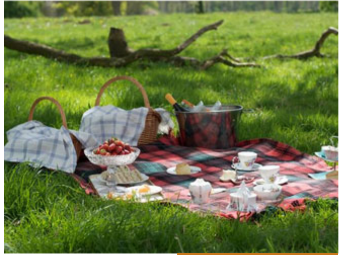
الخلل في شرط ذهب يوسف مع إخوته

(وَتَرَكْنَا يُوسُفَ عِنْدَ مَتَاعِنَا) وهذا خللٌ عظيمٌ في الشرط الذي اشترطوه على أنفسهم، فهم اشترطوا أن يحمو يوسف فإذا بهم قد أخذوه ليحمي أمتعتهم، هم لما قالوا: (أَرْسِلْهُ مَعَنَا) (وَإِنَّا لَهُ لَحَافِظُونَ) (وَإِنَّا لَهُ لَنَاصِحُونَ) فإذا بهم يقولون: (وَتَرَكْنَا يُوسُفَ عِنْدَ مَتَاعِنَا) الولد الصغير تركتموه ليحفظ لكم أمتعتكم وأنتم تلعبون؟! أنتم ذهبتم ليلعب هو ولتقوموا أنتم برعايته! وهذا بداية كذبهم.