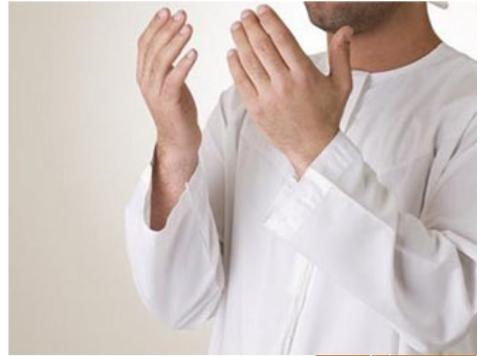
الاستعانة بالله أصلٌ في ديننا

بِسْمِ اللَّهِ الرَّحْمَنِ الرَّحِيمِ إِنَّاكَ تَعْبُدُ وَإِنَّاكَ تَسْتَعِينُ