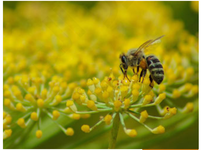
وحي الغريزة عند النحل

فالنحل وحيها وحي غريزة بمعنى أن الله عز وجل أودع فيها هذا الأمر، فلو جئت إلى نحلة وأجريت معها مقابلةً وسألتها: لماذا تتخذين من الجبال بيوتاً؟ ولماذا تصنعين العسل؟ وكيف تصنعين هذا الشكل السداسي؟ لما عرفت جواباً! فهي تسيب بغريزتها، سخرها الله لنا لتصنع لنا العسل، فهذا وحي الغريزة، فهناك وحي نبوة وهناك وحي إلهام وهناك وحي غريزة، وكل أنواع الوحي هي إعلامٌ بخفاء؛ أن تُعلم شيئاً من جهٍ إلى جهٍ من حيث لا يدري الآخرون؛ الإعلام بخفاء.