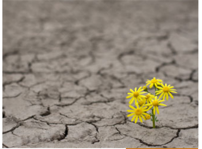
الصبر على ما يحزنك ولا تریده

مَرَّ النَّبِيُّ صَلَّى اللَّهُ عَلَيْهِ وَسَلَّمَ بِأَمْرٍ يُبْكِي عِنْدَ قَبْرِ، فَقَالَ: اتَّقِيَ اللَّهَ يَا صَبْرِي قَالَتْ: إِنَّكَ عَنِّي، فَإِنَّكَ لَمْ تُصَبِّ بِمُصِيبَتِي) فلما مضى (قيل لها: إِنَّهُ النَّبِيُّ صَلَّى اللَّهُ عَلَيْهِ وَسَلَّمَ) فجاءت إلى النَّبِيِّ صَلَّى اللَّهُ عَلَيْهِ وَسَلَّمَ فاعترت، فَقَالَ النَّبِيُّ صَلَّى اللَّهُ عَلَيْهِ وَسَلَّمَ: { إِنَّمَا الصَّبْرُ عِنْدَ الصَّدْمَةِ الْأُولَى }