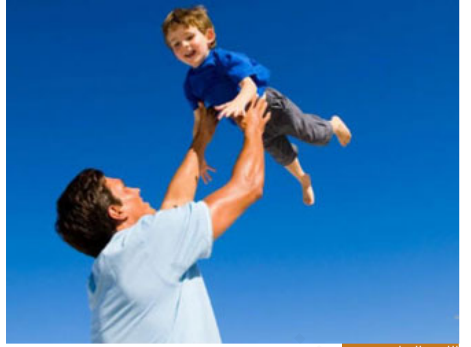
اللعب المباح مسموح

(هذه بَيْلَةُ السَّبَقِ) يعني واحدة بواحدة صلى الله عليه وسلم، فكان يسابق زوجته، واليوم ربما يأنف كثير من الرجال أن يسابق زوجته أو يسابق حتى أولاده، لكن المؤمن يسابق بلعب يتحرك، واللعب المباح مسموح ما دام لا يلهي عن طاعة ولا يشغل عن ذكر، فما دام هذا اللعب لا يشغلك عن طاعة من الطاعات فقد يصح هذا اللعب عبادة إذا أدخلت به السرور على قلبك، أو قلب زوجتك، أو قلب أولادك، فالاستيقاق مشروع شرعاً، وهذا يُستأنس به في مشروعية السباق، يذكره بعض الفقهاء في مشروعية السباق (إِنَّا دَهَبْنَا تَسْتَيْقُ) لأن هذا لو لم يكن مشروعاً لما باحوا به لأبيهم النبي (إِنَّا دَهَبْنَا تَسْتَيْقُ) إما عدواً أو بالثبيل والسهام.