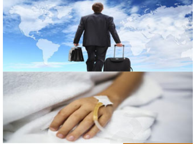
المرض والسفر مباحان للفطر

لكن إن لم تستطع أن تكمل الصيام في رمضان لعذر شرعي، وهنا حدد عذرین اثنين، وهما عذر المرض وعذر السفر، فإن أفطر الإنسان (فَعِدَّةٌ مِنْ أَيَّامٍ أُخَرَ) وقوله: (مِنْ أَيَّامٍ أُخَرَ) دلالة على أنه لا يشترط أن تتابع في الأيام، أي لو أفطر سبعة أيام في رمضان فلا يشترط أن يأتي بالأيام السبع التي أفطرها متتابعة، وإنما له أن يصومها طوال العام، هذا شأنه كما يريد، قال (مِنْ أَيَّامٍ أُخَرَ) وما حددها، وهذا أيضاً من تيسير الله (فَعِدَّةٌ مِنْ أَيَّامٍ أُخَرَ).