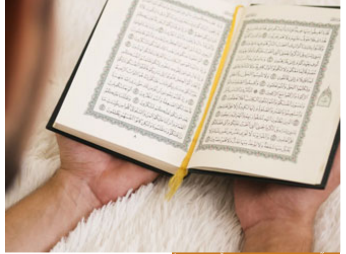
القرآن الكريم كلما زدتَه تدبراً زادك عطاءً

قال: (شَهْرُ رَمَضَانَ الَّذِي أُنزِلَ فِيهِ الْقُرْآنُ هُدًى لِلنَّاسِ وَبَيِّنَاتٍ مِنَ الْهُدَى وَالْفُرْقَانِ) وأجد أن الكلام طويل، كنت أريد أن أتحدث في هذا اللقاء عن كل آيات الصيام لكن القرآن كريم، ما معنى قرآن كريم؟ أي كلما زدتَه تدبراً زادك عطاءً، فأنا عندما حصر في ذهني بعض الأمور التي أريد أن أقولها في هذا اللقاء الطيب، ما كنت أتخيل أنها بهذه الكمية، فالآن كلما وجدت كلمة تقودني إلى أخرى، وهذا من بلاغة القرآن، وكيف لا يكون كذلك وهو تنزيل من الرحمن الرحيم.