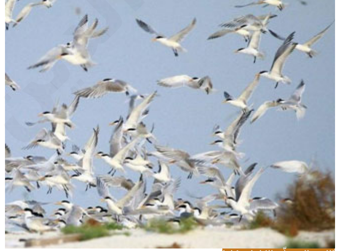
الله تعالى علم الكائنات كلها

تشمل كل المخلوقات، طيور تهاجر وتعود إلى مكان ولادتها ولو انحرفت عن مسارها قيد أنملة لجاءت في بلد آخر بعيد كل البعد عن موطن ولادتها لكنها تعود، سمك السلمون لا يموت إلا في موطن ولادته بهاجر ثم يعود؛ هذا كله تعليم، الله تعالى علم الكائنات كلها ما يؤهلها لحياة تؤدي فيها مهمتها التي خلقها الله لها، لكن أفرد الإنسان بقوة إدراكية تجعله يتعلم أكثر كماً ونوعاً، ومملكه ذاته ليتعلم، ما معنى الأمانة لما قال تعالى: