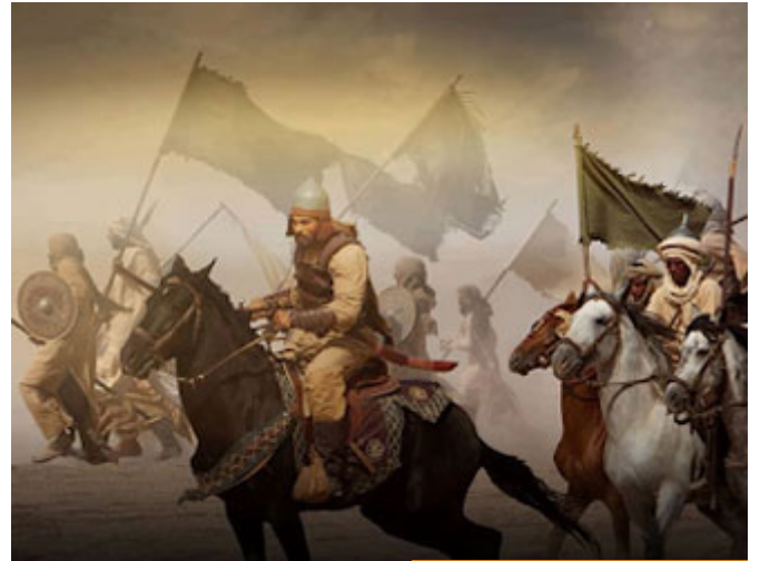
البديريين هم من شاركوا في غزوة بدر

بارك الله بكم، الحقيقة أن "البديريين" مصطلح يطلق على من شاركوا في غزوة بدر الكبرى، معركة الفرقان، هذه المعركة التي جرت في السابع عشر من رمضان في العام الثاني للهجرة، وتُنسب إلى الموقع الذي حصلت به وهو بئر بين مكة والمدينة مشهور يدعى بئر بدر، وهذه المعركة شارك فيها جمعٌ من الصحابة الكرام، كثير منهم من المهاجرين، وهناك أيضاً من الأنصار، وهؤلاء في ثلاثمائة رجل وتُف: سبعة عشر أو أربعة عشر أو عشرة على اختلاف الروايات، لكن هم ثلاثمائة رجلاً، على رأسهم سيدنا محمد صلى الله عليه وسلم، وفيهم علي وعثمان، وفيهم عمار وعمر، وفيهم مصعب، وفيهم حاطب بن أبي بلتعة الذي عفى عنه النبي صلى الله عليه وسلم وقال إنه شهد بدرًا، فوضح النبي صلى الله عليه وسلم أن لأهل بدر مكانة خاصة، وكان دائماً يقول عنه: إنه شهد بدرًا، أو يقول: