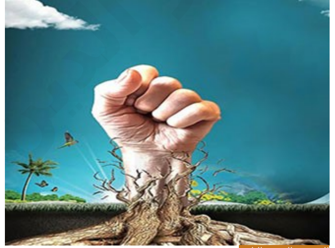
الحق هو الشيء الثابت

مهما بدا من انتفاش فهو زائل، زهوق أي كثير الزوال، لا يبقى ولا يدوم، وأما الحق فهو الشيء الثابت والهادف، فعندما ننشئ جامعة مثلاً هذه شيء ثابت وهادف، وعندما ننشئ سيركاً فهو لأيام عابث وزائل، وشتان ما بين الحق والباطل، فالحق شيء ثابت، والباطل شيء زائل، فعندما قال تعالى: ﴿أُولَئِكَ هُمُ الْمُؤْمِنُونَ حَقًّا﴾ هذه حقيقة الإيمان، هذا الشيء الثابت في الإيمان، بمعنى أن الله تعالى لو قال مثلاً: أولئك هم المؤمنون، لطرط طارط أن الإيمان يتعلق بهذه الأمور، وأن من ترك شيئاً منها فهو غير مؤمن، لكن الله تعالى قال: ﴿أُولَئِكَ هُمُ الْمُؤْمِنُونَ حَقًّا﴾ أي هؤلاء بلغوا حقيقة الإيمان، بحيث أصبح إيمانهم ثابتاً، لا تشبه سبائك الذهب اللامعة، ولا سباط الجلادين اللاذعة عن دينهم، بمعنى أنهم في مأمن من الشهوات والشبهات، فلا يمكن لشهوة أن تقتلعهم من دينهم، فيترك دينه ليشهوه طارئة من مال أو نساء أو رجال أو شيء من الدنيا، ولا يمكن أن تأتي شبهة يسمعاها في الإعلام، أو يقرؤها على وسائل التواصل، فتحرك دينه وتزعزعه وتزعزع ثقته بربه، ﴿أُولَئِكَ هُمُ الْمُؤْمِنُونَ حَقًّا﴾ الذين استقر الإيمان في قلوبهم فلا يمكن أن يزعه شيء.