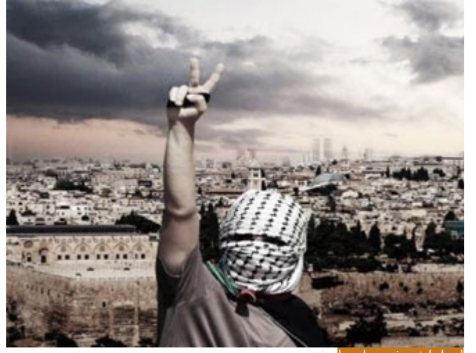
أخواننا في غزة جاهدوا

إخواننا في غزة جاهدوا، ولو نظرنا في تاريخهم من سنوات نجد أنهم قد أعدوا الأنواع الثلاثة ق-بل أن يدخلوا أرض المعركة، فكنا نسمع عن دروس العلم، ونسمع عن جهاد النفس والهوى، وعن قوتهم في الحق، وكنا نجد بانفسنا كيف يخرجون دفعات الحُطَّاط لكتاب الله تعالى، والمتعلمين لكتاب الله تعالى، ثم رأينا اليوم باعيننا كم كانوا في الجهاد الثنائي يعدُّون للمعركة، فاستنفدوا الثلاثة فاستحقوا الرابعة، وشرف الرابعة، استحقوا شرفها بغض النظر عن النتائج، استحقوا شرفها لمجرد أنهم خاضوها بعد الإعداد. فأحبابنا الكرام، هَلْ أَدُلُّكُمْ عَلَىٰ تِجَارَةٍ تُنْجِيكُمْ مِّنْ عَذَابٍ أَلِيمٍ*تُؤْمِنُونَ بِاللَّهِ وَرَسُولِهِ وَنُجَاهِدُونَ فِي سَبِيلِ اللَّهِ بِأَمْوَالِكُمْ وَأَنْفُسِكُمْ ۖ ذَٰلِكُمْ خَيْرٌ لَّكُمْ إِن كُنْتُمْ تَعْلَمُونَ