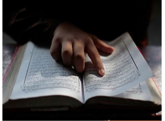
إقامة الدين تختلف عن التدبُّن

إقامة الدين أئمة الإخوة تختلف عن التدبُّن، ولنضرب على ذلك مثلاً: