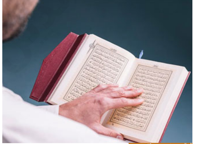
قُرَّانَ الْقَجْرِ له مَزِيَّةٌ عظيمة

قُرَّانَ الْقَجْرِ له مَزِيَّةٌ خاصة، هذه المزية أن النفس في الصباح تكون مُفْرَعَةً من شواغرها، هدوء، ليس هناك ما يشغل النفس من أعمال النهار وحسابات النهار وهموم النهار وإنما هي صفاء وروحانية وسكينة وهدوء، فلذلك كان لقرآن الفجر مزية خاصة، فإذا قرأ الإنسان في صلاة الفجر صفحةً من كتاب الله أو صفتين وتأمل بهما وتدبرهما وتمعن في معانيهما وتمعن في فهمهما، هذا هو التدبر الذي يريده الله تعالى منا، إنَّ قُرَّانَ الْقَجْرِ له مَزِيَّةٌ عظيمة، والمغبون هو الذي يترك هذه المزية، المغبون هو الذي ينام عن صلاة الفجر، المغبون هو الذي يؤدي صلاة الفجر من غير خشوع ومن غير تدبر ومن غير أذكار ومن غير إعطاء هذه الفريضة حقها الذي أرادته الله تعالى.