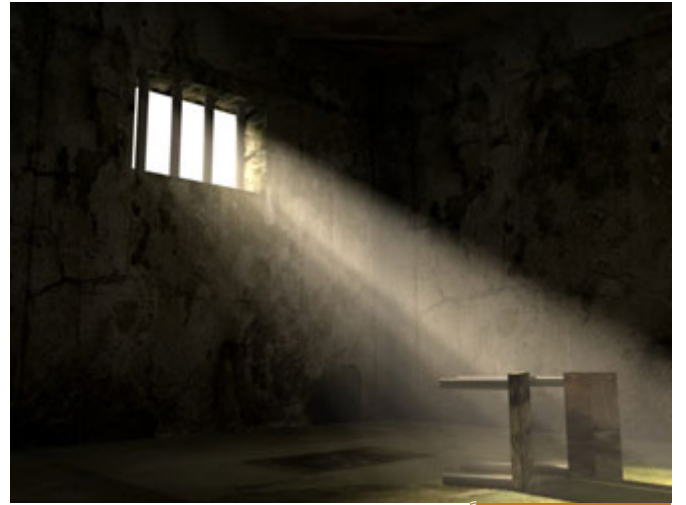
سيدنا يوسف سُجِنَ ظُلماً

الأكثر من ذلك الأنبياء كلهم أسوة، رسول الله صلى الله عليه وسلم أخذ شيئاً من كل نبي بما حصل معه، سيدنا يوسف سُجِنَ، سُجِنَ مظلوماً، أي سجين يُسجن إلى يوم القيامة ظلماً له في يوسف أسوة حسنة، وهو في السجن، قابع في السجن رغم كل ما يعانيه إذا تذكر سورة يوسف، يوسف عليه السلام نبي الله، وسُجِنَ ظلماً، وبتهمة هو بريء منها مئة بالمئة.