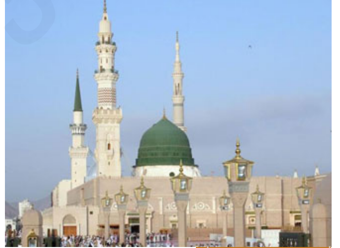
أمر رسول الله مقدم على كل أمر

فالصلاة بالنعليين مباحة ليست سنة وليست حراماً، مباحة بحكم المباح.