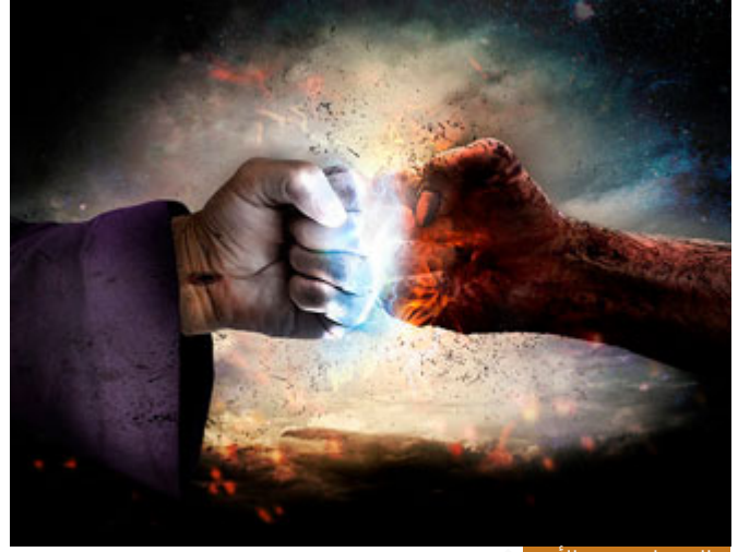
هناك مدافعة في الأرض

لم يكن عنده صلى الله عليه وسلم حبٌّ لأن يموت أصحابه ، أبداً ، هو يحب أصحابه ويحب أن ينعم الناس بالسلام لكن لن يحصل ذلك لأن هناك مدافعة في الأرض لن يحصل ذلك إلا عندما تكون قوياً هذا هو الجهاد ، لن يعطيك الناس حقك طواعيةً ، ترون اليوم وتسمعون وتشاهدون لا يُقلق أعداءنا شيءٌ في أرض فلسطين الحبيبة إلا شخص يواجههم ، أما شخصٌ يخاطب بهم فليخاطب بما شاء ، هذه سنة الحياة ، سنة الحياة أنك إن لم تكن قوياً فالطرف الآخر سيصبح قوياً ويقضي عليك ، فإما أن تجاهد أنت أو أن يجاهد هو.