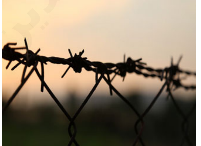
الجهاد الأكبر جهاد النفس والهوى

أول نوع من أنواع الجهاد: جهاد النفس والهوى: أن تجاهد نفسك ، ورد عن بعض الصحابة والتابعين قالوا: رجعنا من الجهاد الأصغر أي جهاد الأعداء إلى الجهاد الأكبر جهاد النفس والهوى. فالهزوم أمام نفسه لا يستطيع أن يواجه نملةً ، يعني عبارة أخرى كما تعلمنا من شيخنا؛ الجهاد: جهاد النفس والهوى هو التعليم الأساسي ، قبله لا شيء ولن يكون بعده إلا بناءً عليه ، فأول جهادٍ أن تجاهد نفسك وهواك ، قال تعالى: