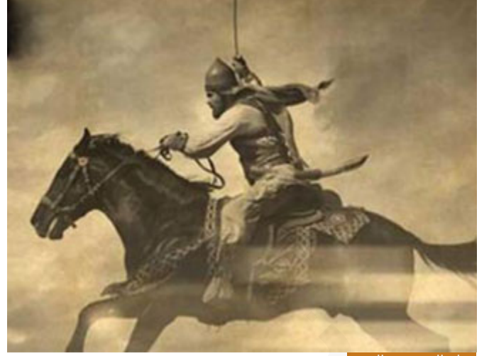
خطة النصر في الغزوة

أيها الكرام: إذا نعى النبي صلى الله عليه وسلم أصحابه زيد وجعفر وعبد الله ابن رواحة وعيناه نذرفان ثم قال: ثم أخذ الراية سيف من سيوف الله هو خالد بن الوليد رضي الله عنه فتح الله عليه فاستطاع خالد رضي الله عنه وأرضاه أن يوهم الروم بأن هناك مدداً قادمًا فغير الميمنة إلى الميسرة والميسرة إلى الميمنة وأمر البعض أن يأتوا من بعيد ويثيروا الغبار فلقى الله الرعب في قلوب الروم وأحدث فيهم مقتلًا عظيمًا ثم التف وعاد إلى المدينة بأقل خسائر ممكنة فرحب به النبي صلى الله عليه وسلم وقال له ولأصحابه: "أنتم الكرار إن شاء الله".