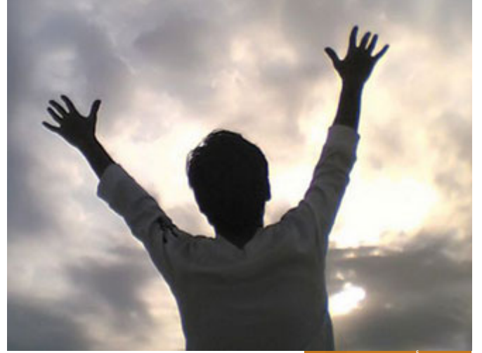
التسليم لأمر الله سبيل النجاة

إذا أكرر العبارة التي هي ملخص الملخص، إن علا في داخلك صوت موسى بتساؤلاتٍ وتساؤلاتٍ وتساؤلاتٍ عن حكمٍ وحكمٍ فابحث عن تسليم الخضر، وقُلْ كله بأمر الله، واستسلم لله، وإن سيطر عليك يوماً تسلّم الخضر سيطرةً مذمومةً بحيث أقعدك عن العمل وقال لك كلمة حقٍ أريد بها باطل لا تعمل فالأمور تجري بالمقادير، فأيقظ في داخلك تساؤلات موسى الشريفة، وقل ينبغي أن أعمل وأن أنصف المظلوم وأن أرفعى الممتلكات وأن أمنع الظلم والقتل، فأنا مكلف وقدر الله عز وجل لا يتعارض مع ما كلفني به الله تعالى من القيام بما أمر به الله تعالى، هذه قصة موسى عليه السلام مع الخضر إنها قصة فتنة العلم، والنجاة منها تكون بالتسليم لأمر الله عز وجل وبأن تعلم دائماً أن :