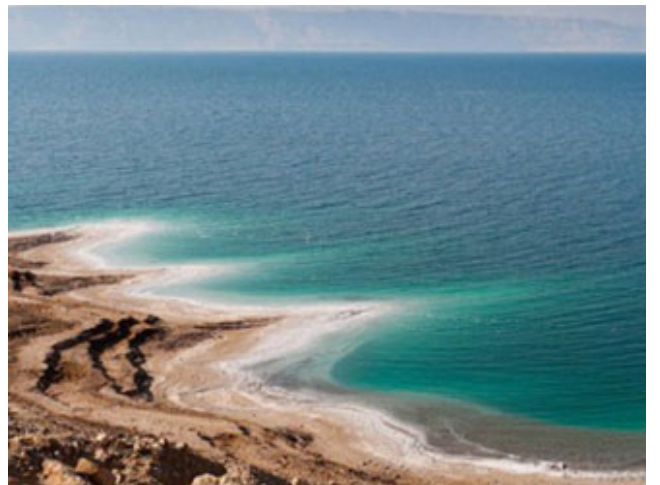
نتيجة وضع سيدنا موسى في اليم

وتنسب الغيب إلى نفسه قال: (قَارَدْتُ) ما قال: أراد ربك مع أنها إرادة الله بنفذهها، لكن ما نسب الغيب إلى الله أدباً منه، هذا أدب الأنبياء، أدب الخضر عليه السلام، قال: (قَارَدْتُ أَنْ أُعَيِّبَهَا) فعاب السفينة وخرقها، فخرق السفينة هو في حقيقته إتلافٌ للممتلكات، ولكن نتيجته نجاهٌ لمن سيركب في السفينة، هذه واحدة، تماماً كما حصل مع موسى يوم كان وضعه في اليم هو في ظاهره ليغرق لكن النتيجة كانت أنه سلم ووصل إلى قصر فرعون ورباه فرعون الذي كان يقتل الأولاد رباه في قصره وعلى عينه ليقتل بعد ذلك على ملكه، لأنه إذا أراد ربك إنفاذ أمر أخذ من كل ذي كبدٍ نيةً، فليس هناك لب وعقل مع الله، فأنت بين يدي الله عز وجل يسيرك كيف يشاء (هُوَ الَّذِي يُسَبِّحُكُمْ فِي اللَّيْلِ وَالنَّجْمِ) جل جلاله