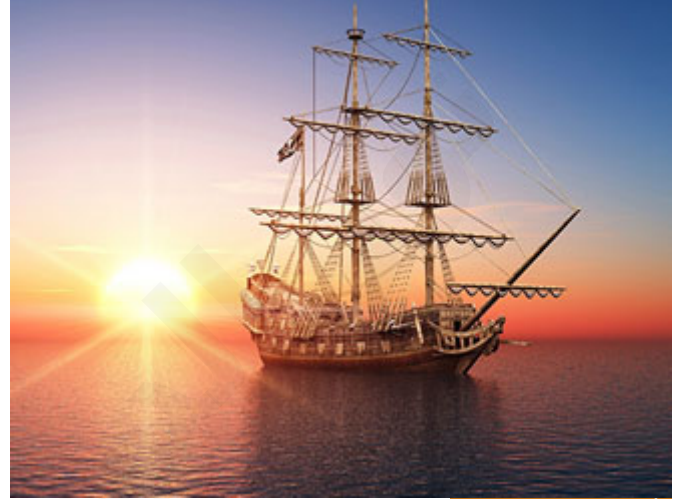
الأمر يقول لا تخرق السفينة

هذا الأمر يؤدي إلى شيء سيء جداً يركبون بها فيغرقون لأن السفينة خُرقت، موسى لا يعلم هذا الطرف من الغيب الذي عَلَّمَهُ الله للخضر، موسى لا يعلم أن هناك قدراً يجريه الله في الكون هو يعلم أن الأمر يقول: لا تخرق السفينة فقط، هذا الذي يحصل بالضبط.