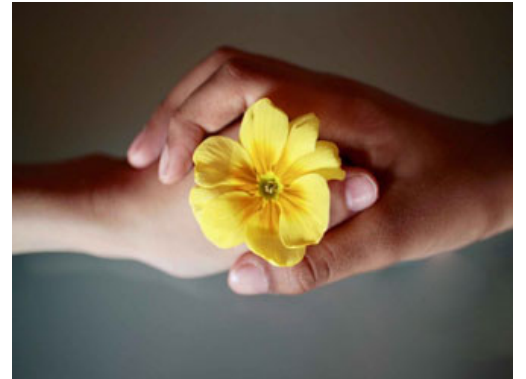
المؤاخاة نظام تكافلي

بعد ذلك أن تكون الصلات بين الموحدين في المجتمع المسلم متماسكة، هذه هي المؤاخاة، المؤاخاة نظام تكافلي، يعني حُسن علاقة بالله في المسجد، حسن علاقة مع الناس هو التآخي، والحقيقة أن المؤاخاة التي تمت في المدينة بعد هجرة رسول الله صلى الله عليه وسلم إليها ضرب بها أروع الأمثلة في المؤاخاة، فنقرأ عن المهاجرين والأنصار أشياء بكاد العقل لا يصدقها، يعني كيف استطاعت النفوس أن ترفق هذا الرقي وتستعلي على الدنيا بهذا الاستعلاء في وقت قصير، طبعاً لا شك أن وجود رسول الله صلى الله عليه وسلم بينهم، وقدسية رسول الله صلى الله عليه وسلم وبركة رسول الله كان لها أثر كبير، لكن أيضاً التوجيه الإسلامي الذي تشعّ بالنفوس مباشرة، وجعل الشخص ينطلق فيقول له هذا عندي يستأنان خذ أحدهما، عندي ففاسمني نصفاً لك ونصفاً لي، انظر أحبهما إليك، أي خذ أنت الأفضل وأنا أخذ الثاني، هذا الأمر يدل على أن المجتمع كان متكافلاً جداً، فبدأ بالتكافل، هذه نظرة الأنصاري الذي ينصر أخاه القادم من الهجرة، بالمقابل النظرة الثانية من الطرف الآخر، كان هناك موقف آخر من المهاجرين يقول له: بارك الله لك في أهلك ومالك ولكن دلتني على السوق، أنا جئت إلى هذه البلاد أريد أن أكون بذرة، أريد أن أثمر، أريد أن أفعل شيئاً، لم أتى لاكون عالة على أحد، فدائماً الموقف التكافلي من الطرفين؛ طرف يقدم والآخر يستعفف ما استطاع إلى ذلك سبيلاً، بهذه الطريقة وتلك المؤاخاة بُنى المجتمع.