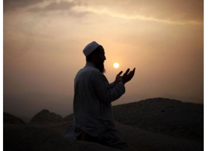
حُسن الصلّة بالله عز وجل

النبي صلى الله عليه وسلم يعلمنا بذلك أن أول ما تفعله لبناء أي مجتمع صغير أو كبير، أول شيء حُسن الصلّة بالله عز وجل، المسجد يمثل حُسن الصلّة بالله تعالى، طبعاً المسجد في صدر الإسلام لم يكن للصلاة فقط، كان يجتمع فيه المسلمون للتشاور، وتُعقد فيه الألوية، تُعلن فيه الحرب، يعلن فيه السلم، يجتمع فيه الناس، مكان مقدس لكن قدسيته لا تمنع كما يظن البعض اليوم أن قدسية المسجد تمنع أن يكون فيه شيء غير الصلاة، لا، المسجد مكان مادام ضمن المنهج فممكّن أن يكون فيه أشياء كثيرة ومهمة جداً بعد قيمة الصلاة العظيمة، لكن الهدف الرئيسي من المسجد هو حسن الصلّة بالله تعالى، فأول ما ينبغي لبناء المجتمع أن تكون صلته بالله تعالى قوية.