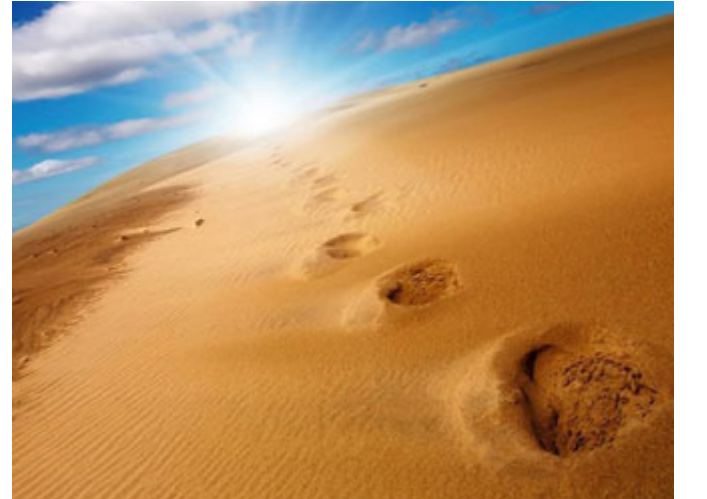
الهجرة رحلة ضمن الأسباب الأرضية

الأمر الأول: هو طريقة التعامل مع الأسباب، بحيث إن النبي صلى الله عليه وسلم كما أسلفنا قيل قليل أخذ بكل الأسباب الممكنة، ولا أبالغ إذا قلت: في عصره لم يكن هناك أي شيء لم يتخذه صلى الله عليه وسلم، فلا ممكن أن تتخيل أن نضيف سبباً جديداً ممكن أن يفعل شيئاً جديداً، بعصرنا هناك وسائل جديدة للأخذ بالأسباب، أما بعصره صلى الله عليه وسلم لا يوجد شيء آخر، حتى باللحظة الأخيرة بدل أن يتجه باتجاه المدينة مشى في عكس الطريق، ومكث في غار ثور، فلا يوجد أخذ أسباب أكثر من هذا.