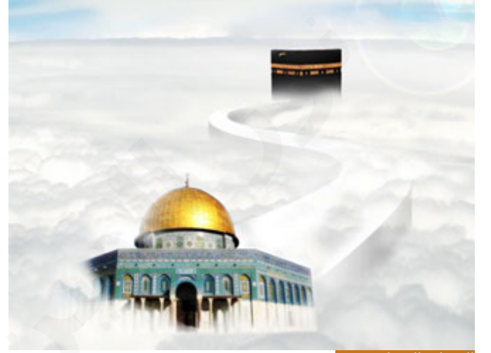
الإسراء والمعراج معجزة

ثانياً- الهجرة كانت رحلة وفق القوانين الإلهية: