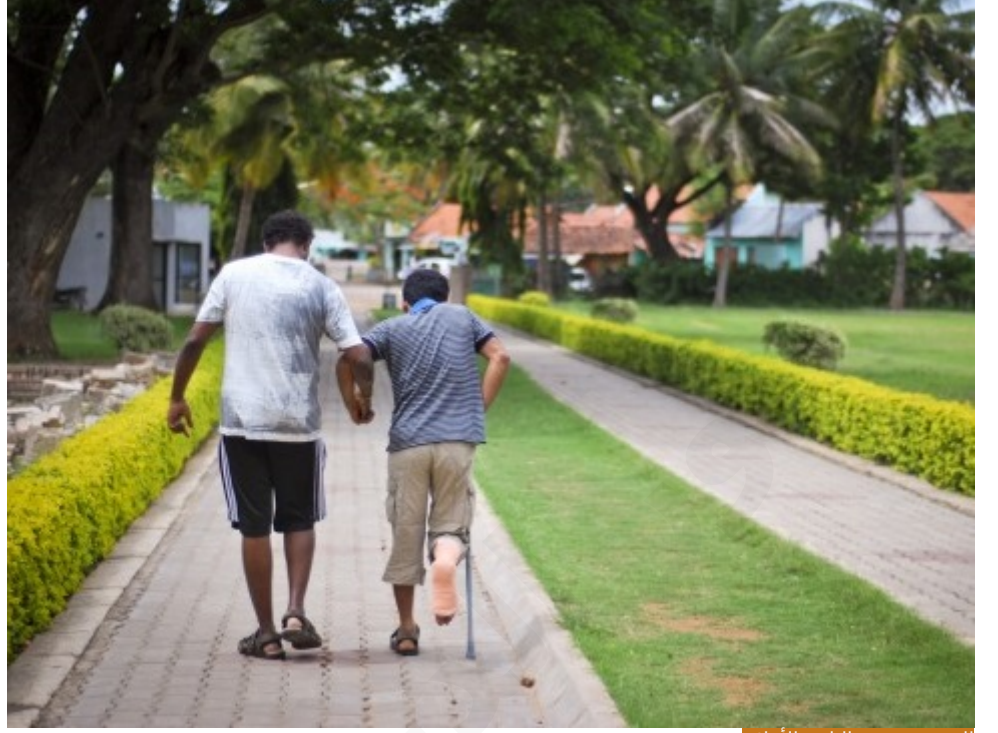
الذي ينتفع منه الناس الأخلاق

فلذلك الأصل في هذا الدين الأخلاق ، والحقيقة الذي ينتفع منه الناس من المؤمن ممن طبق منهج الله ، ممن انضوى تحت لواء الإسلام أخلاقه الطيبة ، الذي ينتفع منه الناس الأخلاق ، إذاً كما يقال : الإيمان هو الخلق فمن زاد عليك في الخلق زاد عليك في الإيمان ، هذا المنطلق الأول لاختيار حلقات هذا البرنامج ، موضوع ومضات ودرر حول أخلاق الإسلام، وهذه الأخلاق منبعها في الأصل من آيات القرآن الكريم ، ومن سيرة النبي صلى الله عليه وسلم، فهذا النبي الكريم وصف بخلق عظيم ، وفي آية أخرى كان الله عز وجل يقول له : أنت أنت يا محمد على علو قدرك ، وعلى رسالتك ، وعلى نبوتك ، وعلى كل الخصائص أنت أنت :