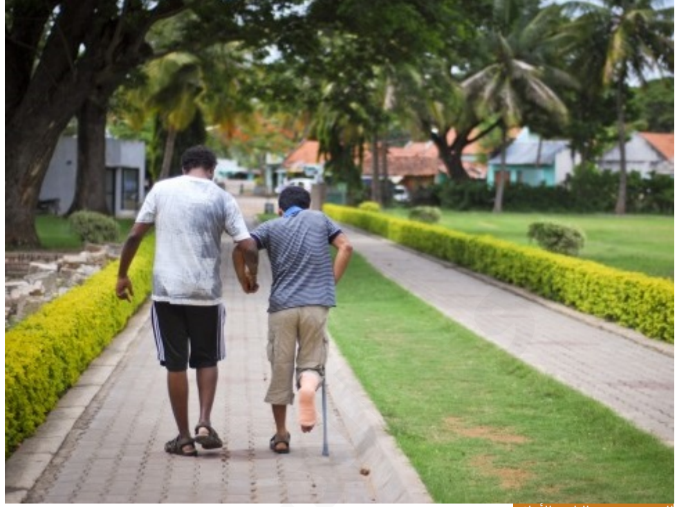
الذي ينتفع منه الناس الأخلاق

فلذلك الأصل في هذا الدين الأخلاق ، والحقيقة الذي ينتفع منه الناس من المؤمن ممن طبق منهج الله ، ممن انضوى تحت لواء الإسلام أخلاقه الطيبة ، الذي ينتفع منه الناس الأخلاق ، إذاً كما يقال : الإيمان هو الخلق فمن زاد عليك في الخلق زاد عليك في الإيمان ، هذا المنطلق الأول لاختيار حلقات هذا البرنامج ، موضوع ومضات ودرر حول أخلاق الإسلام، وهذه الأخلاق منبعها في الأصل من آيات القرآن الكريم ، ومن سيرة النبي صلى الله عليه وسلم، فهذا النبي الكريم وصف بخلق عظيم ، وفي آية أخرى كان الله عز وجل يقول له : أنت أنت يا محمد على علو قدرك ، وعلى رسالتك ، وعلى نبوتك ، وعلى كل الخصائص أنت أنت :