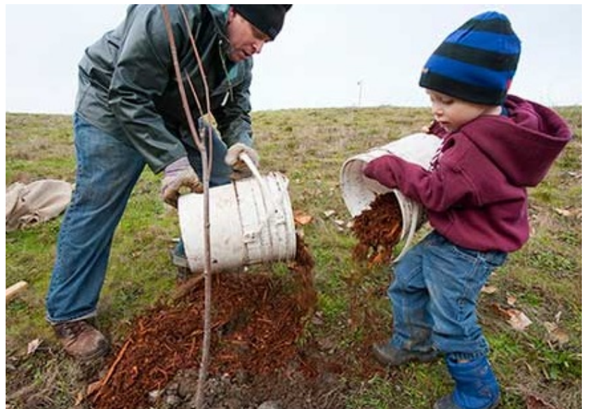
الناس يتعلمون بعبودتهم لا بأدائهم

إذا الأصل في هذا الدين الخلق ، والإنسان لا يتأثر بهذا الدين إلا بالخلق ، والناس يتعلمون بعبودتهم لا بأدائهم ، فأنا حينما أرى مسلماً يمشي في الأصل قيل : القرآن كون ناطق ، والكون قرآن صامت ، والنبي عليه الصلاة والسلام قرآن يمشي ، والعيد الفقير يقول : ما لم ير الناس في هذا العصر إسلاماً يمشي أمامهم فلن يهتدوا ، هذا المسلم إن حدثك فهو صادق ، وإن عاملك فهو أمين ، وإن استشيرت شهوته فهو عفيف ، هذه صفات المؤمن ، فلذلك الذي نتفع به، ونتفع به عامة الناس من هذا الدين الخلق ، لذلك هذا البرنامج إن شاء الله سوف يعالج نقاط دقيقة وسميها نحن درراً ، درر أخلاقية مأخوذة من كتاب الله ومن سنة نبيه عليه أفضل الصلاة والتسليم .