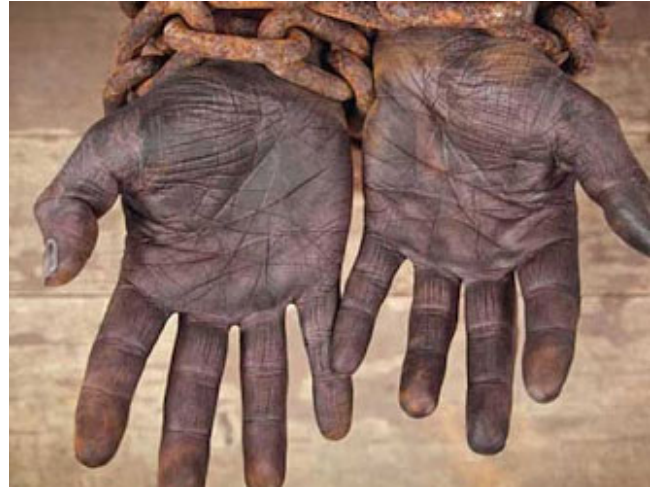
تعامل الإسلام مع العبيد

بعض الناس من المستعربين والمستشرقين يلمزون من شأن الإسلام في تعامله في موضوع العبودية، الإسلام يا أحبائنا لم يضع نظام عبودية ولا جاء بالعبودية، الإسلام جاء بالحرية، بل إن الحرية من مقاصد الشريعة الكبرى، الإسلام جاء لحرية الإنسان، لإعتاقه: