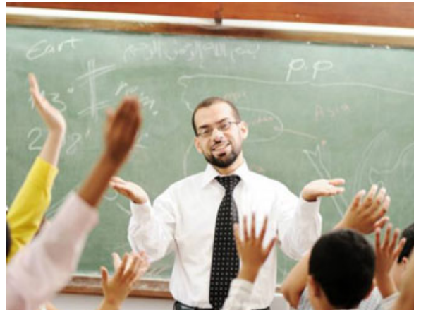
إتقان العمل من الإحسان

المعنى الشرعي من حديث جبريل عندما سأله: (أَنْ تَعْبُدَ اللَّهَ كَأَنَّكَ تَرَاهُ، فَإِنْ لَمْ تُكُنْ تَرَاهُ فَإِنَّهُ يَرَاكَ) يعني كأنهما مرتبتان، المؤمن يعبد الله كأنه يراه (أَنْ تَعْبُدَ اللَّهَ كَأَنَّكَ تَرَاهُ) يصل إلى مرحلة يراقب الله وكأنه يراه بأم عينه، مع أن الإنسان لا يرى الله في الدنيا، لكن سيراه المؤمن يوم القيامة؛ لكن يعبد الله كأنه يراه، (فإن لم تكن تراه فإنه يراك) يعني على الأقل أن تدرك أنه يراقبك، فهما مرتبتان.