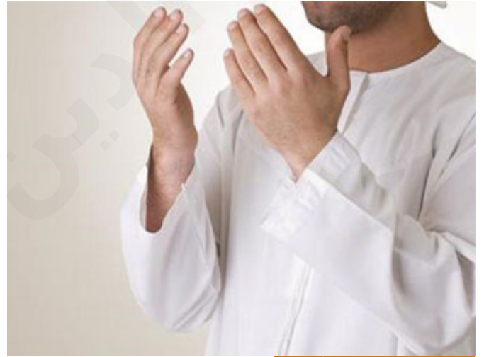
إقامة الصلاة هي صلة دائمة مع الله

إخواننا هذه الآية مهمة جداً؛ سألخصها بدقائق: (وَقَالَ اللَّهُ إِنِّي مَعَكُمْ ۚ لَئِنْ) الشرط: (أَقَمْتُمُ الصَّلَاةَ) إقامة الصلاة تعبير عن الحركة العامودية مع الخالق، يعني صلتك بالله قائمة، طبعاً إقامة الصلاة: هناك الصلوات الخمس وهناك إقامة صلاة بالدعاء، وهناك إقامة صلاة بالذكر، يعني إقامة الصلاة بالله، وهناك إقامة صلاة بالتفكير في خلق السموات والأرض، بالمعنى العام كلها صلاة ما دام لك صلة بالله، وانظروا لم يقل: وقال الله إني معكم لئن صليتم، لأن الإنسان قد يصلي ولا يقيم الصلاة، عندما لا تنهيه صلته عن الفحشاء والمنكر فهو قد صلى لكنه لم يقيم الصلاة، فإقامة الصلاة تعني أن تحقق الصلاة مقصدها الشرعي ومقصد الصلاة الشرعي أن تنهى عن الفحشاء في القول وعن المنكر في الفعل، فالمصلي لا يخرج منه فحش في الكلام ولا منكر في الأفعال.