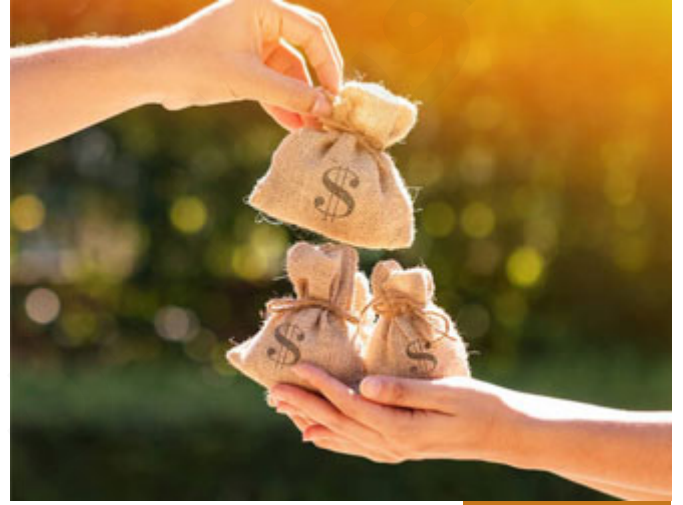
تشجيع الناس على الإنفاق

كيف جَعَلَهُمُ اللَّهُ تَحْتَ أَيْدِيكُمْ؟ مرّةً أقاموا حفل تبرع خيري، فهناك شخص تبرع بمبلغ كبير، فأقاموا له حفلاً جزاء ما فعل، وهذا شيء مطلوب شرعاً أن تقول للمحسن: يا محسن، حتى تشجع الناس، لكن هذا الرجل مدحوه زيادة، فقام أحد الخطباء قال: أنا سأتكلم بكلمتين، يا أبا فلان، كان من الممكن أن تكون واحداً ممن يقف على الدور على باب جمعيتنا ليأخذ قسيمة طعام ولكن الله تعالى أرادك أن تكون في موطن الإحسان فاحمد الله على هذه النعمة والسلام عليكم، فقط، لأن الله جعلك معطياً، قال: (جَعَلَهُمُ اللَّهُ تَحْتَ أَيْدِيكُمْ) وكان من الممكن أن يجعلك الله تحت يده، فالله هو الخافض وهو الرافع جلّ جلاله وهو المعطي وهو المانع، فشاء الله عزّ وجلّ أن يكون تحت يدك وقد يكون عند الله خيراً مني ومنك، الله أعلم، قال: (وَلَا تَكْلَفُوهُمْ مَا يَغْلِبُهُمْ) لا تكلفه شيئاً فوق طاقته، (فَإِنْ تَكْلَفُوهُمْ فَأَعْيَنُوهُمْ) قم وساعده، إذا كان لا يستطيعه وحده.