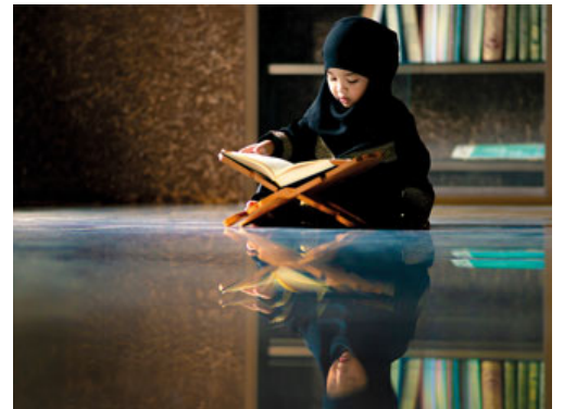
الإحسان إلى البنات في الإسلام

السيدة عَائِشَةُ قَالَتْ: (فَلَمْ تَجِدْ عِنْدِي شَيْئًا غَيْرَ تَمْرَةٍ وَاجِدَةٍ) إخواننا الكرام؛ هذا بيت سيد الخلق وحبيب الحق، السيدة عائشة عندها تمرة واحدة لا يوجد غيرها.