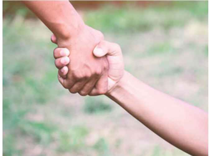
نصرة الضعيف مطلوبة

(تَقُمُّ الْمَسْجِدَ) يعني تجمع قمامة المسجد، فالصاحبة؛ هل يوقظون رسول الله من أجل الصلاة عليها؟ اجتهدوا ألا يوقظوه، فلما استيقظ سأل عنها فقالوا: ماتت، قال: (ألا آذَنْتُمُونِي) لما لم تُعلموني؟! فقام على قبرها فوقف فصلى عليها، طبعاً لا صلاة بعد الدفن، هذا استثناء من الحكم العام، لكن النبي صلى الله عليه وسلم يريد أن يعلم الأمة أن نصرة الضعيف مطلوبة، وأن نصرة الضعيف لا ينبغي أن يتجاوز الإنسان في شيءٍ منها، فحتى صلاته عليها صلى الله عليه وسلم أدركها (قال: إِنَّ هَذِهِ الْقُبُورَ مَمْلُوءَةٌ طَلْمَةً عَلَى أَهْلِهَا، وَإِنَّ اللَّهَ عَزَّ وَجَلَّ يُنَوِّرُهَا لَهُمْ بِصَلَاتِي عَلَيْهِمْ) فوقف فصلى عليها لكي لا يحرمها أجر صلاة رسول الله صلى الله عليه وسلم، هذه نصرة للضعفاء.