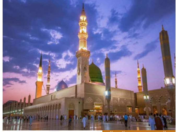
رفع الصوت فوق صوت النبي اليوم

اليوم هل هناك من يرفع صوته فوق صوت النبي؟ موجود ولكن بطريقة أخرى، اليوم يرفع صوته فوق صوت النبي؛ تقول له: قال رسول الله صلى الله عليه وسلم، يقول لك: انتظر قليلاً، هذا الحديث والله ليس وقته الآن نحن زماننا صعب، تقصد أن النبي صلى الله عليه وسلم لم يكن يعلم أنه سيأتي هذا الزمان الصعب؟! هو يوحى إليه وما أعلمه الله بالزمن الصعب وجاء بشريعة لا تناسبك ولا تناسب زمانك، يا أخي قل: أنا استغفر الله، عصيت الله، لكن لا تقل: هذا لا يناسب هذا الزمان، إن عصيت واستغفرت تاب الله عليك، لكن إن قلت: هذا الحديث ليس لهذا الزمان فقد وقعت والعباد بالله في إنكار سنّة صحيحٍ عن رسول الله، فينبغي الانتباه إلى ذلك، فهذا يرفع صوته فوق صوت النبي ولا يعزر النبي صلى الله عليه وسلم.