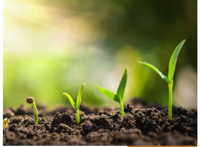
خيرات كثيرة في حديث الإفك

الذي حصل ليس شرًّا، حديث الإفك ليس شرًّا؟ نعم ليس شرًّا، هو في ظاهره شر (بَلْ هُوَ خَيْرٌ) لو ذهبت تتلمس مكان الخير في هذا الحديث لعددت عشرات الحكيم وغابت عنك عشرات، يعني من حكم حديث الإفك مثلاً: لو لم يكن له إلا أن ارتفع اسم عائشة وعلم الناس بمكانتها من رسول الله صلى الله عليه وسلم حيث أنزل في شأنها قرآن يتلى إلى يوم القيامة لكفى، لو لم يكن من ذلك إلا إظهار المنافقين في المدينة الذين كانوا يستترون بين الناس فظهر أمرهم لكفى، لو لم يكن من خير لهذا الحديث إلا أن أعلم الله الناس إلى يوم القيامة بأن هذا القرآن وحى من الله تعالى وليس كلام رسول الله صلى الله عليه وسلم لكفى، لأنه لو كان من كلامه لبرأها بعد ساعة لكنه بقي شهيراً كاملاً أو أكثر وهو يتألم أشد الألم من حديث الناس في عرض زوجته ولا يملك ما يقوله لهم إلى أن جاء الوحي، خيرات كثيرة في حديث الإفك لذلك قال تعالى: (لَا تَحْسَبُوهُ شَرًّا لَّكُم ۚ بَلْ هُوَ خَيْرٌ) موطن الشاهد (وَالَّذِي تَوَلَّى كِبْرَهُ مِنْهُمْ لَهُ عَذَابٌ عَظِيمٌ) هل لأن حديث الإفك كان في محصلته خير للمسلمين سينجو الفاعل من العقوبة؟ لا، الفاعل أراد شرًّا والله أراد خيراً فوظف شره للخير لكنه محاسب على شره وفعلته أمام الله تعالى.