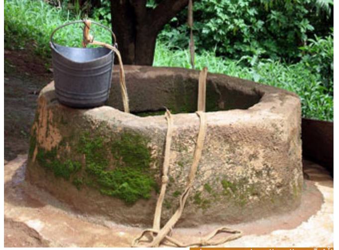
الجُبُّ هو البئر الذي ليس فيه حجارة