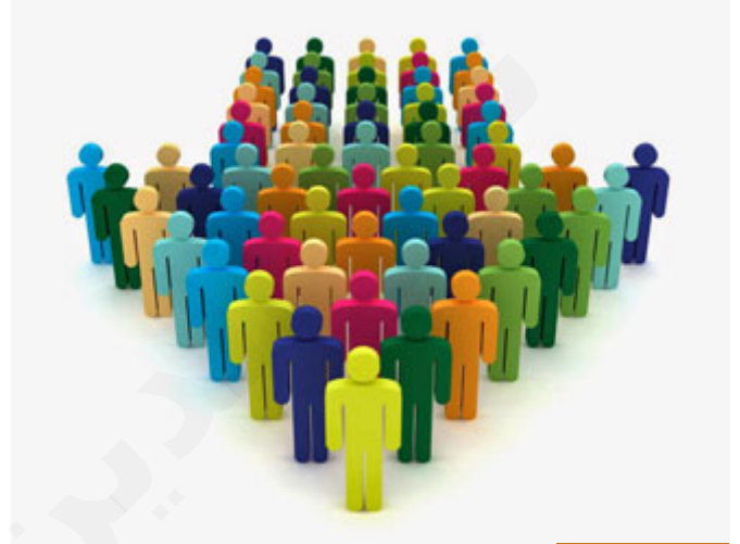
العصبة هي الجماعة

(لْيُوسُفُ) هذه اللام هي لام القسم، تشير إلى وجود قسم محذوف، هم قالوا: والله، أكدوا أشدَّ التأكيد، نقسم والله (لْيُوسُفُ وَأَخُوهُ أَحَبُّ إِلَيْنَا مِنَّا وَتَحَنُّنُ غَضَبُهُ)، (لْيُوسُفُ وَأَخُوهُ) من أخو يوسف؟ قيل: هو بنيامين أو بنيامين، والأصح بنيامين بكسر الباء، هذا الاسم ورد في التفاسير، ربنا عزَّ وجلَّ لم يطلعنا إلا على اسم يوسف، وفي التفاسير ذكروا أسماء إخوته ولعلها مأخوذة من كتب العهد القديم لكن ما يعيننا لماذا ذكر أخاه؟ أولاً: هذا الأخ مقارب له في العمر، وقيل: يوسف أكبر منه بقليل، وثانياً: أمهما واحدة، فهو أخوه من أمه أما الباقي فهم من أمهات أخريات، فهم إخوة من أب، أما هذا فهو أخ شقيق لأنه أخ من الأم والأب، فلذلك (قَالُوا لْيُوسُفُ وَأَخُوهُ أَحَبُّ إِلَيْنَا مِنَّا)، (أَحَبُّ) اسم تفضيل، أي أبونا يحبهما حباً أكثر مما يحبنا، (وَتَحَنُّنُ غَضَبُهُ) والعصبة هي الجماعة، ومنها العصابة، والجماعة من عشرة فما فوق، وهؤلاء عشرة إخوة، فهم عصبة، وهم عصبة لأنه يعصب بهم أي يشدُّ بهم، لماذا سميت العصابة التي تشدُّ على الرأس أو على اليد عصابة؟ يعصب بها الإنسان جرحه أو يده، فالعصبة يعصب بعضهم بعضاً ويشد بعضهم بعضاً فسموا عصبة، وليست العصبة عصبة خير أو عصبة شر على وجه التحديد، وإنما تطلق العصبة أو العصابة على المجموعة سواءً كانت مجتمعة على خير أو على شر، وفي الحديث يوم بدر: