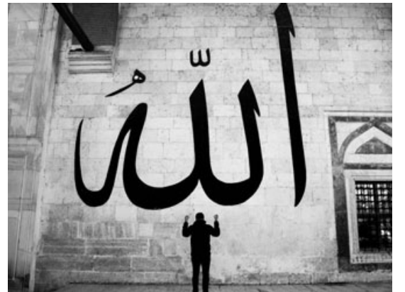
الإرادة الإلهية تتحكم بكل شيء

فكلما وجد تعلقاً بشيء ما في قلب النبي يفرغه منه، فالله تعالى أراد أشياء من هذه الحادثة وسارت الأمور وفق المشيئة الإلهية والإرادة الإلهية تماماً، وهؤلاء الذين تحركوا في القصة: من تحركوا في الخير أخذوا الخير ومن تحركوا في الشر أخذوا شر أعمالهم، وحرك الله القصة؛ ويد الله تعمل وحدها في الخفاء ولكن الناس لا يعلمون، هذا الذي ينبغي أن نفهمه في كل حدث يحدث في الكون، كل إنسان يريد الخير يأخذ الخير ومن يريد الشر يأخذ الشر، لكن إرادة الله تتحكم في الخيرين وفي الشريرين لتوظف كل أفعالهم لتحقيق مشيئة الله التي لها حكم كثيرة، قد نعلم بعضها ونجهل كثيراً منها.