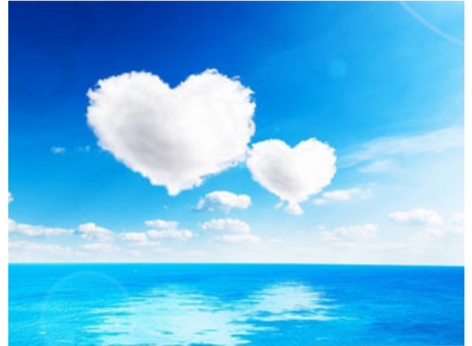
براءة يعقوب تمنعه من الشك

الشيطان اتخذ معه أساليب وأدم لم يعهد ولم يسمع كذباً فاستجاب له، الآن يعقوب نبي؛ قلب طيب أبيض لا يضمم الشر لأحد، لا يحمل الحقد على أحد، ثم هو أب والأب لا يتصور أن يصل الحقد بأبنائه إلى أن يقتل بعضهم بعضاً أو يبسيء بعضهم إلى بعض، لكن كلامهم فيه ريبة، لكن براءة يعقوب عليه السلام وطهر قلبه وأبوته التي تمنعه من الشك في أولاده جعله يستجيب لطلبهم (قالوا يا أبانا ما لك لا تأمنا على يوسف وإنا له لناصحون).