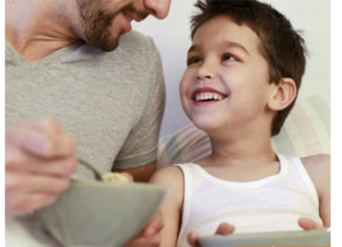
الميل للصغير أمر فطري

لكن أحياناً العدل لا يقتضي المساواة، لديك ابن في الجامعة في السنة الثالثة في الطب ولديك ابن في الصف الأول الابتدائي، فقلت: والله من المساواة والعدل أن أعطي الجميع المبلغ نفسه، فقال طالب الطب: يا أبت عندي اليوم امتحان عملي أحتاج إلى مئة دينار من أجل شراء المستلزمات، خذ مئة، فذهبت إلى الصغير في الصف الأول وأعطيته مئة حتى تعدل! هذا ليس عدلاً، هذه مساواة، العدل أن تعطي كل شخص ما يحتاجه، الآن الكبير بحاجة مال، الصغير بحاجة مصروف بسيط ليشتري به حلوى من المدرسة، هذا العدل، فالعدل ليس مساواةً دائماً، العدل أن تعطي كل شخص ما يحتاجه، حتى لا نخلط بين العدل والمساواة.