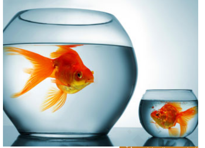
العدل شيء والمساواة شيء آخر

الأمر الثاني: يوسف عليه السلام عندما كان متعلّقاً بانه يوسف وأخيه هل كان هذا التعلّق لا يرضي الله تعالى؟ هنا تأتي قضية: يعقوب عليه السلام نبي معصوم ، لكن هناك فرق بين العدل والمساواة، المساواة تعني أن أعطي كل إنسان مثلما أعطي الآخر، فإذا كان عندي ثلاثة أبناء فأعطي كل ابن مئة دينار، فإن أعطيت واحداً مئة وخمسين والثاني مئة والثالث خمسين فما ساوت بينهم، هل يمكن أن أكون قد عدلت بينهم؟ العدل شيء والمساواة شيء آخر، العدل يقتضي أن تعطي كل شخص ما هو حاجته، والعدل فوق المساواة، نعم قد نحتاج المساواة في كثير من الأمور حتى في القَبَل، إذا كان عندي ولدان قَبِلت الأول فمن المساواة ومن العدل أن أقبل الثاني، قَبِلت الأول وضممته حتى شعر بأنني أحبه والثاني قَبِلته عن بعد، هذا ليس عدلاً وليس مساواةً، الأول عمره تسع سنوات والثاني عمره عشر سنوات هذا بحاجة إلى الحب والحنان مثل الثاني تماماً، فإن قَبِلت الأول قَبِلت الثاني، وإن قَبِلت الأول مع ضم قَبِل الثاني مع الضم، الولد يشعر، هذا عدل ومساواة معاً.