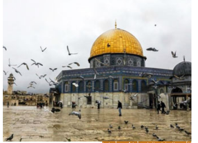
الأرض المباركة الطيبة أمانة في أعناقنا

بارك الله بكم؛ حقيقةً مكان القصة كما تفضل الدكتور بدأت في فلسطين وكانت تعود أحياناً إلى فلسطين إلى الأب المكلوم، ونحن جرحنا كبير بفلسطين الحبيبة، نحن مكلومون، نريد لقاء الأحية في هذه الأرض المباركة التي هي مسرح الأحداث، بدأت القصة منها وكانت تعود إليها ثم تعود إلى مصر، هذا ربط، وربط أيضاً كما تعلمون في الإسراء والمعراج لما أسري به إلى القبلة الأولى ثم عُرج به إلى السماء من هناك، كلُّ هذا ليقول لنا المولى جلَّ جلاله: إن هذه الأرض المباركة الطيبة أمانة في أعناقكم، فمتى كنتم متمسكين بمنهج الله تعالى مُعتزِينَ بدين الله فهي لكم، ومتى جُذمت عن المنهج خرجت من أيديكم ولن تعود إليكم إلا بعودتكم إلى بارئكم، هذا قانون يرسمه الله تعالى ويرسمه نبيه صلى الله عليه وسلم، لو نظرنا في التاريخ في كلِّ لحظات التآلق التي عاشها المسلمون كان الأقصى بين أيديهم، يوم فتحها عمر رضي الله عنه ويوم حررها صلاح الدين، كل انتكاسات الأمة كانت ترتبط ببعدها عن المسجد الأقصى وبعدها عن أرض فلسطين، وبعدها عن الأرض المباركة التي بارك الله حولها، والأردن من الأرض المباركة، فيوسف فضلاً عن أنه يُريد أن يعود إلى الموطن دائماً الحنين لأول منزل، لكن ليس هذا فقط فكلُّنا نحن لأول منزل، لكن اليوم إذا قيل لي: تكون هنا أو في مدينة رسول الله؟ أختار مدينة رسول الله لأن الحب الديني أقوى من الحب الفطري، أنا أحب وطني فطرياً لكن لما أحب فلسطين ومكة والمدينة فهذا ليس حباً فطرياً فحسب، أنا لم أولد بها ولكنها وُلدت بي، هي عاشت بي وإن لم أعش بها؛ لأنها مرتبطةً بديني وبعقيدتي، فهذا شيء يستمدُّ من المكان الذي تفضلتم به وهو فلسطين وأرض مصر.