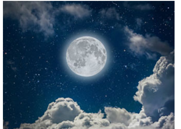
الرؤيا موضوع أساسي وجوهري في السورة

فهذه الرؤيا العجيبة أو السورة كلها تلاحظ فيها موضوع الرؤيا والخُلم أساساً وجوهرياً في موضوعات السورة، أربع مرات، وثلاث مرّات في الموضوعات العامة، الرؤيا أنواع منها ما يتعلّق بشخص الرأي، ومنها ما يتعلّق به وبالمجتمع الصغير حوله، ومنها ما يتعلّق بالأمة، فهذه الرؤيا المتعددة أربعة رؤى: رؤيا الصديق عليه السلام، رؤيا السجينين، رؤيتان، ورؤيا الملك، رؤيا الصديق تتعلّق به وبمستقبله النبوي فالنبي مُشعَّرٌ أيضاً، كذلك فهي دروس، وقصص صاحبي السجن قصصٌ خاصة ولكن لها علاقةً بالمجتمع الضيق الذي يعيشون فيه، قصة رؤيا الملك كانت تتعلّق بالإنسانية أو بالمجتمع فيلُفِتُ النظر أن الرؤيا أو الخُلم هذا جاء في نايها القصة يعني القصة قامت عليه في أكثر من محور من محاور القصة.