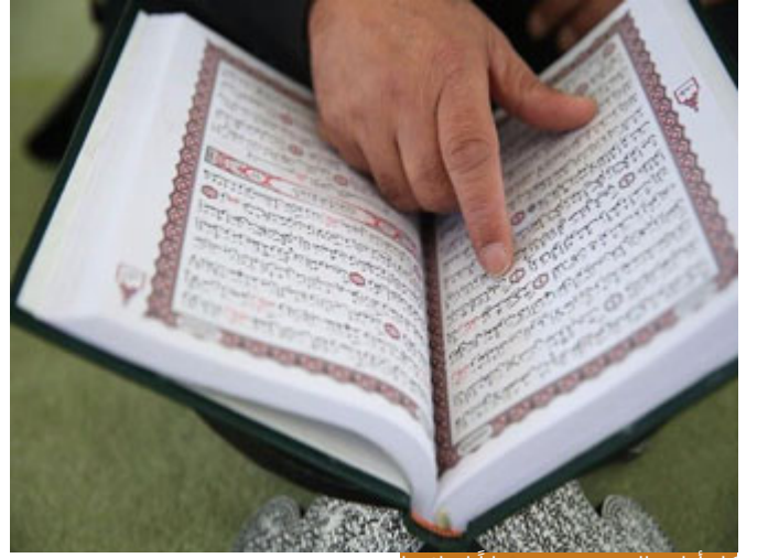
كل أوامر الدين وضعت ضماناً لسلامتنا

كيف نريد أن نفهم قيود الإيمان، كيف أفهم القيود؟ عندما أفهم عصمة الأمر، عندما أفهم القيود بشكل صحيح أفهم عصمة الأمر، أنت تمر في مكان، وجدت لوحة مكتوب عليها: ممنوع الاقتراب، توتر عال، كهرباء، خطر الموت، هل تشعر بالحد على وأضع اللوحة لأنها حدث حريك أم تشعر بالامتنان له لأن اللوحة وضعت لضمان سلامتك؟