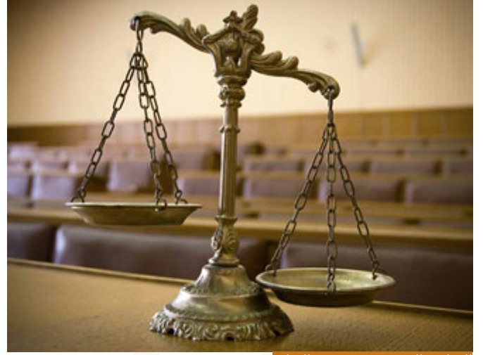
القوانين، الوضعية تتغير بتغير البيئات

كل النظريات الوضعية تحتاج إلى إصلاح، وهذا واضح، عندما تصدر القوانين تصدر قوانين معدلة، تعديلاً للقانون السابق 85، يصدر التعديل في عام 2000، أو 2010، لأن القوانين الوضعية تتغير بتغير البيئات، بتغير الظروف، بتغير الأحوال، فتتغير القوانين تبعاً للظروف والبيئة، القانون الذي يصلح في عام ألف وتسعمئة وثمانين قبل ثورة المعلوماتية لا يصلح اليوم مع وجود الكمبيوتر والهاتف المحمول، فالدين بحد ذاته كمنهج من عند الخبير، قرآن وسنة، لا يحتاج إلى إصلاح، بل إنه المنهج الوحيد الذي لا يحتاج إلى إصلاح، لأنه صالح لكل زمان ومكان، حتى الأحكام الظنية فيه جاءت ظنية، أي يمكن تأويلها على أكثر من وجه حتى تناسب جميع الأزمان إلى قيام الساعة، أي الفقه الإسلامي فقه حي، نستطيع أن نستنبط أحكاماً شرعية متعلقة بالأحداث المستجدة من خلال النصوص الشرعية، أنت اليوم تفاجأ بأبحاث بالماجستير والدكتوراه لطلاب الشريعة، مثلاً أحكام الملكية الفكرية بالإسلام، الملكية الفكرية شيء جديد، مستحدث، الماركة التجارية، لكن من خلال النصوص الشرعية المتعلقة بالغش، والتدليس، والسرقفة، نستطيع أن نستنبط أحكاماً توائم أحكام الملكية الفكرية، المستجدة الطبية، اليوم يوجد طفل أنبوب، أيضاً من خلال الأحكام الشرعية التقليدية نستطيع أن نستنبط، اليوم يوجد مجامع الفقه الإسلامي، تعطيك للمستجدات سواء للتجارة، يوجد بورصة، يوجد بنوك، ما هو ربوي وما هو غير ربوي، فالفقه الإسلامي فقه حي أي حتى الأمور المستجدة نستطيع أن نستنبط لها أحكاماً من الفقه الإسلامي من عموم النصوص الشرعية، مثلاً ربنا عز وجل قال: