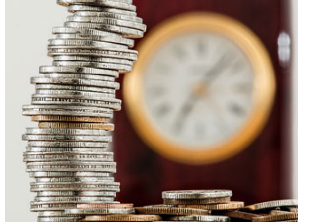
ربي النسبئة هو ربا التأخير

باختصار ربا الفضل إذا كان عندي تمر جيد وتمر رديء، لا يجوز أن تبادل التمر الجيد بالتمر الرديء، لا يصح أن أقول لك: سأعطيك كيلين من التمر الرديء، وتعطيني كيلو من التمر الجيد، أبدأ، أبيع التمر الرديء وأشتري التمر الجيد، لا يجوز مبادلة التمر بالتمر إلا بدأ بيد، سواء بسواء، كيلو بكيло، والتفاضل فوري، أعطيك وتعطيني.