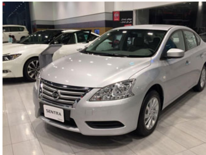
في السيارات لا يوجد شرط تقايض ولا تماثل