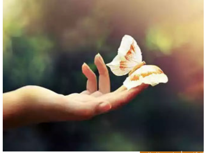
السَّكِينَةُ أَعْظَمُ عَطَاءِ إلهِي

الأولى: (نزلت عليهم السَّكِينَةُ): والسَّكِينَةُ أعظم عطاءٍ إلهي، فالإنسان يسعدُ بالسَّكِينَةِ ولو فقد كل شيء، ويشقى بفقدها ولو مَلَكَ كل شيء، قد تجد أناساً في القصور وعندهم من الدنيا ما عندهم، ونزعت منهم السَّكِينَةُ فما عادت كل الدنيا في أعينهم تُحقِّق لهم شيئاً، وقد تجد إنساناً في كهف لكن السَّكِينَةُ في قلبه فيجد من سعادتها ما لا يجده المُتَرْفُونَ في قصورهم، وجد السَّكِينَةَ رسول الله صلى الله عليه وسلم في الغار يوم قال لصاحبه: