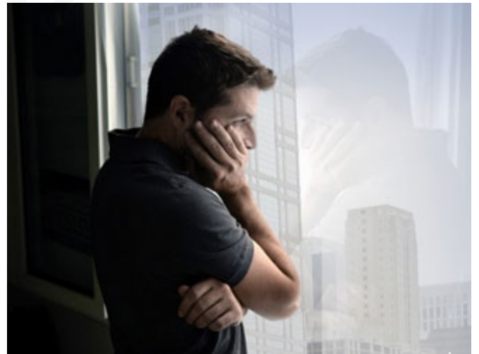
التدبُّر هو النظر في عواقب الأمور

رابعاً: تتدبَّر، ما هو الفهم والتدبُّر؟ الفهم هو التفسير، من التفسير والكشف والإبانة، فسَّر عن الشيء كَشَفَ عنه وأبَّأته، أي أن نحاول أن نفهم مُراد الله تعالى من آياته، من خلال السُّنَّة مثل الحديثين الصحيحين اللذين ذكراهما، من خلال اللغة العربية مهمة جداً، من خلال أسباب النزول أحياناً نفهم المعنى، والآن يوجد تفاسير كثيرة ودروس كثيرة نستطيع من خلالها أن نفهم المعنى.