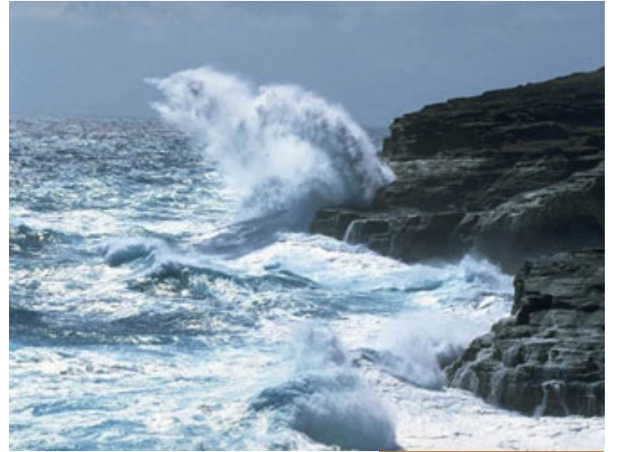
ركوب البحر عند هيجانه لا يجوز

(أخرجه البخاري وأحمد عن العارث بن عبيد الإباضي؛ مرفوعاً.)