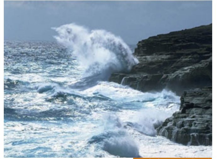
ركوب البحر عند هيجانه لا يجوز

(أخرجه البخاري وأحمد عن العارث بن عبيد الإيادي؛ مرفوعاً.)