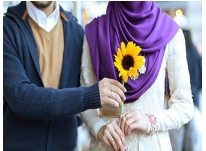
الزواج شرع لحفظ النسل

التدخين و الترجيلة و المشروبات المبالغة ببعض المشروبات، طبعاً المشروبات الكحولية هذه سنأتي عليها لأن هذه بحفظ العقل، هي بالنفس لكن العقل وضعوا له تفصيلاً وهو سنأتي عليه، فكل ما يمس بالإنسان و يضر جسده، إذا الطيب قال لإنسان: هذا الأمر لا يجوز، أنت بالنسبة لك هذا الطعام لا يجوز، أنت مريض سكري يجب أن تخفف سكريات؛ ينبغي أن يعمل بتعليمات الطيب أنا هنا لست أبالغ بالموضوع، لكن أنا أضع الوصفة الكاملة أعلم أننا مختلفون في مدى التطبيق و أنا معكم، لكن يجب أن نتكلم دائماً بالعموميات بين الحين و الآخر، فكل ما يضر بالنفس أو يلحق الضرر بالآخرين ينبغي للإنسان أن يكف عنه لأنه من الخيائث قال تعالى: (وَجِلُّ لَهُمُ الطَّيِّبَاتِ وَيُحَرِّمُ عَلَيْهِمُ اللَّحَائِثَ) فكل ما ثبت خيئته على الجسم أو على النفس فينبغي تركه أو العمل بتوجيهات الطيب أو المختص الذي يعلم ضرر هذه الأشياء على أناس دون أناس أو كذا.