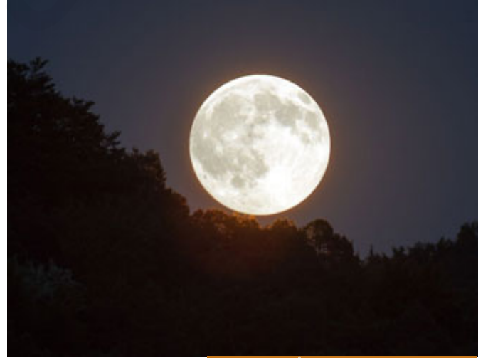
ليلة النصف من شعبان لها فضلٌ عظيمٌ عند الله