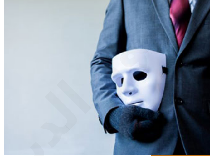
الرياء هو الشرك الخفي

فحتى الشرك الخفي ينبغي للإنسان أن يرفع قلبه، ويحفظ قلبه من أن يقع فيه، وهو الرياء، فالرياء هو الشرك الخفي، وهو بمعنى أن يكون هناك شهوة خفية وأعمال لغير الله، كما ذكر بعض أهل العلم "شهوة خفية، وأعمال لغير الله" الأعمال لغير الله: الرياء، والشهوة الخفية: شيء في القلب، مخفي لا يراه الناس، لكن يتحكم فيه فيأسره، فيجعل كأنه يعبد مع الله تعالى، يعني يعبد شهوته: