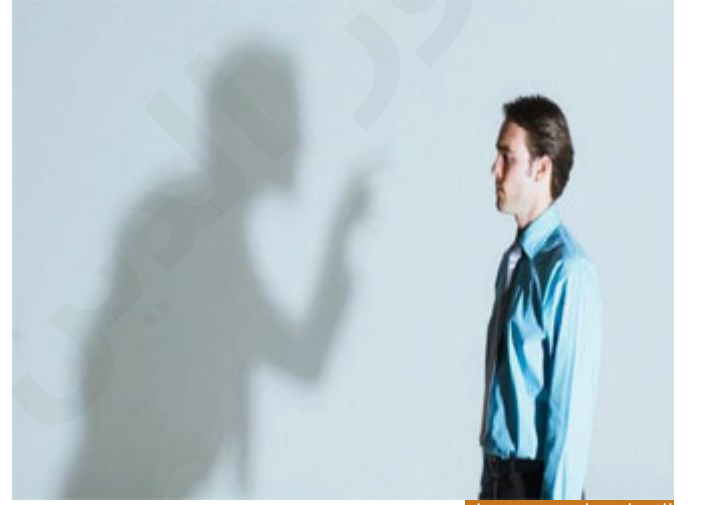
الإنسان يراقب نيته وعمله

يعني يكون في مُصَلَّاه، أو في مسجد، أو في مكان عام، فيصلي وعنده موعد مع فلان من الناس، وفي الركعة الثانية وقد استغرقت معه الركعتان دقيقتين فقط، ودخل صاحب الموعد وجلس ينتظره لنهاية صلاته، فإذا بالركعتين الثالثة والرابعة تستغرقان عشر دقائق، وهو يطيل القراءة والركوع والسجود، فهذا جعل الله أهون الناظرين إليه -والعباد بالله- وجعل نظر العبد إليه أقوى من نظر الله إليه، هذا هو الشرك، لكن هذا شرك غير مُخْرَج من المِلَّة، لكنه شرك أصغر، وهو خطير؛ لأن الله تعالى يوم القيامة يقول: اذهبوا إلى من كنتم تراؤون فخذوا منهم أجوركم، يعني أنت كنت تصلي لفلان، وليس لله، فخذُ أجرك من فلان، وأنت كنت تصوم ليقال صائم، وأنت كنت تجاهد ليقال قوي شجاع، وأنت كنت تقرأ ليقال قارئ حافظ مجاز، فإذهب إلى من كنت تُرائي فخذُ الأجر منه، فالشرك الخفي خطير جداً، لكنه ليس مخرجاً من المِلَّة، فإذا تراكم واستمر فإنه يؤدي بصاحبه إلى المهالك، لكن لا تحكم على صاحبه بكفر -والعباد بالله- ولكن نقول هو خطير جداً، فالإنسان يراقب نيته، يراقب عمله، أن يكون عمله خالصاً لوجه الله تعالى.