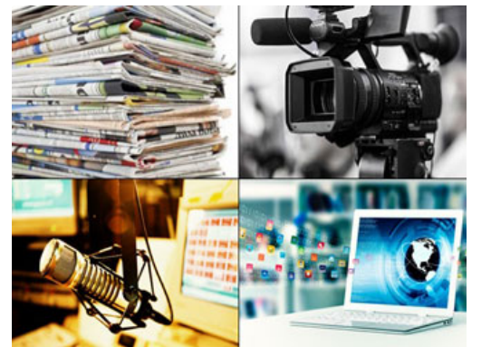
الإعلام اليوم يرفع الوضوء وينزل الكرماء

كان هناك شاعر يُسمى "الأعمشى"، الأعمشى كان من الشعراء المُختصرين، المختصر يعني عايش في الجاهلية وفي الإسلام، في الجاهلية جزءاً من عمره، ثم أدرك الإسلام، وهناك من الشعراء من عاشوا في الإسلام وأسلموا مثل حسان بن ثابت، وهناك من أدركوا الإسلام ولم يسلموا، والأعمشى واحد من هؤلاء، فكان يُسمى "صنّاعة العرب" أي المعنى الرئيسي للعرب، فهذا بالغرف الحديث "ستار العرب" فكان هذا الأعمشى الإعلامي الأول، قالوا: "ما ذمّ أحدٌ إلا وضع قدره، ولا مدح أحدٌ إلا رفع قدره"، هذا الأعمشى إذا تعلق بشخص وذمه ينزله، وإذا كان هناك إنسان وضع ومدحه يرفعه، مثل الإعلام اليوم تماماً، يرفع الوضوء، وينزل الكرماء، هذا إعلام فاسد، إعلام مُفسد في الأرض، فهذا الأعمشى كان من هذا الصنف، كان صنّاعة العرب، فهذا الرجل قبل أن يسلم مدح رسول الله -صلى الله عليه وسلم- أعجب بأخلاقه فمدحه، ومما قاله فيه يخاطب ناقته: