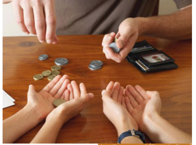
أهمية العدل بين الأولاد في تجنب الشحناء

الآن بيني وبين أولادي، طبعاً المسؤولية على الأولاد أكثر، لكن أيضاً على الأب؛ لأن أحياناً الأب ممكن أن يكون هو بسبب سوء العدل بين الأولاد أدى إلى هذه الشحناء معهم، أو ينظر في نفسه فيرى أنه كان قاس جداً في مرحلة معينة، فممكن أن يتلطف أكثر في هدايتهم، مثلاً.