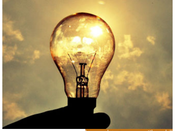
القانون علاقة بين متغيرين مقطوع بصحتها

لذلك قالوا: القانون علاقة بين متغيرين مقطوع بصحتها تطابق الواقعة عليها دليل ، علاقة بين متغيرين مقطوع بصحتها ليس في العلم اليقيني، العلم ليس نظريات ليس فيه 90% العلم 100%، يعني المعادن تتمدد بالحرارة علم، كل عنصر يتعرض لحرارة أو مصدر حراري سيتمد، يتعرض لبرودة ينكمش، فالعلم يصل إلى القانون محصلة العلم هو القانون : علاقة مقطوع بصحتها بين متغيرين تطابق الواقع؛ لأنها لو لم تطابق الواقع لكانت جهلاً، لكان الجهل أولى منها، إذا الإنسان عنده معلومات ليس لها وجود على أرض الواقع فهي جهل ليست علماً، عليها الدليل لأنه لو لا الدليل لقال من شاء ما شاء، فيمكن لإنسان أن يقول اليوم: أنا عندي معلومة علمية مهمة جداً مثلاً أو قال مثلاً: أنا أملك كل هذا البناء هو ملكي، هل عندك دليل على ذلك؟ لا؛ إذا هذا شك، تشك أو تتوهم أو تظن أو يغلب على ظنك لكنه ليس علماً، فالعلم يقين 100% لذلك قال تعالى: