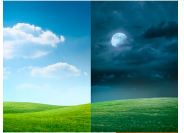
الله هو خالق الزمان والمكان

بقي أن أجيء عن النقطة الأخيرة التي تفضلت بها وهي مهمة جداً أن كثيراً من الناس يسألون: اليوم في بلدنا فردي وفي بلد آخر زوجي، وفي كندا الليل مختلف وهكذا، هنا أقول وهذا أمر مهم جداً ينبغي أن نفهمه: الله تعالى هو خالق الزمان والمكان، وهو خالق الليل والنهار، وهو خالق كندا والشرق الأوسط، فخالق الزمان والمكان وخالق كل شيء لا ينبغي أن نحاكم غيبه إلى الفوائد التي خلقها فهذا من قصور عندنا، أن نحاكم الغيب إلى قواعد العقل الذي خلقه الله تعالى.