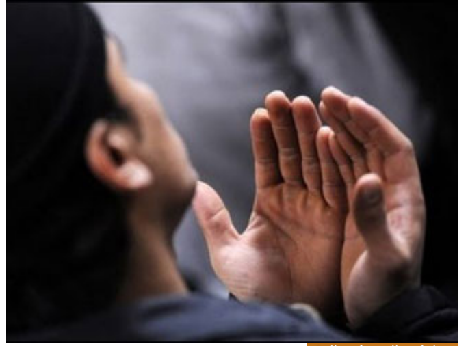
مههما تكرر الذنب كرر التوبة

ما هذه؟ أن يعصي الإنسان فلا يتوب، يقول لك: أنا ميؤوس من حالي، لا، مهما تكرر الذنب كرر التوبة، والأعمال لا تمحي عند الله، نجحت في رمضان، بعد رمضان في يوم من الأيام رسبت في امتحان معين في علاقتك مع الله، هذا لا يلغي نجاحك في رمضان ولا يلغي أن تبدأ توبة جديدة، نحن في الدنيا نفعل ذلك، لو أن الإنسان يستسلم للفشل لما بنى مشروع في العالم، فلماذا مع الله لا نبقى على هذه الحال؟ والنيبي صلى الله عليه وسلم يبين أن الإنسان ضعيف: