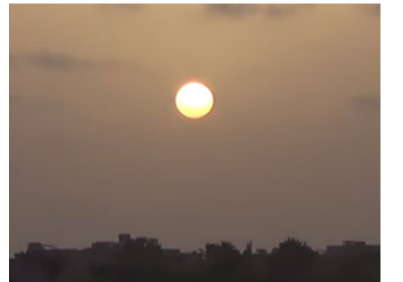
علامات ليلة القدر

الآن هل لها صفات معينة؟ الحقيقة يتكلم الناس كثيراً لكن ما يعنينا هو ما ورد في الصحيح وهي علامة واحدة في الصباح وعلامة في الليل، العلامة في الصباح من أجل الاستبشار: ينظر الإنسان في الصباح فيرى الشمس لا شعاع لها فيتفاعل لعل الله يقلل منه هذا العمل في الليل وقد شعر بالأنس والسكينة بالله.