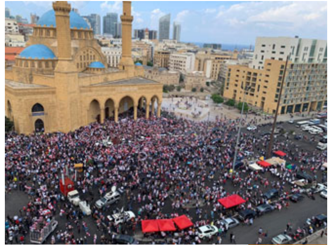
قدرة البشر محدودة

سألتهم: بالله عليكم لما سمع الصحابة هذا الحديث، هل سألوا كيف ينزل ربنا؟ هل سألوا كيف يكون التنزل وثلث الليل الآخر في بلد مختلف عن البلد الآخر، أم إنهم قاموا ليسألوا الله حاجاتهم؟ فالجواب: قاموا ليسألوا الله، فنحن عندما نشغل أنفسنا كيف ينزل الله عز وجل؟ طبعاً هو ليس كمثلته شيء، وينزل نزولاً ليس كنزولنا الله أعلم به، لكن نحن المطلوب منا أن نبادر إلى الدعاء وأن نبادر إلى الاستغفار وإلى طلب الحاجات لا أن نبقى في الجزئية الأولى كيف ينزل ربنا ونترك العمل، وقلت لهم: لو أن ملكاً من ملوك الأرض وأعد الناس ليلة كذا في ساحة كذا، أن يجمعهم ملك من ملوك الأرض ليلبي حاجاتهم، كم من الناس سيحضر؟ والله لو كان في المدينة مليوناً لحضروا وليس في اللحظة التي يبدأ فيها حضور الملك بل يتجمعون قبل أيام ويبتون في الساحة، هل حضور الملك مؤكداً؟ لا والله، يمكن أن يأتي ويمكن ألا يأتي، فهو مخلوق والمخلوق حادث، ممكن الوجود وليس واجب الوجود، ولو أنه أتى هل سيسمع الجميع؟ يكاد يكون مستحيلاً، ولو سمع الجميع هل يستطيع أن يلبي الجميع؟ مستحيل، فإذا كان ربنا جل جلاله قد واعدنا في ثلث الليل الآخر للدعاء، فالآن نقول للمسلم: فمِ وادع بما شئت بلغتك العامة، بلهجتك، العوام لهم كلمة: تدل على الله، ادعه بما شئت، قل له: يارب هذه حاجتي، عندما تطوف حول الكعبة في العمرة والحج، تسمع الناس كل يدعو بلغته، وربنا عز وجل يسمع للجميع، لذلك لما قال الله: