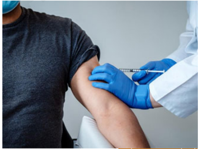
تأجيل أخذ اللقاح لبعيد العيد أفضل

بالنسبة للأدوية شخص أخذ لقاحاً، وصار معه مشاكل حرارة، وجع رأس، أعراض تشبه أعراض الرشح، هؤلاء يأخذون فقط أدوية خفيفة، مثلاً باراسيتامول، فيتامين C، ويفصل هذا الشيء أن يكون طبعاً بعد الإفطار.