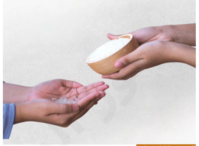
الفدية هي إطعام مسكين.

وجاء في صحيح البخاري أن هذه الآية بقيت، وإن كان نسخت في عموم الناس إلا أنها بقيت في الأصناف التي يلزمها الفدية، والأصناف الذين يلزمهم دفع فدية الصيام هي المريض كما بينا في اللقاء السابق، المريض الذي لا يرجى برؤه، المرض المزمن هذا عليه فدية، المرأة العجوز الكبيرة الطاعنة في السن التي لا تطيق الصيام، ولا تقدر عليه، أو الرجل الكبير الشيخ الذي لا يقدر على الصيام أيضاً يلزمه، وقلنا قبل قليل أيضاً عند جمهور الفقهاء: لمن أصر القضاء ودخل رمضان بغير عذر ولم يصم ما عليه، فعند جمهور الفقهاء يلزمه أيضاً مع القضاء الفدية، إذا هذه أحوال من تجب عليه الفدية.