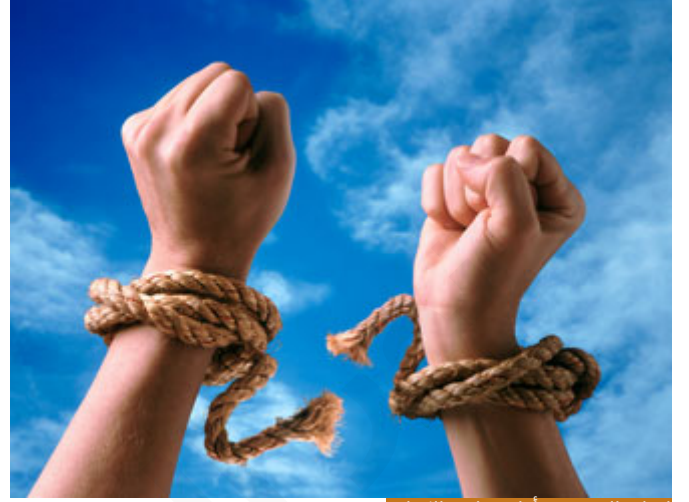
إعتاق الرقية هو أول مراتب الكفارة

لكن كما تفضلت، هذا الرجل جامع أهله في نهار رمضان، والنبي صلى الله عليه وسلم قال: أعتق رقبة، لأن إعتاق الرقية هو أول مراتب الكفارة من أفطر في نهار رمضان بالجماع - كما هو مذهب جمهور الفقهاء - أما من أفطر بالطعام والشراب فقد أتم إنتماءً عظيماً، أي بغير عذر، لكن لا يلزمه إلا القضاء والتوبة إلى الله، لكن من أفطر في نهار رمضان بالجماع فيلزمه إعتاق رقبة، فقال: أعتق رقبة؟ قال: لا أجد يا رسول الله، لا يوجد عندي لأنني فقير، فقال له: أطعم ستين مسكيناً؟ فقال: والله ما أجد، فالتبني صلى الله عليه وسلم أعطاه الطعام، جمع له وأعطاه، قال: خذ هذا وأطعمهم، قال: والله ما بين لابتيها أهل بيت أفقر منا، فضحك النبي صلى الله عليه وسلم قال: خذ وأطعمه أهلك.