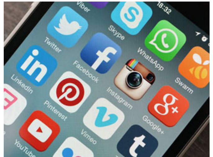
عالم وسائل التواصل سبب لانسحاب الدعاة

والله أسباب كثيرة، ولكن نلخصها: أعتقد أن سبباً كبيراً من أسباب انسحاب بعض الدعاة المصلحين، المؤثرين، الأصلاء من ساحة الدعوة هو ما وجدوه من واقع منحرف، بعيد وكانك تنفخ في قربة فارغة، أي ما وجدوا أثراً لدعوتهم في الناس بسبب الواقع المادي الذي يشد الناس إلى الدنيا أكثر مما يشدهم إلى الآخرة، فبعض الدعاة انسحبوا، يوجد مشكلة أخرى وهي مهمة جداً، اليوم عالم السوشيال ميديا، عالم اللابكات، والإعجابات، والمشاركات، يجعلك تقف ولا تضع نفسك فيه أنت أيها الداعية، بمعنى أنا اليوم أقارن نفسي فأجد أنني بعد أن قمت بهذه الحلقة الجميلة التي أعددتها ساعات طوال وكذا، فوجدت هناك ثلاثمائة مشاهدة عليها، ونظرت إلى شخص آخر لم يقدم محتوى أبداً، وإنما قدم بعض الحركات البهلوانية وعنده عشرة مليون مشاهدة، فأنا من تلييس إبليس عليّ أنه يزهدني بعلمي وأنت ماذا تفعل؟ انظر ماذا يحققون وماذا تحقق؟