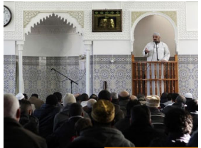
الخطاب الديني موافق لمتطلبات الناس

اليوم عندما يخطب أحد الخطباء مثلاً على المنابر، ويصيح بالناس من أول الخطبة إلى آخرها، أتمم، وأتمم، وأتمم، ويحملهم شرور الأمة كلها، ترفق بهم، هؤلاء الناس جاؤوك من كل حدب وصوب، ليستمعوا كلمتين طيبتين لطيفتين، فيجب عليك أن تحبهم بالله، تذكرهم بنعماء الله، تذكرهم بالآاء الله، تلتفتهم إلى عظيم خلق الله، فتلتطف مع الناس، الرفق، الرفق في كل شيء.