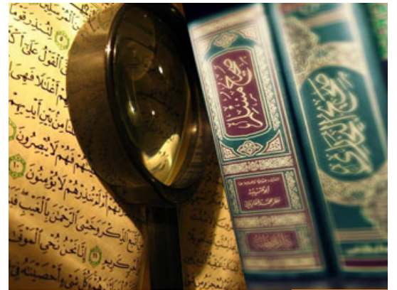
الشريعة مصلحة كلية

أبها الإخوة الأحباب؛ هناك علم اسمه (مقاصد الشريعة) يُدرّس في الجامعات؛ لاسيما في مراحل الدراسات العليا، يُعرّف هذا العلم: بأنه الحكم والغايات التي تسعى الشريعة إلى تحقيقها من خلال الأحكام الشرعية.