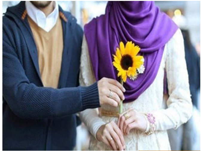
الزواج شرع لحفظ النسل

التدخين و الترجيلة و المشروبات المبالغة ببعض المشروبات، طبعاً المشروبات الكحولية هذه سنأتي عليها لأن هذه بحفظ العقل، هي بالنفس لكن العقل وضعوا له تفصيلاً وهو سنأتي عليه، فكل ما يمس بالإنسان و يضر جسده، إذا الطيب قال لإنسان: هذا الأمر لا يجوز، أنت بالنسبة لك هذا الطعام لا يجوز، أنت مريض سكري يجب أن تخفف سكريات؛ ينبغي أن يعمل بتعليمات الطبيب أنا هنا لست أبالغ بالموضوع، لكن أنا أضع الوصفة الكاملة أعلم اننا مختلفون في مدى التطبيق و أنا معكم، لكن يجب أن نتكلم دائماً بالعموميات بين الحين و الآخر، فكل ما يضر بالنفس أو يلحق الضرر بالآخرين ينبغي للإنسان أن يكف عنه لأنه من الخبائث قال تعالى: (وَيُحِلُّ لَهُمُ الطَّيِّبَاتِ وَيُحَرِّمُ عَلَيْهِمُ الْخَبِيثَاتِ) فكل ما ثبت خبثه على الجسم أو على النفس فينبغي تركه أو العمل بتوجيهات الطبيب أو المختص الذي يعلم ضرر هذه الأشياء على أناس دون أناس أو كذا.