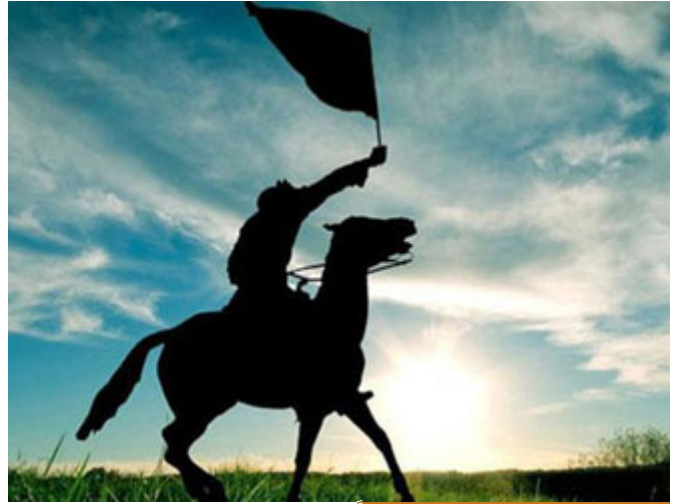
الجهاد في سبيل الله مرتبة عظيمة جداً

فأحبابنا الكرام الجهاد في سبيل الله مرتبة عظيمة جداً، هؤلاء الذين نودعهم لا نحزن عليهم، نحزن على أنفسنا، قد نحزن على الفراق، قد نحزن لضعف حالنا، قد نحزن لتقصيرنا، قد نحزن لهواننا على الناس، قد نحزن لعشرات السنوات التي مرّت ونحن نيام حتى تجرّوا علينا وتكالبوا علينا هذا التكالب، على ضعفنا، أما هم: