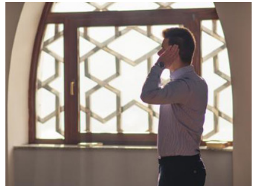
الإكثار من النوافل

كيف يصح الله تعالى سمعك وبصرك؟ أي لا تسمع شيئاً إلا في رضا الله، ولا تبصر شيئاً إلا في رضا الله، من أين جاء ذلك؟ من محبة الله لك، ومن أين جاءت تلك المحبة؟ إنها من الإكثار من النوافل.