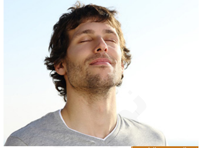
غض البصر يورث القلب نوراً

فالبصر رائدٌ للقلب، وما يدخل إلى العين يصل إلى القلب قطعاً، والإنسان العاقل لا يصحى بسعادته الأبدية وراحة قلبه من أجل لذة طارئة تزول بعد انقضائها، وغض البصر يورث القلب نوراً، لأن الله تعالى ينور قلب من غض بصره عن محارم الله، ويورث المرء صحة الفراسة، فينظر المرء بنور الله، يقول أحد العلماء: والله للذة العفة أعظم من لذة الذنب.