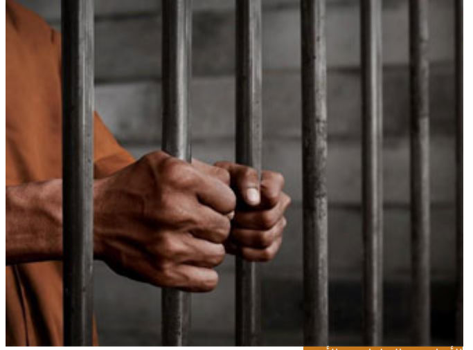
الأصل في التعامل مع الأسير

قتل الأسير حالة استثنائية، ليست أصلاً في التشريع، التشريع الإسلامي جاء بانثنين؛ بالْمَنِّ أوالْفِدَاءِ، (قَصَرَ بَ الرِّقَابِ حَتَّى إِذَا أَتَحْتَمُوهُمْ) انتهت المعركة وانتصرتهم (فَسُدُّوا الوُتَاقِ) الأسير (فِيمَا مَنَّا بَعْدُ وَإِنَّمَا فِدَاءٌ) فالإسلام شرع المن وهو الإطلاق بغير عوض، تمن عليه تقول له: اذهب لا أريد منك شيئاً، (وَإِنَّمَا فِدَاءٌ) تطلب منه مالا، أو تطلب منه أن يعلم أحداً، أو غير ذلك، (فِيمَا مَنَّا بَعْدُ وَإِنَّمَا فِدَاءٌ حَتَّى تَصَعَ الحَرْبُ أَوْزَارَهَا) فالأصل هو المن والْفِدَاءِ أما القتل فهو الحالة الاستثنائية، لكن في معركة بدر نزل قوله تعالى موافقاً لعمر: