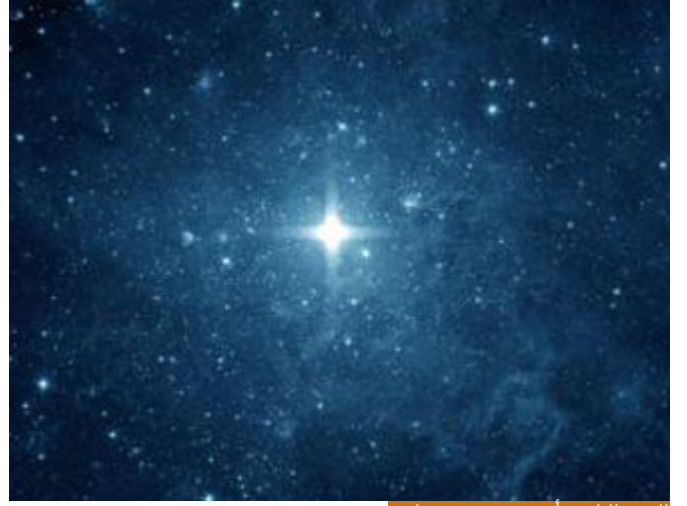
النجم الثاقب أي نجم مضيء بطرق

وهذا من الاصطلاحات القرآنية، فدائماً وما أدراك أسلوب قرآني، أي أنت لا تعلم بنفسك ولكني سأعلمك، فهذا غيب من الله، فقال: وَالسَّمَاءِ وَالطَّارِقِ * وَمَا أَدْرَاكَ مَا الطَّارِقُ ما الذي يشعرك ما هو الطارق إن لم يخبرك الله تعالى به، قال النَّجْمِ الثَّاقِبِ وقال ثقب الشيء أضاءه، النَّجْمِ الثَّاقِبِ المضيء، وطبعاً أيضاً هذه لها تفسير علمي حديث متعلق ببعض الأصوات التي هي كالطرق تماماً على الباب، ولها أهلها الذين يتحدثون بها، ولكن بالعموم هو نجم مضيء بطرق، العلماء قديماً فهموا الطارق لأنه يظهر ليلاً كما يأتي الطارق ليلاً إلى دارك، فالطارق العرب يعرفونه أنه يطرق البيت ليلاً، وهذا النجم يخفي نهاراً ويظهر ليلاً يعرف العرب الذين ينظرون إلى السماء.