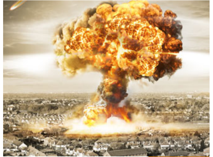
في الدنيا لا يوجد حساب

بِسْمِ اللَّهِ الرَّحْمَنِ الرَّحِيمِ كُلُّ نَفْسٍ دَائِقَةُ الْمَوْتِ وَإِنَّمَا تُوَفَّقُونَ أُجُورَكُمْ يَوْمَ الْقِيَامَةِ فَمَنْ رُزِحَ عَنِ النَّارِ وَأُدْخِلَ الْجَنَّةَ فَقَدْ فَازَ وَمَا الْحَيَاةُ الدُّنْيَا إِلَّا مَتَاعٌ الْعُرُورِ (185)