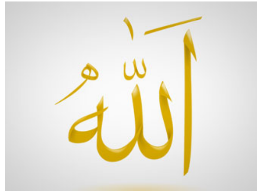
الأمر هو الحافظ

أحبابنا الكرام: هنا نقطة رائعة في فهم اليقين، أقول: هاجر هي أستاذة اليقين، مربية اليقين، أنا لم يمر معي يقين كهذا اليقين، أن امرأة ستبقى في هذا المكان وحيدة