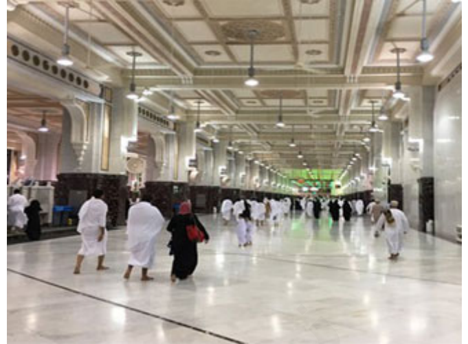
بداية السعي بين الصفا والمروة

الآن بعد ذلك؛ طبعاً القصة طويلة أنا أريد أن أعقب على مقاطع منها، تفد الماء وانتهى التمر وبدأت السيدة هاجر تسعى بين الصفا والمروة، (قال النبي صَلَّى اللهُ عَلَيْهِ وَسَلَّمَ: قَدْ لَكَ سَعْيُ النَّاسِ بَيْنَهُمَا) (أخرجه البخاري)