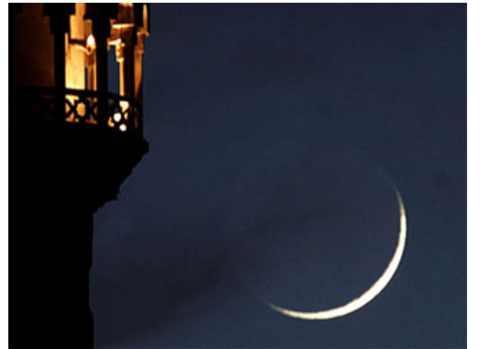
رؤيا الأنبياء وحي

الرؤيا لسانا مطالبين بتنفيذها إلا إن وافقت شرع الله، نحن لسانا متعبدين بالرؤى، لكن الأنبياء رؤاهم وحي من الله يأتيهم في المنام (إِنِّي أَرَىٰ فِي الْمَنَامِ أَنِّي أَذْبَحُكَ) هو عندما قال له: (إِنَّ اللَّهَ أَمَرَنِي بِأَمْرٍ) قَالَ: نفذ الأمر، عند بناء البيت، هنا (إِنِّي أَرَىٰ فِي الْمَنَامِ أَنِّي أَذْبَحُكَ) ذكر له الأمر فوراً لأن الأمر عظيم، إبراهيم ليس متردداً في التنفيذ لكن الموضوع كيف أفتح ابني به (قَالَ يَا أَبَتِ افْعَلْ مَا تُؤْمُرُ) بلا تردد، ولا لحظة، ولا لماذا؟ ولا كيف؟ أريد أن أوجه رسالة إلى مسلم اليوم الذي تقول له: