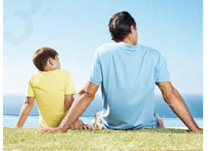
التعلق الشديد بين الأب وابنه

أحبنا الكرام: انقضت السنوات وجاء إبراهيم عليه السلام ليزور ابنه، (وَإِسْمَاعِيلُ يُبْرِي تَبْلًا لَهُ تَحْتَ دَوْحَةٍ قَرِيبًا مِنْ زَمْرَمَ، فَلَمَّا رَأَهُ قَامَ إِلَيْهِ، يَقُولُ ابْنِ عَبَّاسٍ: قَصَصْنَا كَمَا يَصْنَعُ الْوَالِدُ بِالْوَلَدِ وَالْوَالِدُ بِالْوَالِدِ) عناق مع قبلات مع اشتياق، إبراهيم عليه السلام يوم ترك ابنه يواد غير ذي زرر كما قلنا، كان رضيعاً، وأشد ما يكون الإنسان تعلقاً بابنه وهو في صغره، ربنا عز وجل يخلص الأنبياء تحديداً لنفسه، هذا موسى عليه السلام: