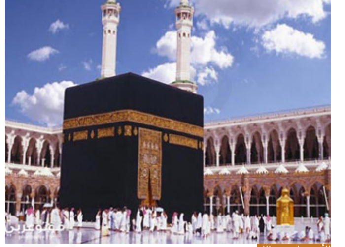
الأمر ببناء بيت الله

إبراهيم بعد ذلك جاء (وَإِسْمَاعِيلُ كَانَ بَتْرِي تَبْلًا لَهُ، فَصَتَعَا كَمَا يَصْنَعُ الْوَالِدُ بِالْوَلَدِ وَالْوَلَدُ بِالْوَالِدِ، ثُمَّ قَالَ يَا إِسْمَاعِيلُ، إِنَّ اللَّهَ أَمَرَنِي بِأَمْرٍ، قَالَ: فَاصْنَعْ مَا أَمَرَ رَبُّكَ الْآنَ لَمْ يَسْأَلْهُ بِمَاذَا أَمَرَكَ، إِسْمَاعِيلُ نَبِيٌّ ابْنُ نَبِيِّ، كَرِيمٌ ابْنُ كَرِيمٍ، لَمْ يَسْأَلْهُ بِمَاذَا أَمَرَكَ رَبُّكَ، لِنَرَى مَا الْأَمْرُ وَبَعْدَ ذَلِكَ نَقَرُّرْ هَلْ نَنْفِذُ أَمْ لَا نَنْفِذُ! بَلْ قَالَ: (فَاصْنَعْ مَا أَمَرَكَ رَبُّكَ، قَالَ: وَتُعِينُنِي؟ قَالَ: وَأَعِينُكَ) أَنَا مَعَكَ لَتَنْفِذَ أَمْرَ اللَّهِ، (قَالَ: فَإِنَّ اللَّهَ أَمَرَنِي أَنْ أُبْنِيَ هَهُنَا بَيْتًا، وَأَشَارَ إِلَى أَكْمَةِ مُرْتَفِعَةٍ عَلَى مَا حَوْلَهَا) مَكَانَ مُرْتَفِعٍ قَلِيلًا، مَكَانَ مَكَّةَ، الْبَيْتِ، (فَعَبَدَ ذَلِكَ رَقَعًا الْقَوَاعِدَ مِنَ الْبَيْتِ، فَجَعَلَ إِسْمَاعِيلُ بَأْتِي بِالْحِجَارَةِ وَإِبْرَاهِيمُ بَيْتِي، حَتَّى إِذَا ارْتَفَعَ الْبِنَاءُ) (جَاءَ بِهَذَا الْحَجَرِ) يَقْصِدُ مَقَامَ إِبْرَاهِيمَ الَّذِي هُوَ أَمَامَ الْكَعْبَةِ، (فَوَضَعَهُ لَهُ قَعَامَ عَلَيْهِ) وَقَفَ عَلَيْهِ، (وَهُوَ بَيْتِي وَإِسْمَاعِيلُ بُنَاؤُهُ الْحِجَارَةَ، وَهَمَّا يَقُولَانِ: