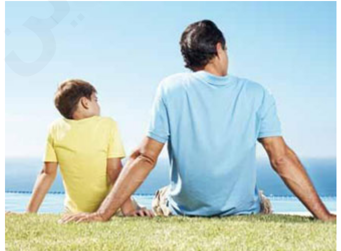
التعلق الشديد بين الأب وابنه

أحبنا الكرام: انقضت السنوات وجاء إبراهيم عليه السلام ليزور ابنه، (وَإِسْمَاعِيلُ يُبْرِي تَبْلًا لَهُ تَحْتَ دَوْحَةٍ قَرِيبًا مِنْ زَمْرَمَ، فَلَمَّا رَأَهُ قَامَ إِلَيْهِ، يَقُولُ ابْنِ عَبَّاسٍ: قَصَصْنَا كَمَا يَصْنَعُ الْوَالِدُ بِالْوَلَدِ وَالْوَالِدُ بِالْوَالِدِ) عناق مع قبلات مع اشتياق، إبراهيم عليه السلام يوم ترك ابنه يواذ غير ذي زرع كما قلنا، كان رضيعاً، وأشد ما يكون الإنسان تعلقاً بابنه وهو في صغره، ربنا عز وجل يخلص الأنبياء تحديداً لنفسه، هذا موسى عليه السلام: