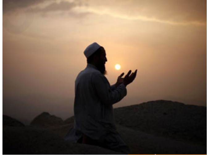
امتحان العبودية في أوامر الدين

إخواننا الكرام: أوامر الله عز وجل تسعون بالمئة أو خمسة وتسعين بالمئة وإضحة، لا تحتاج تعباً حتى تفهم الحكمة منها، ربنا عز وجل أمر بالصدق؛ هل يسأل الإنسان: ما الحكمة من هذا الأمر؟! الحكمة أن الصدق في حياتك ينفعلك، هذا واضح، أحياناً ربنا عز وجل تأتي أوامر غير مفهومة هنا يمتحن عبوديتك، امتحان العبودية لا يكون في كل أمر تفهم حكمته، قد تغيب الحكمة أحياناً في بعض الأوامر، فهنا يمتحن من يعبد الله ومن يعبد مصالحه وذاته، فلذلك أحياناً تجد في الدين آيات متشابهة، لماذا؟ هذا امتحان العبودية، تجد أمراً ربما بنظرك لا يوافق العقل، يقول الفقهاء: لو كان الدين بالعقل لكان مسح باطن الخف أولى من مسح الظاهر، لأنه تصيبه الأرض والنجاسة، لكن المسح للظاهر، فأحياناً بعض الأوامر وهي قليلة جداً لا تشكل ربما واحد بالمئة أو خمسة بالمئة من أوامر الدين يمتحن الله تعالى بها عبوديتك، لأنك تعبد الله ولا تعبد ذاتك، فنحن نعبد الله كما أمر الله جلّ جلاله، إذاً هما امتحانان: الله أكبر، ولبيك اللهم لبيك، فالذي يعظم يستجيب.