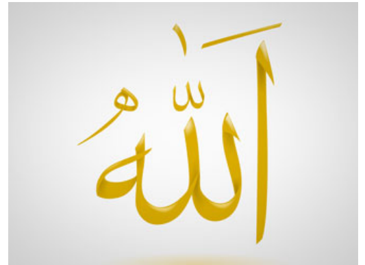
الأمر هو الحافظ

أحبابنا الكرام: هنا نقطة رائعة في فهم اليقين، أقول: هاجر هي أستاذة اليقين، مربية اليقين، أنا لم يمر معي يقين كهذا اليقين، أن امرأة ستبقى في هذا المكان وحيدة