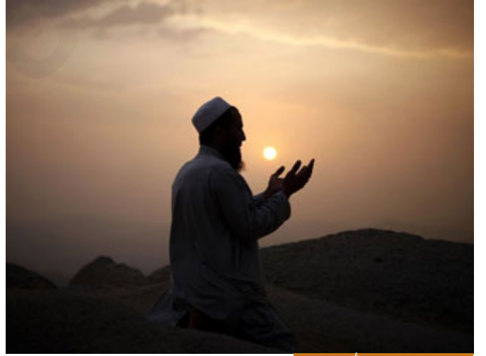
امتحان العبودية في أوامر الدين

إخواننا الكرام: أوامر الله عز وجل تسعون بالمئة أو خمسة وتسعين بالمئة وإضحة، لا تحتاج تعباً حتى تفهم الحكمة منها، ربنا عز وجل أمر بالصدق؛ هل يسأل الإنسان: ما الحكمة من هذا الأمر؟! الحكمة أن الصدق في حياتك ينفعلك، هذا واضح، أحياناً ربنا عز وجل تأتي أوامر غير مفهومة هنا يمتحن عيوديتك، امتحان العبودية لا يكون في كل أمر تفهم حكمته، قد تغيب الحكمة أحياناً في بعض الأوامر، فهنا يمتحن من يعبد الله ومن يعبد مصالحه وذاته، فلذلك أحياناً تجد في الدين آيات متشابهة، لماذا؟ هذا امتحان العبودية، تجد أمراً ربما بنظرك لا يوافق العقل، يقول الفقهاء: لو كان الدين بالعقل لكان مسح باطن الخف أولى من مسح الظاهر، لأنه تصيبه الأرض والنجاسة، لكن المسح للظاهر، فأحياناً يعرض الأوامر وهي قليلة جداً لا تشكل ربما واحد بالمئة أو خمسة بالمئة من أوامر الدين يمتحن الله تعالى بها عيوديتك، لأنك تعبد الله ولا تعبد ذاتك، فنحن نعبد الله كما أمر الله جلّ جلاله، إذاً هما امتحانان: الله أكبر، وليبيك اللهم ليبيك، فالذي يعظم يستجيب.