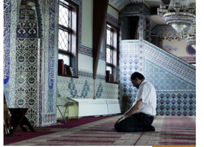
الصلاة تغذي الروح

الآن أريد أن أقف عند الآية، أحبنا الكرام: إبراهيم عليه السلام نفذ الأمر، الآن يدعو، أي أب في هذا الموقف أول ما يدعو به أن يقول: يا رب ابعث لهم طعاماً وشراباً لأن المكان لا نبت فيه ولا شيء، إبراهيم عليه السلام يقول: (رَبَّنَا لِيُقِيمُوا الصَّلَاةَ) قبل الطعام والشراب، لأنه يدرك أن الطعام والشراب يغذي الجسد، لكن الصلاة تغذي الروح، يدرك أن الطعام والشراب يغني لكن الصلاة تغني، فيبدأ بالباقيات.