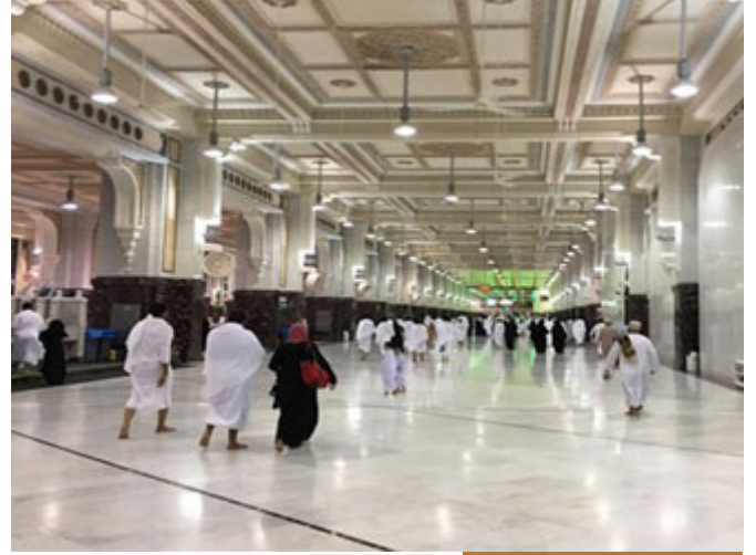
بداية السعي بين الصفا والمروة

الآن بعد ذلك؛ طبعاً القصة طويلة أنا أريد أن أعقب على مقاطع منها، تفد الماء وانتهى التمر وبدأت السيدة هاجر تسعى بين الصفا والمروة، (قال النبي صَلَّى اللهُ عَلَيْهِ وَسَلَّمَ: قَدْ لَكَ سَعْيُ النَّاسِ بَيْنَهُمَا) (أخرجه البخاري)