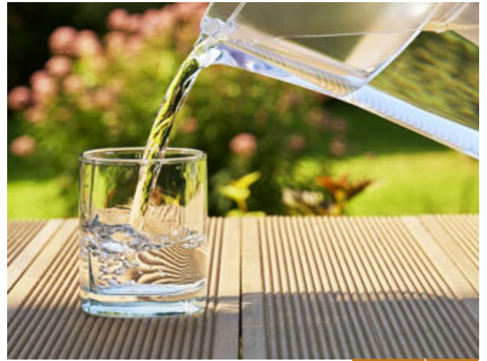
الماء هو أساس الحياة