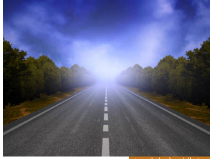
معرفة الطريق تُسهل السير فيه

تريد أن تذهب في نزهة أو في سفر عمل من مكان إلى مكان، عندك طريق هذا الطريق اليوم حسب Google تفتح فتعرف طبيعة الطريق، يقول لك: يحتاج إلى ساعتين وعشر دقائق، يعطيك أماكن حمراء على الطريق تشير إلى أنها طرق مزدحمة جداً، يعطيك محطات الوقود الموجودة على الطريق، أنت تدرس طبيعة الطريق قبل أن تسلكه، فالآن عندما تسير تسير على نور، وأنت تعرف طبيعة الطريق الذي ينتظرك.