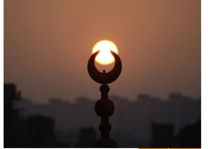
مصيبة الدين أعظم مصيبة

أن يصل الإنسان إلى مرحلة يظن بها بالله والعياذ بالله ظن السوء فهذا أعظم مصيبة له، هذا أعظم من مصيبته في الهزيمة، لذلك كان عمر رضي الله عنه إذا أصابته مصيبة قال: الحمد لله إذ لم تكن في ديني، لأن مصيبة الدين أعظم مصيبة، أن يسيء الظن بربه، إن يظن أن الله تعالى لا ينصر دينه، ولا يحق الحق، قد يؤخر الله عز وجل نصر أوليائه وأحبابه، ليتحقق لهم التمكين الذي يريده ولكي يعودوا إلى خالقهم ومولاهم، فهناك حكمة في تأخير النصر، لكن ليست أبداً أن الله عز وجل لا يريد أن ينصر أهل الحق، فحسن الظن بالله أيها الأحباب؛ أيضاً مما تعالج به الهزيمة النفسية.