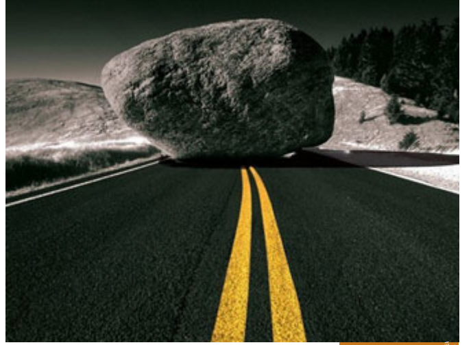
حُفَّت الجنة بالشهوات

إنك تريد أن يدخل إلى الجامعة؛ تعرّفه بطبيعة الطريق تقول له: هذا الفرع يا بني فرع الطب يحتاج إلى تفرغ كامل، يحتاج إلى دراسة مستمرة، يحتاج إلى تكاليف عالية، يحتاج منك إلى صحبة صالحة، إلى لغة أجنبية قوية، تنبر له الطريق، تعرّف له طبيعة الطريق.