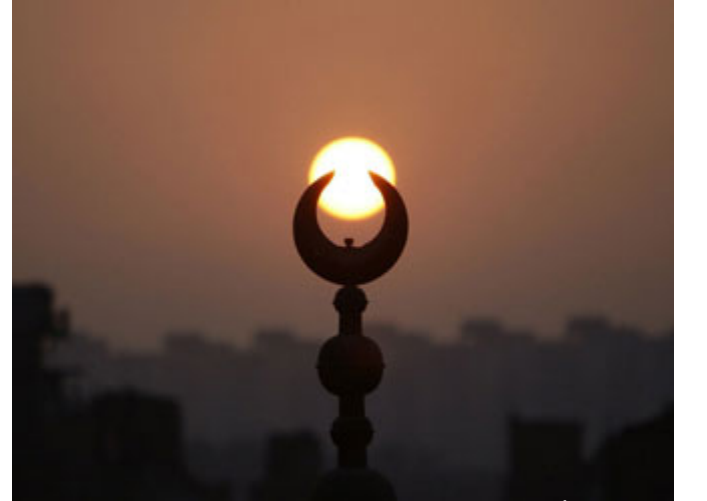
مصيبة الدين أعظم مصيبة

أن يصل الإنسان إلى مرحلة يظن بها بالله والعياذ بالله ظن السوء فهذا أعظم مصيبة له، هذا أعظم من مصيبته في الهزيمة، لذلك كان عمر رضي الله عنه إذا أصابته مصيبة قال: الحمد لله إذ لم تكن في ديني، لأن مصيبة الدين أعظم مصيبة، أن يسيء الظن بربه، إن يظن أن الله تعالى لا ينصر دينه، ولا يحق الحق، قد يؤخر الله عز وجل نصر أوليائه وأحبابه، ليتحقق لهم التمكين الذي يريده ولكي يعودوا إلى خالقهم ومولاهم، فهناك حكمة في تأخير النصر، لكن ليست أبداً أن الله عز وجل لا يريد أن ينصر أهل الحق، فحسن الظن بالله أيها الأحباب؛ أيضاً مما تعالج به الهزيمة النفسية.