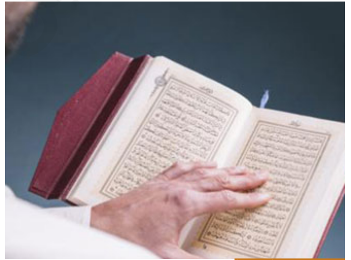
الإسلام كله عقيدةً وشرعيةً

العقيدة: هي مجموعة الإيمانيات، لخصها النبي صلى الله عليه وسلم بقوله: (أَنْ تُؤْمِنَ بِاللَّهِ وَمَلَائِكَتِهِ وَكُتُبِهِ وَرُسُلِهِ وَالْيَوْمِ الْآخِرِ، وَتُؤْمِنَ بِالْقَدْرِ حَبْرِهِ وَشَرِّهِ) هذه العقيدة، الفكر، المنطلقات النظرية.