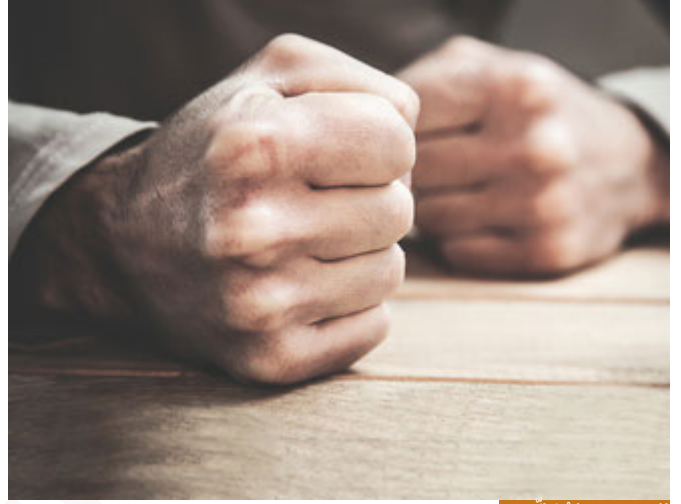
الغضب جماعٌ كلُّ شر

أحبنا الكرام: الغضب جماعٌ كلُّ شر، والجلم جماعٌ كل خير، والجلم سيد الأخلاق، وقالوا: كاد الحليم أن يكون نبياً، الجلم والذي هو نقيض الغضب يجمع الخير كله، لأن الإنسان إذا كان حليماً اتخذ القرار الصحيح في الوقت الصحيح في المكان الصحيح، أنت بالجلم سيد قرارك، أما بالغضب فانت تفقد السيطرة على نفسك، الإنسان وهو غاصبٌ يتخذ أحياناً قراراتٍ يندم عليها طيلة حياته، والله أيها الإخوة: أنا أعلم من القصة التي حُدِّثَتْ عنها أو شهدتها أن أناساً كثيرين دمروا حياتهم بلحظة غضب، إما أنه طلق زوجته الطلقة الثالثة وقال: والله كنت في لحظة غضب، ثم بحث عن فتوى فلم يجد لأنه كان في غضبٍ لا يُخرجه عن الإدراك فأفتي له بوقوع الطلاق، وأعرف عن إنسان والعياذ بالله ضرب ابنه ضربةً سببت له عاهة؛ الولد مُتَعِبٌ جداً والأب جاء بمفروشاتٍ لغرفة الضيوف، والولد صغير فدخل وخرق المفروشات بالسكين، فجاء فوجده كذلك فصره على يديه وسب له عاهةً دائمةً، وعاش حياته يتألم للحظة غضبٍ غضبها، فهذا التوجيه النبوي العظيم: (لَا تَغَضِبْ) لأنك إن لم تغضب قرارك صحيح، زوجتك لك، أولادك بين يديك، تتخذ قرارك بشيكلٍ صحيح، القرار بين لحظة غضب وبعد خمس دقائق من الغضب يمكن أن يختلف منه بالمئة (لَا تَغَضِبْ)، الإنسان بعلاقته مع زوجته بلحظة غضب يدمر بيته لو أنه صبر قليلاً ثم اتخذ قراره بعيداً عن الغضب لاتخذ القرار الصحيح، دائماً يندم الناس لأنهم يتخذون قراراتهم في لحظات الغضب، فالنبي صلى الله عليه وسلم أبى هو وأمي وقد أوتي جوامع الكلم قال: (لَا تَغَضِبْ).