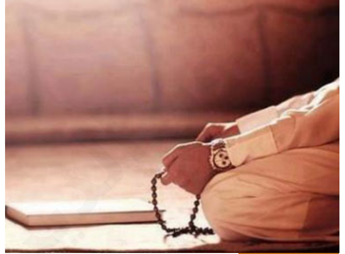
المؤمن إذا شعر بالغضب

إذا كان واقعاً يشعر بالغضب بمجرد أن يجلس ينزل الغضب خمسين بالمئة، إذا كان جالساً فبمجرد أن يستلقي ينزل الغضب خمسة وسبعين بالمئة، إذا كان مضجعاً يستلقي وهكذا.. هذه من توجيهات النبي صلى الله عليه وسلم، إذا بإمكاننا أن نمارس التحلّم، أن نسعى إلى الحلم، أن نمارس مقاومة الغضب، ألا تزيد الغضب غضباً، هناك إنسانٌ على العكس تماماً يجد نفسه قد غضب فيضرب يده على الطاولة فيكسر الزجاج وربما يجرح يده، هذا يمارس التَّغَضُّبَ إن صح التعبير، يعني هو عُصُوب ويزيد غضبه بما يستطيع، أما المؤمن فإذا شعر بغضبٍ فوراً يُغمص عينيه، أَعُوذُ بِاللَّهِ مِنَ الشَّيْطَانِ الرَّجِيمِ، أَعُوذُ بِاللَّهِ، يخرج من المكان، يُغَيِّرُ الحَالَةَ التي هو عليها، يتوضأ، هي دقيقة واحدة فإما أن تملك نفسك في هذه الدقيقة أو أن تملكك نفسك في هذه الدقيقة، إن ملكت نفسك في هذه الدقيقة فأنت سيد نفسك وبعد قليل تجلس وتحلّ الموضوع بالحوار الهادئ، وإن تملكك الغضب في هذه اللحظة فقد أصبحت عبداً لذاتك، عبداً للغضب، فأى قرار يتخذ في لحظة الغضب أنت تقول: ما كنت أريده، لكن وقع، انتهى، وقفت أنت في لحظة غضبٍ أو ضربت في لحظة غضبٍ فأهنت إنساناً أو ضربت زوجتك نسأل الله السلامة فكسرت ما بينك وبينها، أو ضربت ولدك بلحظة الغضب، الطفل إخواننا الكرام؛ يشعر، يوم يكون الضرب بعقلانية يشعر الطفل أن الأب يُحِبُّه لكن أئبه على ترك الصلاة ببعض ضرباتٍ خفيفةٍ على يده أو قَطَبَ جَبِينَهُ في وجهه، أو، إلخ.. يشعر الطفل بالمحبة أما في لحظة الغضب يشعر الطفل أن هذا انتقام، فيكسر شيء بينك وبينه قد لا تستطيع أن تُرممه إذا تكرر الموضوع مراتٍ ومراتٍ فيصبح دخولك إلى البيت تشاؤماً وخوفاً في البيت بدل أن يكون دخول الأب إلى البيت عيداً.