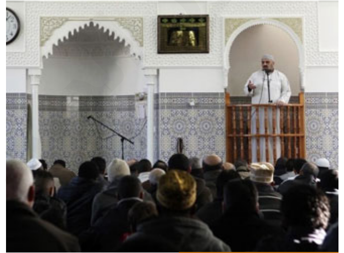
الخطاب الديني موافق لمتطلبات الناس

اليوم عندما يخطب أحد الخطباء مثلاً على المنابر، ويصيح بالناس من أول الخطبة إلى آخرها، أتمم، وأتمم، وأتمم، ويحملهم شرور الأمة كلها، ترفق بهم، هؤلاء الناس جاؤوك من كل حدب وصوب، ليستمعوا كلمتين طيبتين لطيفتين، فيجب عليك أن تحبهم بالله، تذكرهم بنعماء الله، تذكرهم بالآء الله، تلتفتهم إلى عظيم خلق الله، فتلتطف مع الناس، الرفق، الرفق في كل شيء.