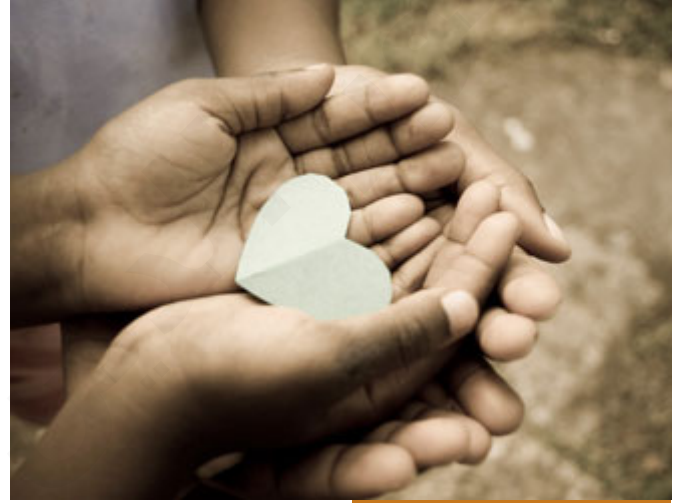
استخدام المكانة في قضاء حوائج الناس

كلما زيد في قدره وجاهه، أي تبوأ منصباً، أصبح كبيراً في العمر، صار الناس ينظرون إليه باحترام ومودة، يلقون عليه سلاماً خاصاً، قد يقبلون رأسه لعمره، أو لمكانته، أي له مكانة، وكل إنسان فينا من فضل الله عليه أن له مكانة، على الأقل في أسرته، في عائلته، في عمله، في مجتمعه، الناس تنظر إليه باحترام.