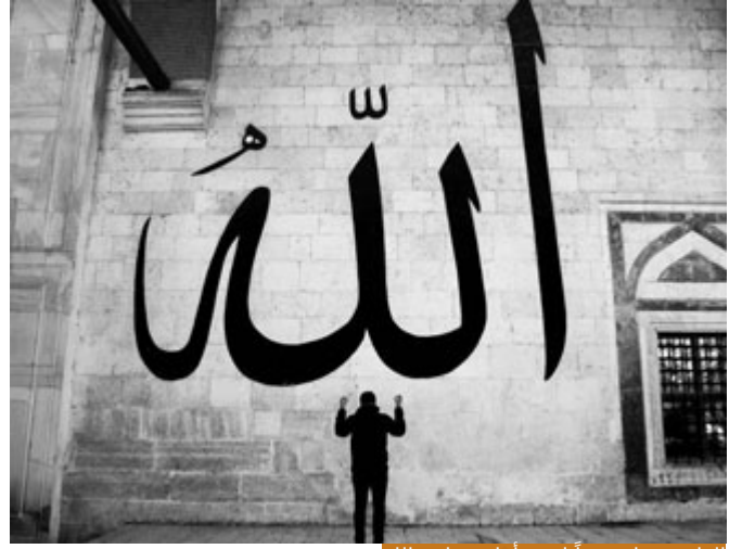
العلم يضغك وجهاً لوجه أمام عظمة الله

الآن أسوأ شيء أن يتعلم الإنسان العلم الشرعي فيزداد كبراً، هذه أسوأ ميزة، بالعلم الدنيوي قد يفهم بعض ذلك إنسان بعيد عن الله، تعلم علماً دنيوياً، يجب السيطرة، والفخر، والخيلاء، أما أن يتعلم علم الشريعة ثم لا يتواضع لعباد الله فهذه مصيبة كبيرة جداً، معناها لم يتعلم كما ينبغي، العلم ما كان موجهاً بشكل صحيح، لا يمكن أن تجد عالماً متكبراً، العالم متواضع لأن العلم يضغك وجهاً لوجه أمام عظمة الله، فتصغر لا تكبر، العلماء يقولون: لم تتبل أقدامنا بعدُ ببحر العلم، كل ما فعلناه هو نقطة من البحر، ما فعلنا شيئاً، فالإنسان عندما يدخل في العلوم كلما تعمق بالعلم أكثر يظهر له جهله، كان الإمام الشافعي يقول: كلما ازدت علماً ازدت علماً بجهلي.