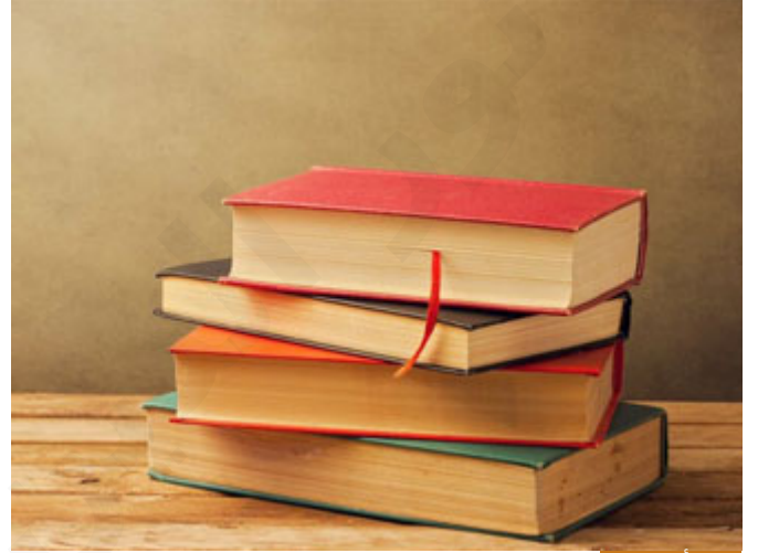
العلم أنواع ثلاث

قال: من علامات السعادة والفرح أن العبد كلما زيد في علمه زيد في تواضعه ورحمته، هذه الأولى، كلما تعلم شيئاً وزاد في عمله سواء بالعلم الديني أو الدنيوي، مطلقة علم ديني، وعلم دنيوي، أو لنقل العلم أنواع ثلاث: علم بالله، وعلم بأمر الله، وعلم بخلق الله، أي علم أعطني أي علم يجب أن يندرج ضمن هذه العلوم الثلاث، إذا قلت لي: أنا أتعلم عن أسماء الله الحسنى، هذا علم بالله، إذا قلت لي: أنا أتدبر القرآن بالأسحار، هذا علم بالله، إذا قلت لي: أنا أصلي ركعتي قيام الليل، هذا علم بالله، إذا قلت لي: كل يوم ريع ساعة دعاء، هذا علم بالله، إذا قلت لي: أحضر مجلس علم بالفقه، هذا علم بأمر الله، كليات الشريعة علم بأمر الله، المعاهد الإسلامية علم بأمر الله، تعلمك يجوز لا يجوز، علم بأمر الله، إذا قلت لي: فيزياء، علم بخلقه، رياضيات علم بخلقه، صناعة الزيوت علم بخلقه، صناعة الخمور والعياد بالله علم بخلقه، لكن منه ما هو محرم، ومنه ما هو جائز، ومنه ما هو مندوب، ومنه ما هو واجب، أحياناً العلم بخلق الله، إذا بلا لا يوجد فيه أي طيب به، قال تعالى: