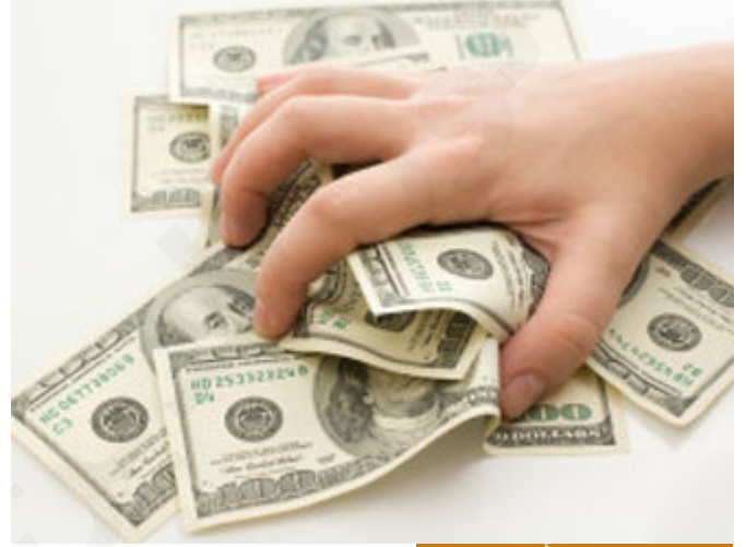
من علامات السعادة أن يقل الحرص

" يشيب ابن آدم، ما قال المؤمن، ابن آدم، وتشيب معه خصلتان الحرص والأمل "