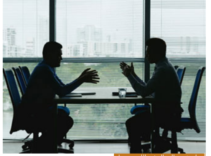
أخطر شيء الجدل في الله يغير علم

هلي عندما التقط آل فرعون موسى التقطوه من أجل أن يعاديهم لا، لكن هكذا كانت النتيجة، هذه يسمونها لام العاقبة، ليست لام التعليل، وهنا قد يكون هدفه (لِيُضِلَّ عَنْ سَبِيلِ اللَّهِ) وقد لا يملك هذا التصور، ولكن في الحقيقة فعله يصل الناس عن سبيل الله، لأن هناك أناساً عندهم ضعف بالإيمان فتأخذهم أي شبهة، يقول لك: والله على الفيس بوك تكلم فلان، عندما تبين له يقول لك: صحيح مباشرة، ولكن كم من إنسان أضل هذا الذي خرج على الإعلام و (يُجَادِلُ فِي اللَّهِ يَغَيِّرُ عِلْمَ وَلَا هُدَى وَلَا كِتَابٌ مُبِينٍ) وإنما بهوي نفسه وجعل يلوي النصوص كما يلوي عنقه ليضل عن سبيل الله، ويتأولها تأويلات باطلة بعيدة عن اللغة وفهم السلف الصالح، من أجل أن يحرف الناس عن منهج الله تعالى ويحل لهم الحرام، وهذا أخطر شيء الجدل في الله يغير علم، انظر قد يعصي الإنسان ربه، وكلنا عصاة ونسال الله السلامة، لكننا لا نستحل المعاصي، أنا أقول لك: والله هذا الأمر حرام، لكنني فعلته وأرجو الله أن يغفر لي، لا يوجد مشكلة، وإستغفر الله وكلنا ذو خطأ، ولكن أسوأ شيء أن أفعل الحرام وأريد أن أبرره وأن أشرعته للناس، وأنا أقول لهم هذا هو الحق، هنا المصيبة، هذا من (يُجَادِلُ فِي اللَّهِ يَغَيِّرُ عِلْمَ) الحكم الشرعي حرام وأنا اضطررت وفعلته فأسأل الله أن يعفو عني، أما الحكم الشرعي حلال لأنني أريد أن أفعله وقد غلطت نفسي، هنا المصيبة.