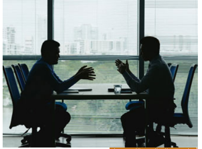
أخطر شيء الجدل في الله يغير علم

هلي عندما التقط آل فرعون موسى التقطوه من أجل أن يعاديهم لا، لكن هكذا كانت النتيجة، هذه يسمونها لام العاقبة، ليست لام التعليل، وهنا قد يكون هدفه (لِيُضِلَّ عَنْ سَبِيلِ اللَّهِ) وقد لا يملك هذا التصور، ولكن في الحقيقة فعله يصل الناس عن سبيل الله، لأن هناك أناساً عندهم ضعف بالإيمان فتأخذهم أي شبهة، يقول لك: والله على الفيس بوك تكلم فلان، عندما تبين له يقول لك: صحيح مباشرة، ولكن كم من إنسان أضل هذا الذي خرج على الإعلام و(بُجَادِلُ فِي اللَّهِ يَغَيِّرُ عِلْمَ وَلَا هُدَىٰ وَلَا كِتَابٌ مُّبِينٌ) وإنما بهوي نفسه وجعل يلوي النصوص كما يلوي عنقه ليضل عن سبيل الله، ويتأولها تأويلات باطلة بعيدة عن اللغة وفهم السلف الصالح، من أجل أن يحرف الناس عن منهج الله تعالى ويحل لهم الحرام، وهذا أخطر شيء الجدل في الله يغير علم، انظر قد يعصي الإنسان ربه، وكلنا عصاة ونسال الله السلامة، لكننا لا نستحل المعاصي، أنا أقول لك: والله هذا الأمر حرام، لكنني فعلته وأرجو الله أن يغفر لي، لا يوجد مشكلة، وإستغفر الله وكلنا ذو خطأ، ولكن أسوأ شيء أن أفعل الحرام وأريد أن أبرره وأن أشرعته للناس، وأنا أقول لهم هذا هو الحق، هنا المصيبة، هذا من (بُجَادِلُ فِي اللَّهِ يَغَيِّرُ عِلْمَ) الحكم الشرعي حرام وأنا اضطررت وفعلته فأسأل الله أن يعفو عني، أما الحكم الشرعي حلال لأنني أريد أن أفعله وقد غلطت نفسي، هنا المصيبة.