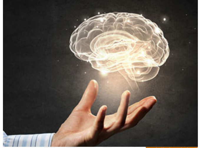
العقل لا يقبل التناقض

إذاً عندما أدخل بأي جدال مع شخص ينبغي أن أملك هذه الأدوات، أو على الأقل أحدها، أما أن يدخل في جدال والشخص لا يعلم ولا يحسن الاستدلال، ولا يؤمن بالغيبي، فكيف تجادل؟!