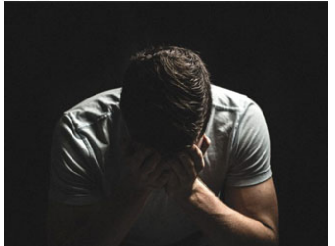
العذاب الكامل يوم القيامة