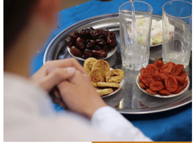
إمساك المسلم العاقل عن جميع المفطرات

فالصيام؛ هو الامتناع (إِنِّي تَدْرُتُ لِلرَّحْمَنِ صَوْمًا) جاء الامتناع هنا عن الكلام هذا في اللغة.