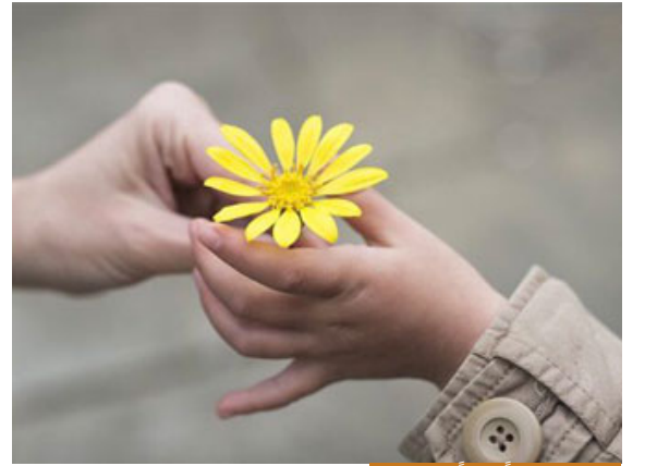
ليكن القلب نقياً صافياً في رمضان

يعني إما أن يحمل هكذا أو يحمل هكذا، لا يوجد قلب يحمل الاثنين معاً، يمثل القلب بالقصة، فإذا شخص هناك قصة تشغله كثيراً؛ أن شخصاً أكل عليه ألف دينار، ولا يعطيه إياهم فتأخذ القصة حيزاً كبيراً من تفكيره، ففكر أن هناك جنة ونار، وهناك أولادك، وهناك زوجتك، وهناك حياتك، وهناك أسرته، وهناك مئة دعوة تدعوها، فكل همه يصح أن يدعو على هذا الإنسان، فأنا أظن أنه يحجر واسع، ويصيق على نفسه، دعونا نستغل بالدعاء للناس بالهدايا بالدعاء بالخير، بالدعاء لنفسه، بالدعاء للآخرين، بكلمات طيبة، ليكن القلب نقي صافي برمضان، هذا لا يعني أن يسامح، المسامحة شيء آخر، الإنسان له أن يسامح أو لا يسامح هذا حقه، وبالمناسبة الله جل جلاله في الأمس كنت أتكلم مع مجموعة من الإخوة، هو ذاته، الله رب الوجود الذي لا يسأل عما يفعل لم يعط نفسه أن يسامح إنسان ظلم عن إنسان آخر، يعني لا يقول له أنا سامحك، يقول له: اذهب وأد الحق، حتى برمضان تُغفر كل الذنوب ولكن إذا عليك ديون يجب أن تؤديها، إذا هناك شخص ظلمته، وتكلمت عليه، ونفسه منهارة بسبب كلامك يجب أن تذهب لتستسمحه، أنا لا أسامحك عنه، جل جلاله لو قال له أسامح لا أحد يقول له لا، جل جلاله لا يسأل عما يفعل، لو أحب أن يسامح الخلق بالخلق، فهو خالق الجميع والكل عباده، ومع ذلك ترك حقوق العباد مبنية على المشاهدة لا على المسامحة، هو حقه يسامح به جل جلاله لكن حقوق العباد بتركها للعباد، لا أقول يسامح أو لا يسامح، لكن أن يشغل قلبه بشكل دائم أنه يريد أن يدعو على فلان، وقلبه ممتلئ، لا، ليكن في رمضان فرصة للدعاء بالخير لأنفسنا، وأهليتنا وأقربائنا من خيري الدنيا والآخرة يكون أفضل وأريح للنفس.