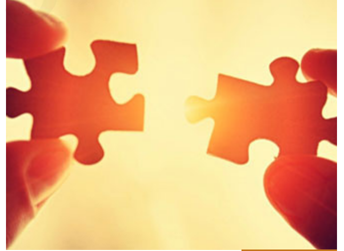
الصبر والتقوى متلازمان

فالصبر والتقوى متلازمان، فالصيام مدرسة للروح في الصبر، نحن عندما نترك الطعام والشراب في نهار رمضان إنما نترك ذلك مختارين، لكننا نعلم أن هناك من ترك الطعام والشراب في رمضان وغيره مضطراً لا مختاراً؛ لأنه لا يجد ما يأكله، فنشعر بالفقراء، ونتعلم في مدرسة الصبر أن نصبر على كل شيء، "الصبر مطية لا تكبو" كان عمر رضي الله عنه يقول: "وجدنا خير عيشنا في الصبر" لم يقل في حالة الرخاء، وإنما في حالة الشدة، عندما كانوا يُسامون سوء العذاب في مكة كانوا يجدون خير عيشهم؛ لأن الصبر مرتبة راقية جداً، لا يعرفها إلا المخلصون العالمون: