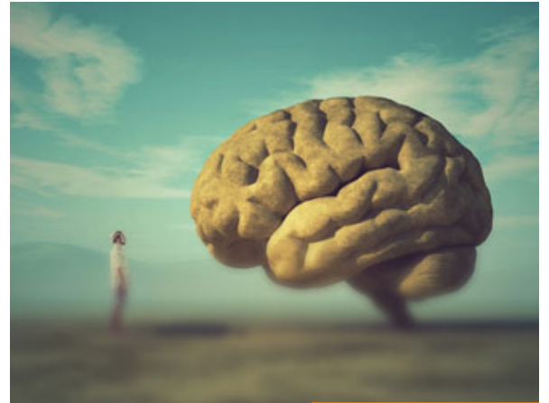
العقل مرتبط بالبيئة والحياة والعصر

السبب الثاني: العقل فردي وليس جمعياً، فما أجده أنا بعقلي غير ممكن، تجده أنت بعقلك ممكناً، ممكن الآن بهذه اللحظة تأتي بمسألة معينة، ونعالجها عقلياً، أنت تقول لي واضحة، لا شيء بها، أراها طبيعية، وأنا أقول لك لم تدخل بعقلي، لأن العقل ليس شيئاً جمعياً: أي مفردات 1، 2، 3، العقل مرتبط بالبيئة، مرتبط بالحياة، مرتبط بالعصر، مرتبط بالطروف، بمئة قصة، فمن غير الممكن أن يكون هناك عقل واحد، حتى أقول هذا العقل وهذا النقل، فما تجده أنت حسب بعقلك قد أجده سبباً بعقلي حسب معطياتي، وما تجده أنت غير حسن أجده أنا مناسب، فمثلاً، في الأعراف في منطقة معينة - لا تتعلم بالشرع، تتكلم بأمر الحياة- يقول لك والله عيب، لا يجب أن تدفع العروس أي شيء، أنا الرجل، وأنا أدفع كل شيء، تذهب لبلد نان، يقول آخر: ستشارك مع العروس، التكاليف عليها، معقول كل شيء عليه؟ معقول كل شيء عليه؟ غير معقول، يقول: معقول أنه رجل ويقبل أن تدفع المرأة؟ فالمشكلة بالبيئة، أنت بيتك نشأت أن الرجل يجب ألا تشاركه زوجته بأي شيء من مصاريف العرس والبيت، والآخر بيتك تقول له بالعكس، عيب، يجب على المرأة أن تقف مع زوجها، وهذا عقل، وهذا عقل، وهذا عقل فإذا ما كان هناك [تربيلٌ من حكيمٍ حديدٍ] لا نستطيع أن نحتكم للعقل.