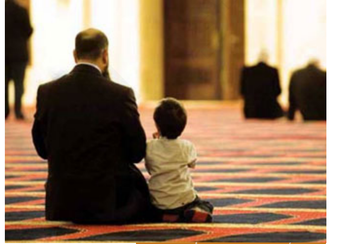
تعريف الأولاد على الله من خلال أسمائه الحسنى

خلاصة الموضوع إخواننا الكرام، الأسماء الحسنى في تربية أنفسنا وفي تربية أبنائنا مهمة جداً، يعني أنت تريد أن تعرف ابنك على الله عز وجل يجب أن تعرفه على الأسماء الحسنى، فهذه هي السبيل الوحيد، تقول له ربنا عز وجل عظيم، رحمن، رحيم، غفور، ودود، قريب، مجيب، القدوس، سلام، مؤمن، مهيم، عزيز، جبار، متكبر، خالق، باري، مصور، له الأسماء الحسنى.