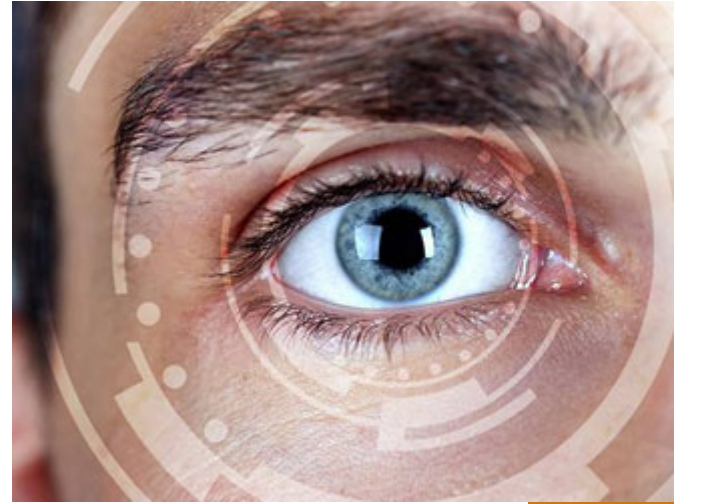
البصير خلق البصر

قرنية، وفزجية، وشبكية، وطبقات، ومطابقة، ومطابقة باللحظة، الآن يقول لك: يوجد صورة على الموبايل خطيرة جداً، تأخذ بانوراما، العين البشرية لو كنت تتابع مباراة كرة قدم تُلقى الكرة من أول الملعب لآخره، بكل لحظة هي بعد مختلف عن عينك من اللحظة التي قبلها، وتتم المطابقة آنية كل لحظة بلحظتها، حتى ترى الكرة بكل لحظة بوضعها الطبيعي دون تشويش، تنتقل وتراها [أَلَمْ تَجْعَلْ لَهُ عَيْنَيْنِ] فالبصير خلق البصر، الآن إذا كنت تعلم أن الله يرى، فلا ينبغي أن تعصيه، تتحرك بمعصيته؛ لأنو يراك، كل أسماء الله الحسنى تقريباً، كلها لها معنى ولها انعكاس في الكون، وينبغي أن يكون لها انعكاس على السلوك، هذه الأمور الثلاثة مع بعضها تحقق معنى قوله تعالى: [وَلِلَّهِ الْأَسْمَاءُ الْحُسْنَى فَادْعُوهُ بِهَا] وتحقق معنى قوله صلى الله عليه وسلم: (مَنْ أَحْصَاهَا دَخَلَ الْجَنَّةَ).