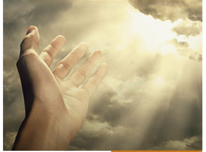
الحكمة والعدل هم شرع الله عز وجل

والحكمة من الحكمة، والحكمة هي الحديدية التي توضع في فم الفرس لتتحكم به لئلا يأكل كثيرًا من الأرض، فيسحب فيتوقف عن الأكل تسمى الحكمة، فالحكمة أن يجعل الإنسان وقتًا قبل أن يتصرف؛ لأنه إن تصرف وعنده نقص معلومات ثم تبينت له المعلومة الصحيحة فإنه يندم، لكن هنا قدم الحكيم على العليم لأن الموطن هنا موطن حكمة؛ أي الله تعالى له حكمة عظيمة فيما يفرضه على عباده، فلما يتدخل الإنسان فيما لا شأن له به فيحلل ويحرم فإنه إنما يفعل خلاف الحكمة، فالحكمة هي شرع الله، والعدل هو شرع الله، وكان ابن تيمية -رحمه الله- يقول: "الشرعية رحمة كلها عدل، عدل كلها، مصلحة كلها، حكمة كلها، وأي قضية أخرجت من الرحمة إلى القسوة، ومن الحكمة إلى خلافها، ومن العدل إلى الجور، ومن المصلحة إلى المفسدة، فليسيت من الشرعية وإن أدخلت عليها بألف تأويل وتاويل"، الشرعية حكمة، فقد تفهم الحكمة وقد تغيب عنك الحكمة لكن تؤمن بحكمة الله تعالى في شرعه (إِنَّهُ خَكِيمٌ عَلِيمٌ) -جل جلاله-.