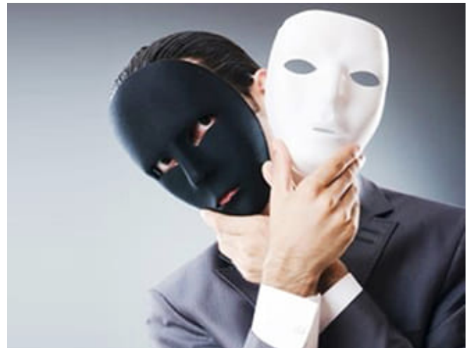
تجريم الحلال وتحليل الحرام أعظم افتراء على الله عز وجل

الآن قضية جديدة متعلقة بالمشركين أدت إلى خسارتهم في الدنيا والآخرة، وهي أنهم (قَتَلُوا أَوْلَادَهُمْ سَفَهًا بِغَيْرِ عِلْمٍ)؛ والثوب السفية هو الثوب الرقيق الذي يشف عما تحته، والسفيه هو الشخص الطائش الأحمق الذي طارت أخلامه، ليس عنده حلم وهدوء ورزانة ورضانة، (قَدْ خَسِرَ الَّذِينَ قَتَلُوا أَوْلَادَهُمْ سَفَهًا بِغَيْرِ عِلْمٍ) حَمَقًا وَجَهْلًا وَبَعْدًا عَنِ الْحِلْمِ، (بِغَيْرِ عِلْمٍ) وهذا قيد وصفي وليس قيدًا احترازيًا بمعنى أنه لا يوجد إنسان يقتل ولده سفهًا بعلم، وإنما كل من يفعل ذلك يفعله بغير علم، وكذلك قوله تعالى: