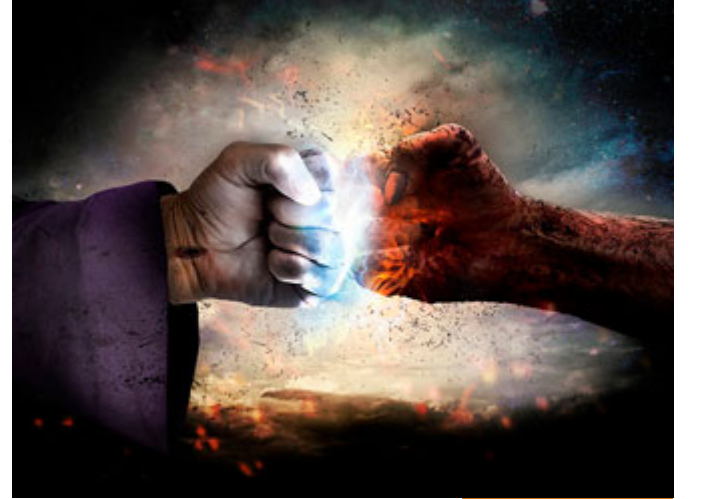
دورة الحق والباطل طويلة

لكن إن لم يتح لنا فهذه حكمة الله، لماذا؟ لأن دورة الحق والباطل طويلة أطول من عمر الإنسان، الذي عاشروا المغول والتتار مات كثيرون مظلومين ولم يروا النصر عليهم، الذي بنوا مع صلاح الدين الأيوبي من البدايات لم يروا صلاح الدين الأيوبي يوم حرر القدس، لم يروه بأعينهم لكن خلد اسمهم بأنهم كانوا معه في بداية المشوار والطريق، دورة الحق والباطل قد تكون أطول من عمر الإنسان؛ إذا كان رمضان يأتي في أبي كل ثلاث وثلاثين سنة مرة وإنسان مات وعمره سبع وعشرون سنة قد لا يأتي عليه عام ويرى رمضان في أبي ويعيشه، لأن الدورة طويلة، أيضاً الحق والباطل يتصارعان، فقد تمتد جولة الباطل فتكون أطول من جيل كامل لكن حسينا أننا إذا لقينا الله عز وجل نقول: يارب نحن عشنا في عصر فيه من السوء ما فيه، وفيه من الفتن ما فيه، وفيه من الصوارف ما فيه، وجاءتنا الشياطين لتشغلنا عن ديننا ولكننا بقينا ثابتين صامدين على الحق حتى لقيناك وأنت راض عنا، هذا يكفيننا إن شاء الله، وعملنا ما بوسعنا وبدلنا المستطاع في سبيل نصرة أمتنا وعزتها، هذه دروس من الهجرة أسأل الله تعالى أن ينفع بها. كل عام وأنتم الخير، والسلام عليكم ورحمة الله وبركاته.