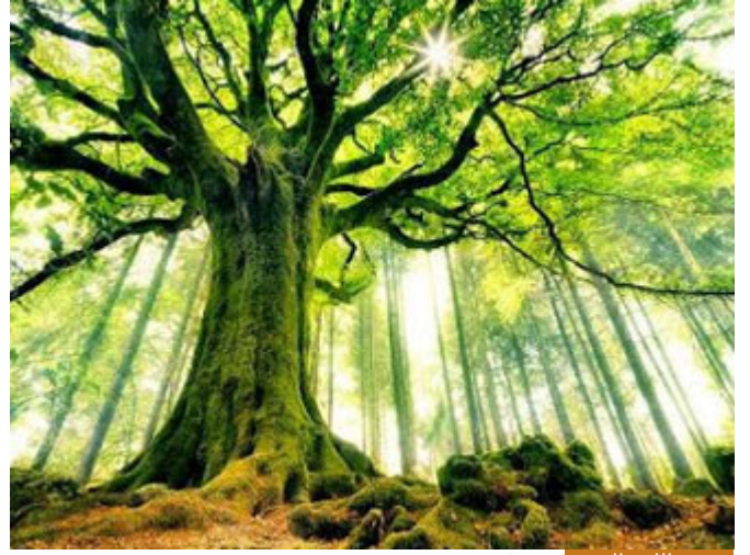
رسوخ اللغة العربية

أيضاً من خصائص هذه اللغة: أنها ثابتة، وراسخة، ومحفوظة، اللغة العربية قد تجاوزت خمسة عشر قرناً، هي من اللغات السامية وربما تكون هي أصل اللغات، لكن لن نتحدث في هذه الجدلية، لكن عندما نتحدث مبدئياً عن خمسة عشر قرناً فأنت تفهم شعر امرئ القيس، فالיום بدرس طلابنا في الصف العاشر الشعر الجاهلي، ويقرؤونه ويفهمونه، وشرح مفردات بسيط من معاجم اللغة نفسها، لكن قبل ثلاثة قرون كان شكسبير فكتب باللغة الإنكليزية واليوم لا يستطيع متعلم اللغة الإنكليزية أن يقرأ من أدب شكسبير ويفهم ماذا يكتب لأن اللغة تغيرت، لم يبق منها إلا النزر اليسير، تطورت، أما اللغة العربية فراسخة ممتدة في الجذور، جذورها راسخة.