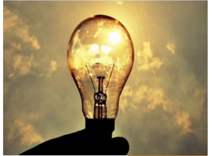
اليقين العقلي لا يملكه إلا العقلاء

فأنت تؤمن بإخباره مئة بالمئة، وكأنك تراه بعينك، آخر ما أريد أن أقوله في هذا الشأن (وَإِنْ كُنْتَ مِنْ قَبْلِهِ لَمِنَ الْغَافِلِينَ) مستويات المعرفة عند البشر إما أن تكون باليقين الحسي وهو أن يرى الإنسان الشيء بعينه أو يسمعه بأذنه فيقول: هذا صوت الأذان، ويقول: هذا محمد، لأنه رآه بعينه يعرفه، فهذا يقين حسي لا يختلف فيه عاقلان بل لا تختلف فيه عن بقية الكائنات فحتى القطعة ترى وتسمع، فلا يكن هم الإنسان أن يرى الشيء بعينه أو يسمع بأذنه، لأن هذا من أدنى مستويات المعرفة، أدنى مستوى نشترك به مع بقية المخلوقات، وبعد اليقين الحسي يأتي اليقين العقلي وهذا لا يملكه إلا العقلاء من البشر، فنستدل على شيء لا نراه بأعيننا وإنما نرى آثاره فنستدل على وجوده، فنقول: في هذه القاعة كهرباء لأننا نرى المصباح يُضيء، ووراء هذا الحائط نار لأننا نرى الدخان من خلفه، ولا دخان بلا نار، وهناك خالق لا نراه بأعيننا لكنه موجود بشكل صارخ من خلال مخلوقاته، هذا الاستدلال العقلي وهذا لا يتقنه إلا العقلاء، ثم يأتي بعد ذلك الاستدلال الخيري أن يأتيك حديث عن شيء لا تملك إلا الخبر، لا عقلك يستطيع أن يخدمك في هذا الأمر ولا حسك يستطيع أن يبتك بشيء منه ولكنه يأتيك بالخبر كمثل قصة يوسف عليه السلام، فهنا لا تملك إلا أن تقول: أمنت به لأنه من عند الله تعالى وكأنني أراه بعيني بل أشد مما أراه بعيني، قال أحد السلف: لقد رأيت الجنة والنار عياناً، فقالوا له: انظر فيما تقوله يا رجل؟ من رأى الجنة والنار عياناً؟ قال: والله لقد رأيتهما عياناً، لقد رأيتهما بعيني رسول الله صلى الله عليه وسلم ورؤيتي لهما بعيني رسول الله صلى الله عليه وسلم أصدق عندي من رؤيتي لهما بعيني، لأن بصري قد يزيغ وقد يطغى وأما بصره صلى الله عليه وسلم فما زاع وما طغى.