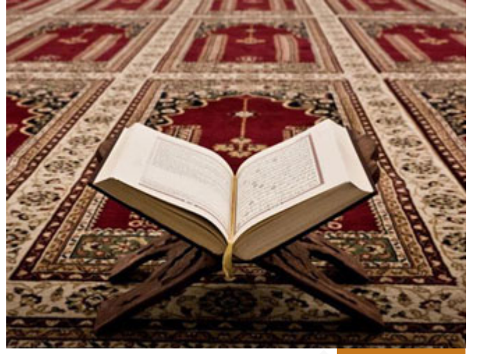
خصوصية سورة يوسف

سورة يوسف هي السورة القرآنية الوحيدة التي ذكرت من مبتدئها إلى مختتمها قصة واحدة اكتفت بها، مع التعقيبات والعبير والدروس، ورد في سورتين اسم سيدنا يوسف عليه السلام، في الأنعام وعافر، ولم ترد قصة سيدنا يوسف عليه السلام إلا في هذه السورة.