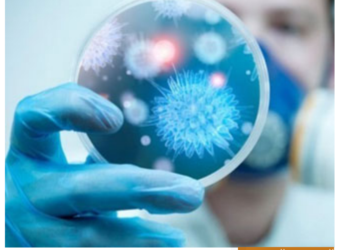
المخترع هو الذي يسمى