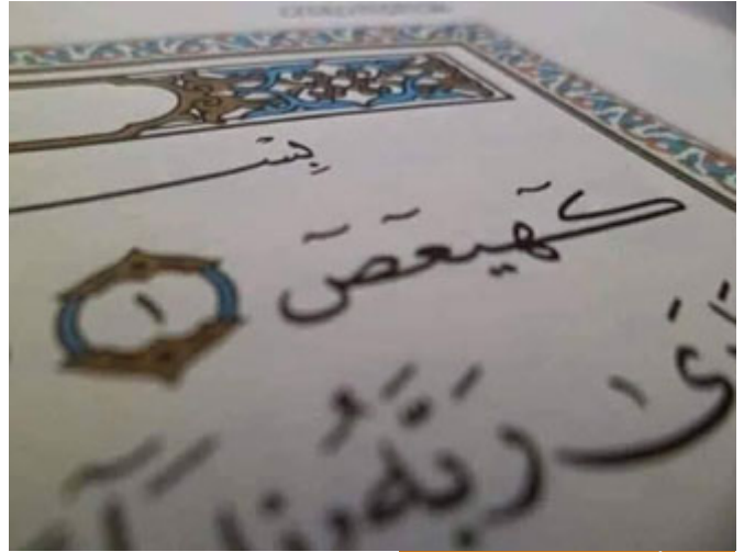
وردت الأحرف المقطعة في 29 سورة

(الر) هذه أحرف مقطعة، وردت في تسع وعشرين سورة من سور القرآن: (يس)، (طه)، (الم)، (ق)، وقد وردت إما حرفاً واحداً في بداية السورة كقوله تعالى: (ن)، (ق)، (ص)، في ثلاث سور، وإما حرفان في تسع سور: (يس)، (طه)، (حم)، وإما ثلاثة أحرف كقوله تعالى: (الم)، (الر)، وإما أربعة أحرف (المرا)، (المص) في سورتين، وإما خمسة أحرف في سورتين: سورة مريم: (كهيعص)، سورة الشورى: (حم * عسق)، والذي يلفت النظر أنه في كل السور ما عدا أربع سور جاء ذكر القرآن الكريم بعد الأحرف المقطعة، كقوله تعالى