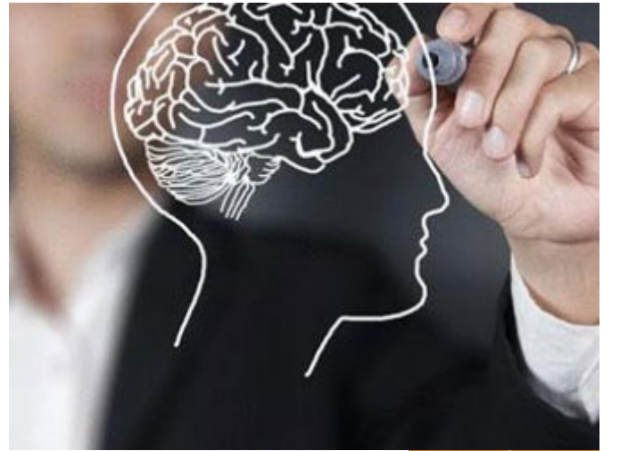
العقل في الأصل هو الربط

ما معنى العقل؟ لما قال: ("اعْقِلُهَا وَتَوَكَّلْ")، قال: أَعْقِلُهَا أم أَتَوَكَّلُ؟ الناقه، أربطها أم أدعها وأتوكل؟ قال: اعْقِلُهَا هذا السبب، خذ بالسبب ثم توكل على الله، لا تَعَارِضْ بين العقل والتوكل، فالعقل في الأصل هو الربط، عقل الناقه: ربطها، وسمي العقل عقلاً، وعلى فكرة لم يذكر في القرآن الكريم مفردة العقل كجهاز، ذكر العقل أنه يعقل (لَعَلَّكُمْ تَعْقِلُونَ) ذكر الأدوات، لكن العقل لم يذكر، لكن اليوم العقل مصطلح معروف، ما هو العقل؟ هو الطريقة التي يدرك بها الإنسان ما حوله، كيف يعقل الإنسان؟ لأن العقل يربطه عن الوقوع فيما يسوقه في دنياه وفي آخرته، فإذا وجدت إنساناً اليوم لا يتقي الله فهو غير عاقل، لأن عقله لم يمنعه من الوقوع في المحرمات، فهو يفكر ويحاكم وربما يخترع لكنه ليس عاقلاً، ولو كان عاقلاً لعقله فكره، ربطه فكره، عن أن يقع فيما يخرمه سعادة الأبد، فالعاقل هو من يطيع الله، والمجنون هو من يعصي الله، لأنه ستر عقله.