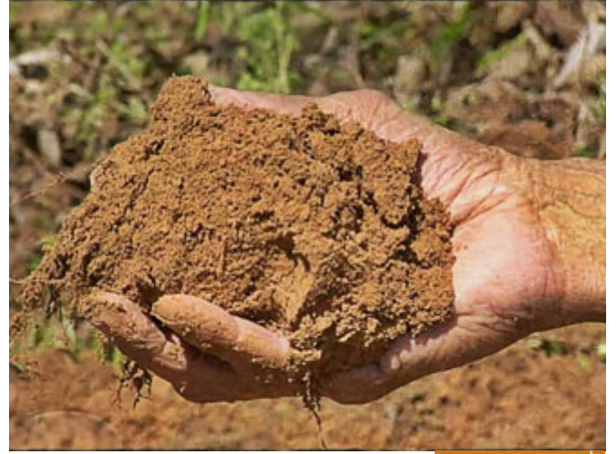
الأصل هو الماء والتراب

﴿هُوَ الَّذِي خَلَقَكُمْ مِنْ طِينٍ﴾ وورد من ماء، وورد من تراب، هذا الخلق الأول خلق آدم عليه السلام، نحن كلنا مخلوقون من نطفة من ماء مهين ولكننا في أصل الخلق لأننا تناسلنا من آدم فيصدق أن يقال إننا خلقنا من طين لأن أبانا خلق من طين، فالطين هو إضافة الطين إلى التراب، فهي مراحل خلقية، فمرة يقول من ماء ومن تراب ومن طين، فهي متكاملة وليست متناقضة هذه المراحل: صلصال، حمأ مسنون، كلها مراحل الخلق، الأصل الماء والتراب، طين، صلصال كالفخار، حمأ مسنون، فكله بالتالي، خلق آدم عليه السلام، ونحن هنا أمام غيب لا نعلم منه إلا بمقدار ما يطلعنا الله تعالى عليه.