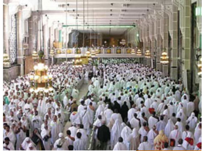
الحج شعيرة عالمية إعلامية

العبادات ليس لها سور خاصة باسمها، مع أن الصلاة هي عماد الدين، لكن ليس في القرآن سورة الصلاة، والصيام ذكر فرضيته في سورة البقرة، لكنها سورة البقرة وليست سورة الصيام، والزكاة ذكرت في آيات كثيرة، وذكر الإنفاق، لكن لم تُفرد سورة، والحج لأنه شعيرة عالمية، إعلامية فيها جانب الإعلام: