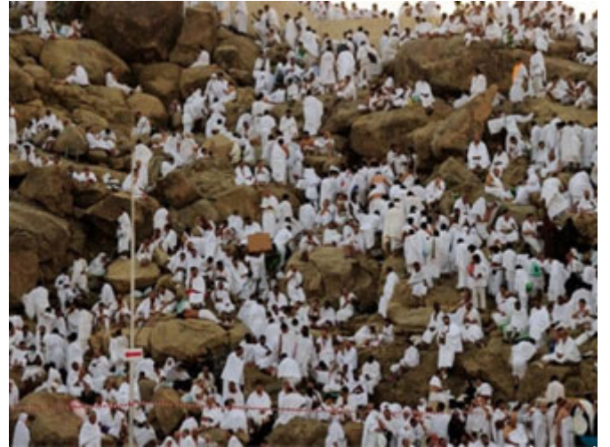
أراد الله أن يكون الحج بواد غير ذي زرع

لكن الله تعالى أراد أن يكون في واد غير ذي زرع: لتلا يختلط السَّحَابُ بالعباد.