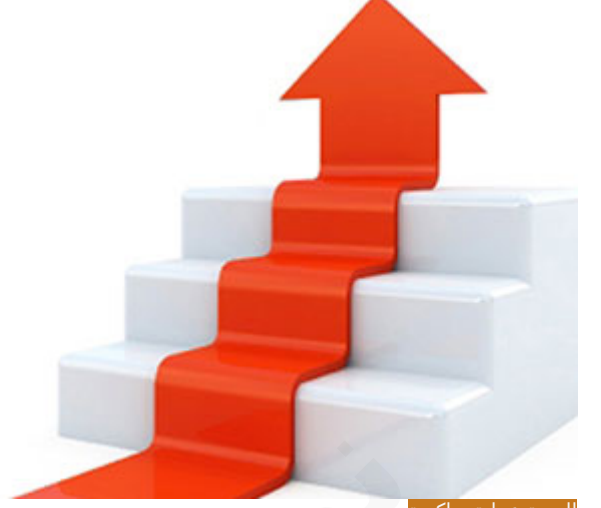
التربية عملية تراكمية

هناك ملح أيضاً مهم في هذا الحديث؛ حاطب مسلم وربما مضى على إسلامه في هذه الحادثة سنوات لأن غزوة بدر وبعدها، فرميا ثلاث أو أربع أو خمس سنوات، هو من المهاجرين، ومع ذلك أخطأ لأن التربية عملية تراكمية، التربية الإيمانية أو أي تربية وهذا نحتاجه مع أولادنا عملية تراكمية وليست عملية لحظية، أنا كنت مدير مدرسة وكنت معلماً قبل ذلك أدرس الطلاب، فأحياناً يدخل اليأس إلى المعلم عندما يرى مخالفة يرتكبها الطلاب، النفس في طبيعتها تركز على الشيء السلبي فيدخل اليأس لنفوسنا، كنت أذكر نفسي دائماً بأن التربية عملية تراكمية، يعني هذا الشاب لا يعني أنه لن يخطئ من قال لك: إنه لن يخطئ؟ ابنك أيضاً في البيت أو أخوك أو الموظف الذي عندك ... إلخ، من قال لك: إنك ستوجهه من المرة الأولى ويصبح ملاكاً مباشرة! ما هكذا جعل الله الحياة، فحاطب رغم كل هذه الإيمانيات ورغم شهود بدر لكن أَلَمَّتْ به لحظة ضعف طارئ، قال له: ما قَعَلْتُ ذلك كُفْرًا ولا اُرْتِدَادًا، ولا رَضًا بالكُفْرِ بَعْدَ الإِسْلَامِ، أبداً، لكن لحظة ضعف، الخطأ خطأ، ونقول: هو خطأ، لكن هل هذا الخطأ يعني لا يمكن أن يحصل؟ لا، حصل، وهو صحابي، فالיום في تعاملك مع الناس ووطن نفسك أن الناس يخطئون، أنا لا أبرر الآن وأعذر، يعني نسال الله أن لا تكون، لكن هذا أمر وارد هي طبيعة الحياة أن الإنسان ينسى