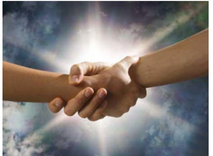
قدر حاجات الناس

العنوان الثالث: قدر حاجات الناس ولا تتجاهلها، ما معنى ذلك؟ حاطب رضي الله عنه جاء بحجة، هذه الحجة هي غير صحيحة شرعاً أبداً انتبهوا، لا يجوز حتى أحمي قرابتي وأهلي، هو غلغل في بعض الروايات قال: إني أعلم أن الله ناصرك، يعني أنت بالنتيجة منصور منصور فما المشكلة إذا أخبرتهم وأحمي نفسي، هذه المعادلة غلط، أنت مخطئ، أنت تخبرهم شيء من أمر المسلمين فأنت مخطئ بلا شك، لكن هي حاجة من حاجاته، يعني هو له مشكلة فالنبي صلى الله عليه وسلم قدر حاجته أن عنده مشكلة في أن له قرابة وأهلاً ومالاً، النبي صلى الله عليه وسلم ما قال له: إقرابتك وأهلك أهم عندك من الدعوة الإسلامية! تُصَلِّ قرابتك وأهلك على أمر رسول الله وأمر الله، ما هذه الحاجة السخيفة التي عندك! لا يا أخي، الرجل له حاجة، اجتهد فأخطأ، حاجته صحيحة لكن الطريق التي سلكها للوصول إليها كان خطأ فالنبي صلى الله عليه وسلم وجهه إلى أن هذا خطأ كبير، لكن قبل عذره ولم يتجاهل حاجته.