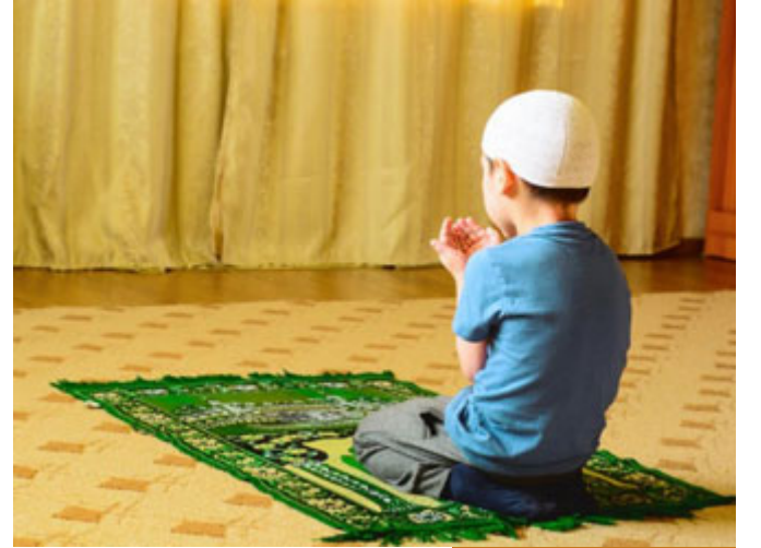
يؤمر الطفل بالصلاة في السابعة

لم نجد له عزمًا على المعصية لكنه نسي، فنحن إن شاء الله لسنا عازمين على المعصية ولكننا ننسى فوطن نفسك مع ابنك أن التربية عملية تراكمية، انظروا النبي صلى الله عليه وسلم ماذا يقول؟ مَرُوا أَوْلَادَكُمْ بِالصَّلَاةِ وَهُمْ أَبْنَاءُ سَعْيٍ، سنفترض جدلاً وسطيًا أنه بلغ سن التكليف عند الخامسة عشر، من السابعة إلى الخامسة عشر هناك ثماني سنوات، في السابعة بدأت تأمره أن يصلي، الآن كم سنة؟ ثلاث سنوات أعطانا النبي صلى الله عليه وسلم ثلاث سنوات تأمره، مرة يصلي، ومرة يصلي بلا وضوء ومرة يقول لك صليت وهو لم يصل، ومرة يقول لك: كنت مع أصدقائي وصلينا هناك، وأنت أحياناً تغض النظر عنه، أحياناً تقول له كأنك نسيت، وكذا، ثلاث سنين وأنت تأخذ وتعطي معه من أجل الصلاة، بعد ذلك أصبح بالعاشرة هنا بدأنا بمرحلة جديدة، وأصْرَبُوهُمْ عَلَيْهَا وَهُمْ أَبْنَاءُ عَشْرِ، طبعاً الضرب غير المُتَّبِعِ، الضرب الذي يشعره بأنه أخطأ في حق الله، يعني ضرب شيء بسيط، الضرب غير المبرح حتى لما الفقهاء يذكرون الضرب للزوجة بالسواك ونحوه،