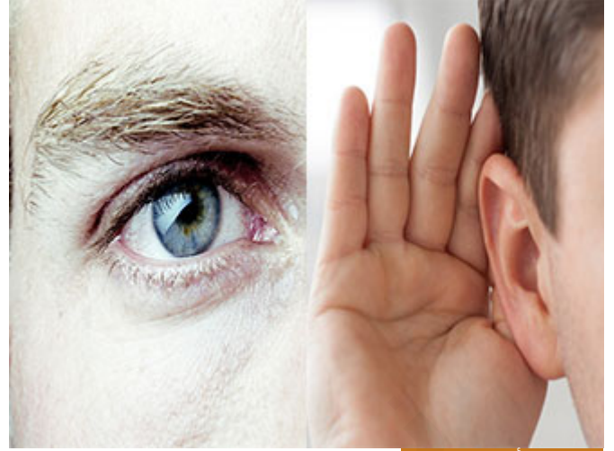
المستوى الأول مستوى نظر

أخواننا الكرام: حتى أعقب على قضية كيف تيقنوا من خبر رسول الله صلى الله عليه وسلم، مستويات المعرفة، ولعلي ذكرت ذلك على عجلة سابقاً لكن التفصيل فيه الآن مهم، مستويات المعرفة، حتى نتعرف على العالم عندنا مستويات للمعرفة، المعرفة الأولى وأنا أسميها المعرفة السطحية البسيطة المبدئية هي ما يتعرف إليه الإنسان من خلال حواسه الخمس التي أودعها الله فيه، فيشم رائحة فيقول: هذه رائحة ياسمين، وينظر فيقول: هذه طاولة، ويسمع فيقول: هذا صوت أبي فلان، ولمس فيقول: هذا ملمس جلد الأرنب، يتعرف من خلال حواسه، ويتذوق فيقول: هذا طعم البانسون، هذا مستوى المعرفة الأول، مستوى الحواس الخمس وهذا يشترك به الإنسان مع كثير من المخلوقات الأخرى، فهو ليس مقياساً ليقول: والله أنا أعرف بحواسي، أو يقول: أنا لا أصدق حتى أرى بعيني، هذا كلام لا معنى له، لا تسو نفسك بالمخلوقات الأخرى هذا شيء منطقي أن ترى شيئاً فتعرفه، فهذا المستوى الأول نسميه حتى نختصره نظر، لأن أهم طريقة يتعرف بها الإنسان على العالم الخارجي هو النظر، العين، فنقول المستوى الأول مستوى نظر، هذا مستوى بسيط، المستوى الأعلى منه الذي لا يدرك من خلاله ولا يتعرف من خلاله إلا العقلاء هو الأثر، فالأثر يدل على المؤثر، فالعقل يقول: هناك كهرباء في الغرفة، لكن هل تراها؟ لا، ولكني أرى آثارها، هذا المصباح المتألق وهذا الصوت المكبر يدل على وجود الكهرباء فيستدل من خلال شيء يراه بعينه إلى شيء لا يراه بعينه، هذا الأثر، وهذا طريق الإيمان بالله القطري البسيط جداً الذي تعبدنا الله عز وجل به، الله عز وجل يقول لنا: