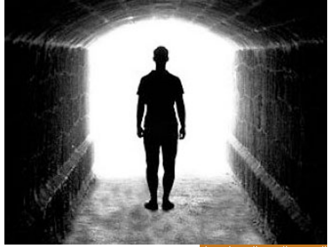
الغيب هو الشيء الذي غاب عنك

قال: (فَلَا تَسْتَعْجِلُوهُ) معناها لم يأت فلماذا يقول سبحانه: أتى؟ لأن أمر الله آتٍ لا محالة فيعبر الله بالفعل الماضي عن الشيء المستقبلي لأن الإتيان متحقق مئة بالمئة، فنحن أمام نظر وأثر وخبر، والخبر هو أعلى مستويات المعرفة في عالم الإيمان وهذا ما يسميه القرآن عالم الغيب، أو الإيمان بالغيب، عالم الشهادة نظر وقد يلحق به الأثر، لأن الأثر شيء من الشهادة لأنك تشاهد شيئاً فتستدل على شيء آخر فهو شهادة، أما عالم الغيب هو الشيء الذي غاب عنك، فالله تعالى: