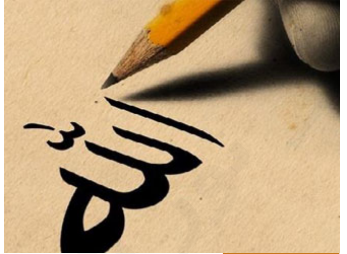
اليقين بخير الله وخير رسوله

مستحيل أن يضيعنا ربنا إذا اتئمرنا بما أمر وأتبهينا عما عنه نهى وزجر، الآن موطن الشاهد: عمر رضي الله عنه اتضح عنده الأمر فيما بعد، الأمر اتضح، لأنه الذي حدث هو فتح مكة، وهؤلاء الذين ردّهم النبي صلى الله عليه وسلم شكلوا قطاع طرق وصار المشركون يرسلون لمحمد صلى الله عليه وسلم أن يقبلهم! فتبينت حكمة الأمر الذي لم يكن ظاهراً في صلح الحديبية، فيقول عمر رضي الله عنه: "والله لقد بقيت أصلي وأصوم وأصدق وأعتق مخافة الكلام الذي قلته يومئذٍ، خائف من الله لأنه شعر هو بكلامه ذلك وكأنه يسيء الظن، فقال: مخافة الكلام الذي قلت، حتى رجوت أن يكون خيراً، يعني حتى أحسست أن الله غفر لي ما كان مني، من هذا الشك بالأمر، النبي صلى الله عليه وسلم كان له عم العباس، العباس كان مسلماً ولكنه لم يظهر إسلامه وكان عين النبي صلى الله عليه وسلم في مكة، يتابع الأخبار ويأتيه بها، فلما جاءت معركة بدر النبي صلى الله عليه وسلم قال: لا تقتلوا عمي العباس، هناك معركة ستمت لا أحد يقتل عمي، النبي صلى الله عليه وسلم ما عنده مجال إلا أن يقول هذه العبارة لا تقتلوا عمي العباس، لأنه لو قال: لا تقتلوا عمي العباس لأنه مسلم لفصح، ولو سكت لقتلوه لأنه كافر في نظرهم، فالآن العبارة الوحيدة: لا تقتلوا عمي العباس، فقال أحدهم: أهدنا يقتل أباه وعمه وأخاه، وبنهانا عن قتل عمه؟ تكلم بها، ثم يقول: والله لقد بقيت أصدق عشرين سنة رجاء أن يغفر الله لي سوء ظني برسول الله صلى الله عليه وسلم.