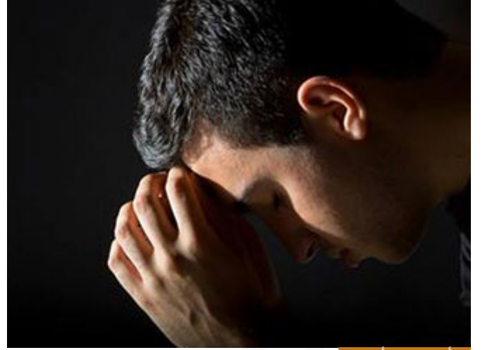
إذا أذنبت يجب أن تتوب

لكن المقصود أن الذي لم يذنب ولا يتوب إذا أصبح لا يشعر بذنبه، والله يحب أن يسمع صوتك فيحب منك إذا أذنبت أن تتوب فالذنب واقع واقع، لكن المؤمن إن شاء الله لا يذنب بالكبائر لأن الكبائر توقعه في حرج شديد، ثم لا يصر على المعصية هذا فرق المؤمن عن غيره، أما البعيد عن الله عز وجل تكثر ذنوبه ويرتكب الكبائر ويصر على معاصيه ولا يراها شيئاً فلذلك يقول النبي صلى الله عليه وسلم: المؤمن ذنبه كالجيل جاثم على صدره، مثل الجبل يجثم على صدره، ثقيل الذنب عليه، والمنافق ذنبه كذبابٍ طار على أنفه فقال هكذا فطار، هنا قال بمعنى أشار تأتي في اللغة، فقال هكذا، فطار يعني ما انتبه ما الذي فعله بسيطة، ربك لن يدقق علينا نحن أمة مرحومة بهذا المعنى، نحن أمة مرحومة طبعاً لكن مرحومة بحق عندما تكون على المنهج.