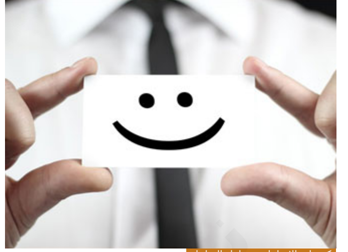
ركز على الإيجابيات وتجاهل السلبيات

الآن أمر آخر، عندما قال النبي صلى الله عليه وسلم: إِنَّهُ قَدْ شَهِدَ بَدْرًا، ما معنى ذلك؟ معنى ذلك أنه عندما تقع في إشكال معين أو تقع في مشكلة معينة فلا تنس الإيجابيات، ركز على الإيجابيات وتجاهل السلبيات، النبي صلى الله عليه وسلم ذكر أعظم إيجابية له قال: "إِنَّهُ قَدْ شَهِدَ بَدْرًا"، بعض الناس اليوم إذا أخطأت معه خطأ يهدر لك ماضيك كله، وحتى في علاقتنا اليوم، يخطئ إنسان خطأ وهذا خطأ وينبغي أن يشار للخطأ بالخطأ وخصوصاً إذا أخطأ على العلن ولم يعتذر فلا بد أن نقول: هذا خطأ، لكن لا تهدر للإنسان كل عمله بمجرد أنه أخطأ خطأ، هو أخطأ في هذا الأمر لكن كان له ماضٍ صحيح، موظف عندك يتأخر عن الدوام لأكثر من مرة، ولكنه مخلص في عمله، ما علمت عنه يوماً أنه اختلس ديناراً، فالآن إن أردت أن تعاتبه قل له: والله إنني لأعلم من إخلاصك ومن أمانتك الشيء الكثير، ولكن بسوؤني هذا التأخر المتكرر فهو بسيء إلى العمل، لكن ذكره بالإيجابيات قبل أن توجه وتعاتب في السلبيات، بعض الناس يتجاهل الإيجابيات ويركز عينه على السلبيات وهذا خطأ كبير كبير جداً، وحتى للزوجات وللأزواج، النبي صلى الله عليه وسلم قال: يَكْفُرَنَّ العَشِيرَ، وَيَكْفُرَنَّ الإِحْسَانَ، لَوْ أَحْسَنْتَ إِلَى إِحْدَاهُنَّ الدَّهْرَ، ثُمَّ رَأَتْ مِنْكَ شَيْئًا، قَالَتْ: مَا رَأَيْتُ مِنْكَ خَيْرًا قَطُّ.