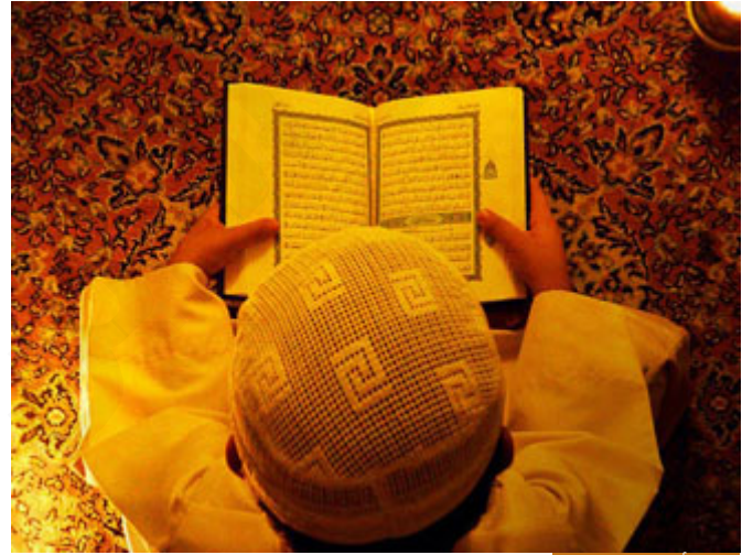
العلم أقوى من المال

{ <span style="font-weight:bold">المؤمنُ القويُّ</span> خيرٌ وأحبُّ إلى اللهِ من المؤمنِ الضعيفِ وفي كلِّ خيرٍ { (أخرجه مسلم عن أبي هريرة)