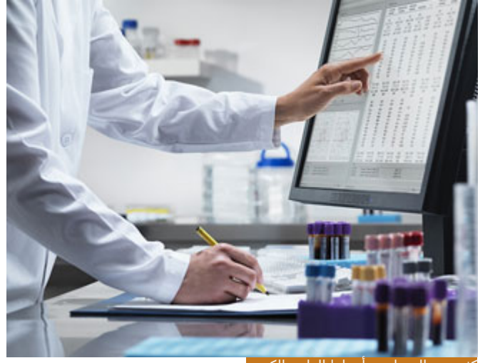
كثير من المسلمين أهملوا العلوم الكونية

الآن العلوم كلها مرتبطة بالخالق -جلّ جلاله- يوم قسّم العلماء العلوم إلى شرعية وكونية فهذا تقسيم مدرسي، لكن لا يُتوهم أن العلوم الكونية خارج الشرع، أو أن الشرع لم يأمر بالعلوم الكونية، أو أن العلوم الكونية ينبغي أن تمارس بمعزل عن الدين كما يمارسها الغرب، مشكلتنا في الشرق أننا ضعيفو الأخذ بالعلوم الكونية اليوم، في التاريخ نحن سباقون في العلوم الكونية يعني مثلاً اليوم تنسب قوانين الضوء إلى كبلر المتوفى 1040 هـ، لكن هي في الأصل لابن الهيثم المتوفى 432 هـ قبله بـ600 عام تقريباً، الدورة الدموية ينسبونها اليوم إلى هارفي الذي توفي 1068 هي لابن النفيس العربي المسلم الذي توفي 687 هـ، نجهل أن مؤسس علم الجبر -وكلمة الجبر في الأصل كلمة عربية (Algebra) الذي هو الجبر- عربي هو الخوارزمي الذي توفي 232 هـ، فتخيل حتى علوم الفلك حتى العلوم الأخرى، فأحدث عن واقعنا اليوم الشرق، العرب، كثير من المسلمين أهملوا العلوم الكونية، الغرب اهتم بالعلوم الكونية لكن بمعزل عن الإيمان فالموقفان فيهما خطأ، لا شك أن خطاهم أكبر لأن فيه بعداً عن الإيمان، لكن لا يعني أن موقفنا في الإعراض عن العلوم الكونية والاهتمام بسير أغوار الكون وعمارة الأرض، والله تعالى من مقتضيات أو من مقاصد خلقنا: