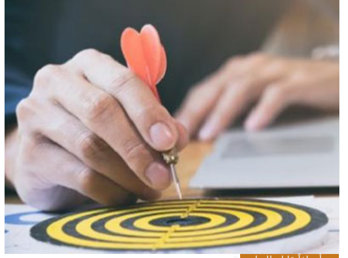
ضع أهدافاً قابلة للتطبيق

مغترب أقوم بانصاليين أو ثلاثة أهنئهم بشهر رمضان وأتواصل وأرى ما حاجاتهم، إن كان لدي إمكانية أن أدفع طيلة الشهر 100 دينار ممكن أن أجزئها وأخرجها صدقة، ضع أهدافاً قابلة للتطبيق، لا تبدأ ب1 رمضان إلى 7 رمضان وهمتنا في أوجها، وفي 8 رمضان نعود للتراجع ونذهب للأسواق للتسوق للعديد، دع الأهداف واقعية وقابلة للتطبيق، ولو كانت قليلة ولكن جانب الإخلاص فيها عال، كما تكلمنا قبل قليل عن الكم والكيف.