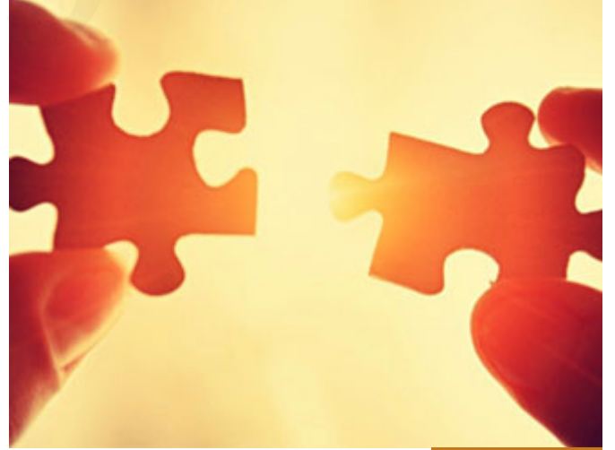
الصبر والتقوى متلازمان

فالصبر والتقوى متلازمان، فالصيام مدرسة للروح في الصبر، نحن عندما نترك الطعام والشراب في نهار رمضان إنما نترك ذلك مختارين، لكننا نعلم أن هناك من ترك الطعام والشراب في رمضان وغيره مضطراً لا مختاراً؛ لأنه لا يجد ما يأكله، فنشعر بالفقراء، ونتعلم في مدرسة الصبر أن نصبر على كل شيء، "الصبر مطية لا تكبو" كان عمر رضي الله عنه يقول: "وجدنا خير عيشنا في الصبر" لم يقل في حالة الرخاء، وإنما في حالة الشدة، عندما كانوا يُسامون سوء العذاب في مكة كانوا يجدون خير عيشهم؛ لأن الصبر مرتبة راقية جداً، لا يعرفها إلا المخلصون العالمون: