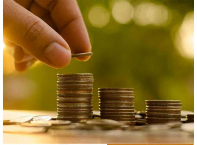
الاستزادة من الطاعات شيء فيه خير

هذه طبيعة النفس، هل هذه الطبيعة صحيحة؟ هي من زاوية معينة يمكن أن يكون فيها خير، لأن كل شيء حيادي، الاستزادة من الطاعات شيء فيه خير، يعني بالإففاق مثلاً أكيد إذا أنفق أحدهم مئة، إذا أنفق مئتين أفضل، بالظاهر الذي ينفق مئة فالمئة تشتري 10 كيلو لحمه مثلاً، مئة دينار هنا في الأردن تشتري 10 كيلو لحمه، المئتين تشتري 20 كيلو لحمه للفقير، فالمئة أفضل أم المئتان؟ أكيد المئتان أفضل، هذا بالظاهر لنا نحن، فمن زاوية معينة ربما يكون الاستزادة من الطاعات شيء جيد، ولكن هل هذا صحيح إذا كان على حساب النوع؟ بالتأكيد لا، هل هذا صحيح إذا كان على حساب الكيف؟ بالتأكيد لا، بمعنى إذا إنسان دفع مئة دينار مخلصاً لوجه الله تعالى، وآخر دفع ألفين يرائي بها ليقال فلان منفق، فأيهما أفضل؟ بلا شك المئة، مئة دينار أفضل من ألفين، لذلك