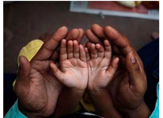
المؤمن يشعر بالنعمة في كل وقت

إذاً في آيات الصيام هناك تقوى، وهناك رشاد، وهناك شكر، تحقق من التقوى، تحقق من الرشد يقولون: فلان بالغ عاقل راشد، يعني يفهم طريق الله تعالى، وتحقق من شكر الله على نعمه؛ لأننا نشعر بأهمية النعم، الإنسان متى يشعر بالنعمة؟ عندما يفقدها، المؤمن يشعر بالنعمة في كل وقت، لكن لا بد أن يُذكر بين الحين والآخر، لذلك نقول: اللهم أرنا نعمك بدوامها لا بزوالها كما ندعو الله تعالى، أن نرى نعم الله بدوامها. فكيف يشعر بها أكثر؟ عندما لا يجدها في نهار رمضان، يشعر بكم هي أهمية الطعام، هارون الرشيد -أمير المؤمنين- سأله أحدهم قال له: بكم تشتري كأس الماء هذا إن مُنِعَ عنك؟ قال بنصف ملكي، قال إن مُنِعَ عنك إخراجها قال بنصف ملكي الآخر، قال: إذا ملكك لا يساوي شربة ماء وإخراجها، فتحن يعمورون، عارفون بنعم الله تعالى ولكننا غافلون، لذلك قال تعالى في نهاية آيات الصيام وَلِتُكْمِلُوا الْعِدَّةَ وَلِتُكَبِّرُوا اللَّهَ عَلَىٰ مَا هَدَاكُمْ [ وهداكم إلى التقوى في رمضان، هداكم إلى الصبر، هداكم إلى الشكر وَلَعَلَّكُمْ تَشْكُرُونَ ].