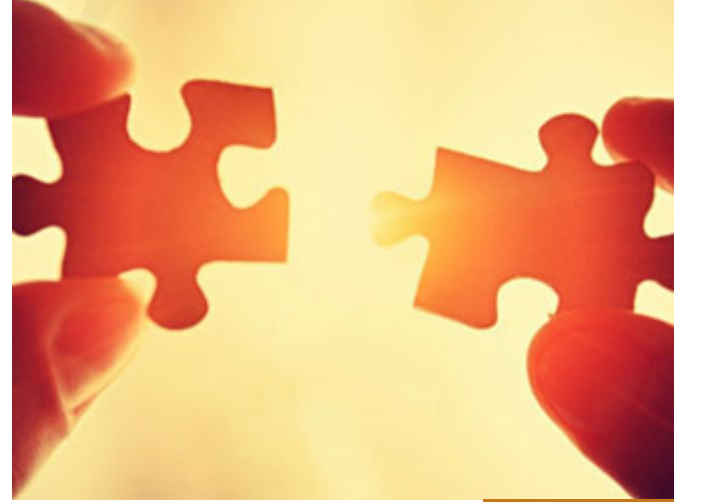
الصبر والتقوى متلازمان

فالصبر والتقوى متلازمان، فالصيام مدرسة للروح في الصبر، نحن عندما نترك الطعام والشراب في نهار رمضان إنما نترك ذلك مختارين، لكننا نعلم أن هناك من ترك الطعام والشراب في رمضان وغيره مضطراً لا مختاراً؛ لأنه لا يجد ما يأكله، فنشعر بالفقراء، ونتعلم في مدرسة الصبر أن نصبر على كل شيء، "الصبر مطية لا تكبو" كان عمر رضي الله عنه يقول: "وجدنا خير عيشنا في الصبر" لم يقل في حالة الرخاء، وإنما في حالة الشدة، عندما كانوا يُسامون سوء العذاب في مكة كانوا يجدون خير عيشهم؛ لأن الصبر مرتبة راقية جداً، لا يعرفها إلا المخلصون العالمون: